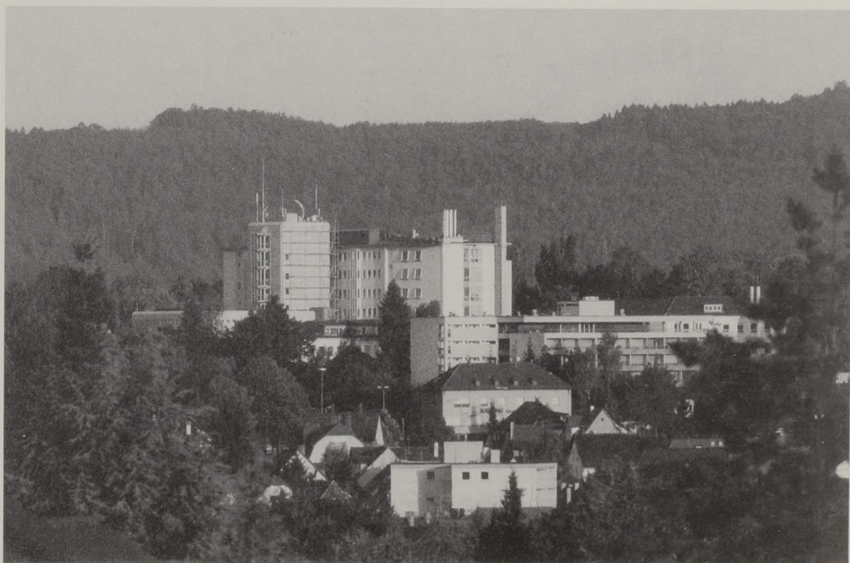
Abb. 1: Das Kreiskrankenhaus Backnang im Jubiläumsjahr 1999.

wahrung der Toten und zu etwaigen Sektionen um jährlich 60 Gulden“ gemietet. Das Armenhaus befand sich in dem früheren Gebäude Ecke Stuttgarter Straße/Blumenstraße, oberhalb der Eisenbahnüberführung. Am 26. Dezember 1866 wurde die Einrichtung eines Bezirkskrankenhauses nach dem Plan von Oberamtsbaumeister Holch beschlossen. Als Bauplatz war ein Garten gegenüber dem städtischen Armenhaus vorgesehen, auf dem sich heute der „Deutsche Kaiser“ und die Bahnlinie befindet. Schließlich jedoch wurde ein Platz von Metzgermeister Jung in der Erbstettener Straße erworben (bis vor kurzem Hauptpost). Mit dem Beschluss vom 26. Dezember 1866 erklärte sich die Amtskörperschaft Backnang für die überörtliche Armen-, Obdachlosen- und Krankenfürsorge des Bezirkskrankenhauses für zuständig. Der Aufwand für den Bau des Kran-