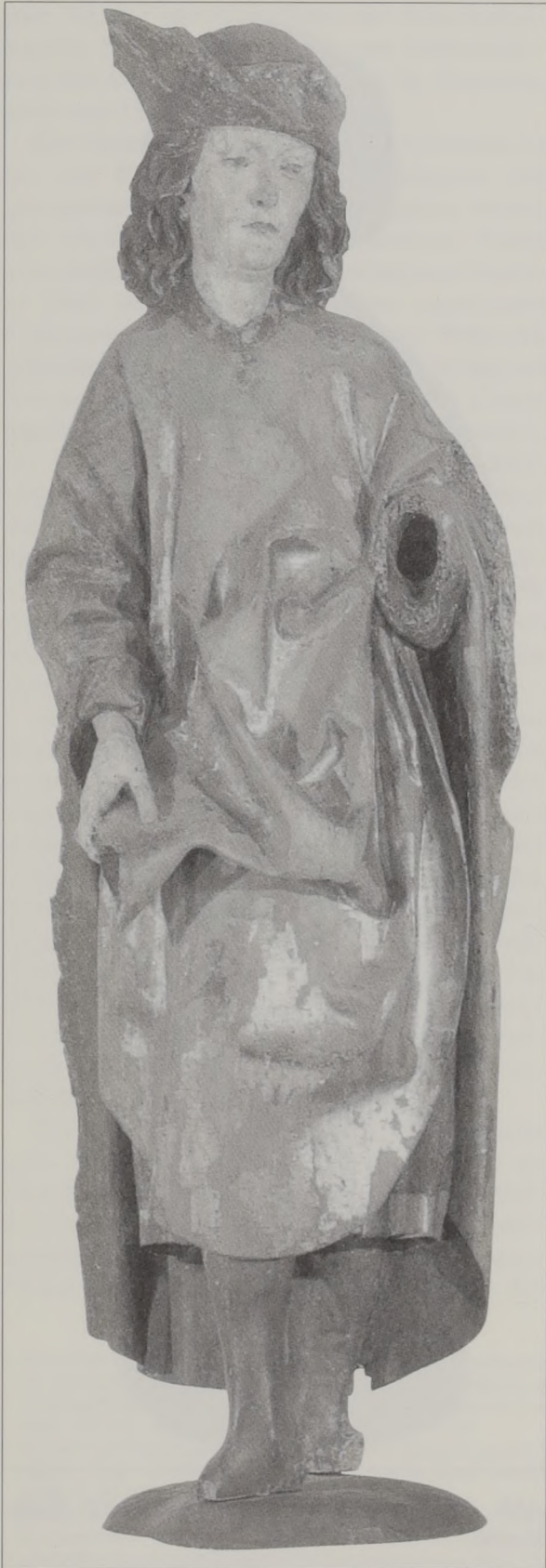
Abb. 3: Sebastian – Murrhardt, Stadtkirche.