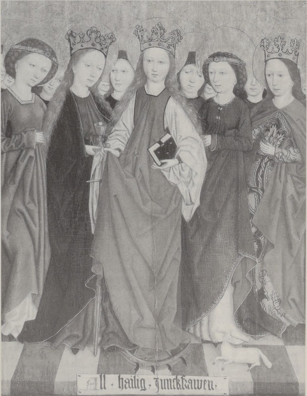
Abb. 11: Eine Schar von heiligen Jungfrauen – Murrhardt, Stadtkirche.

halter verfolgt und gemartert wurde. Nachdem sie von ihren Peinigern gezeißelt wurde, die ihr die Brüste abschnitten, wurde sie enthauptet. Als einer der Vierzehn Nothelfer war sie eine