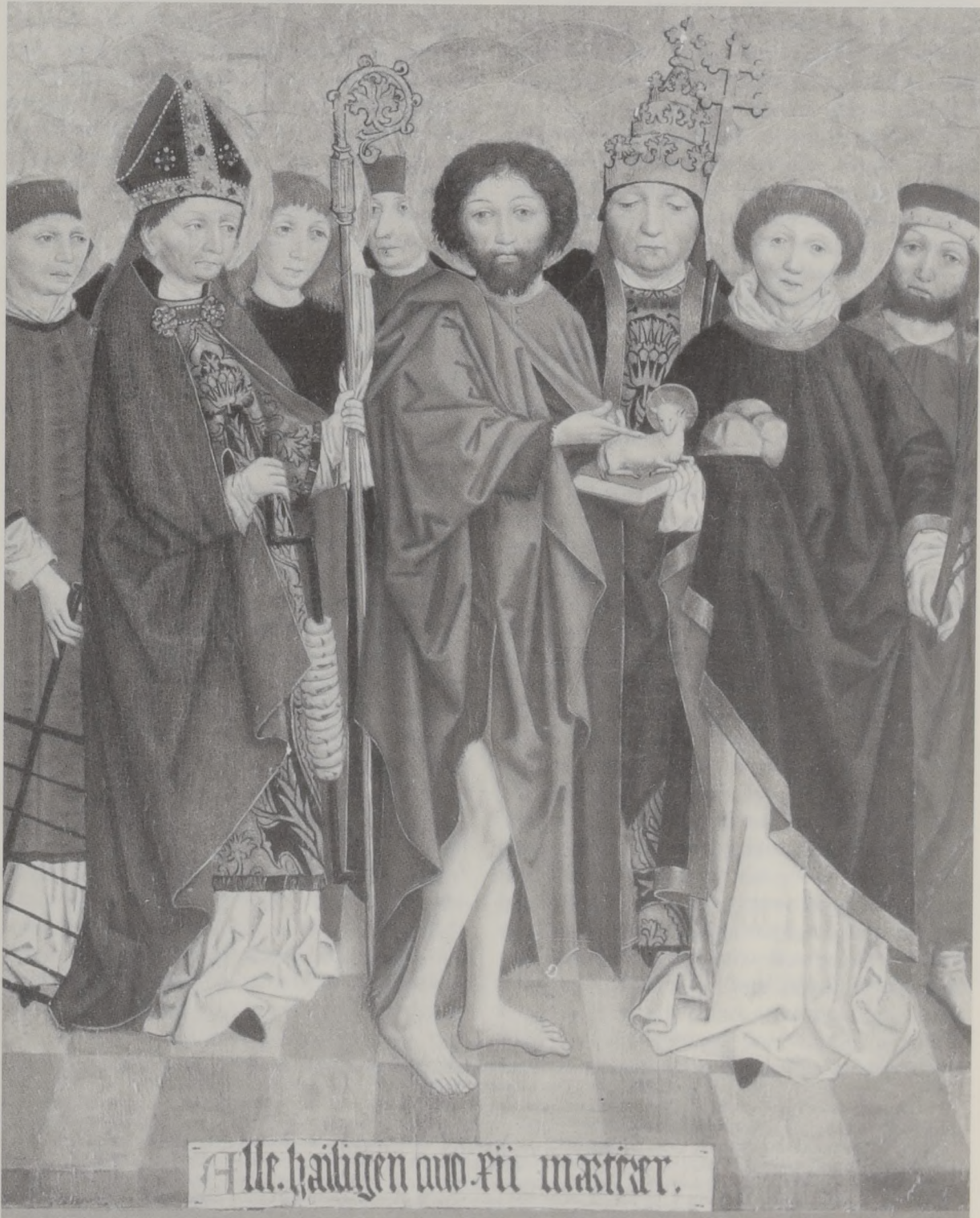
Abb. 6: Eine Schar von männlichen Heiligenfiguren – Murrhardt, Stadtkirche.

einem Buch in seiner linken Hand trägt. Diese Geste ist der Hinweis auf den Spruch von Johannes bei seiner Begegnung mit Christus: Ecce agnus dei qui tollit peccata mundi (Siehe das Lamm Gottes, das hinwegnimmt die Sünden der Welt), (Joh. 1, 29).