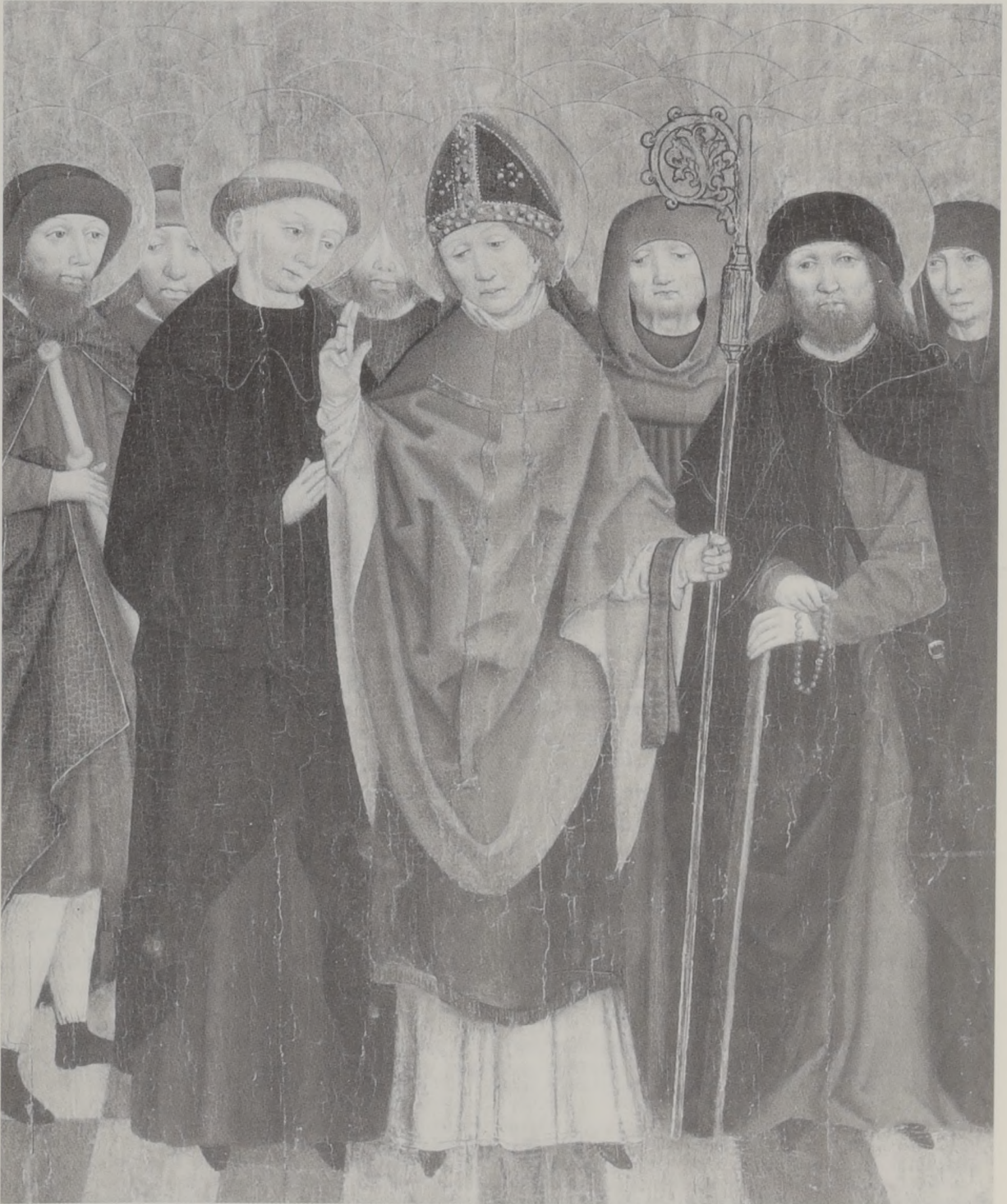
Abb. 14: Männliche Heiligenfiguren – Murrhardt, Stadtkirche.

chen Merkmalen wiedergeben. 135 Im Gegensatz zu den Ordensgewändern der Franziskaner ist das weitärmelige Gewand der Murrhardter Figur ungegürtet und hat einen großen, vorne geschlitzten Kragen. Der Hl. Benedikt von Nur-