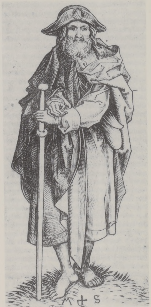
Abb. 15: Apostel Jakobus d. Ä., Kupferstich von Martin Schongauer. L. 44. Inv. Nr. 1973:21

Rechts von Januarius steht ein in Pilgertracht gekleideter Heiliger, Wendelin (20. Oktober). Er gehört ebenfalls zu den Heiligen, die Gott in der Einsamkeit suchten. Als Sohn eines irischschottischen Königs verzichtete er auf den Thron und ging – nach einer Rom-Wallfahrt – in die Wildnis von St. Wendel bei Trier. Dort lebte er als Hirte und betete zu Gott. An dieser Stelle wurde er auch begraben, und hier entstand eine Wallfahrtstelle, die sich zur Stadt St. Wendel (Saarland) entwickelte. Er war der Schutzpatron der Schäfer und Viehzüchter. In unserer Gegend spielte der beliebte Volksheld in Winnenden eine große Rolle; er war der Schutzpatron der Stadt, was vielleicht mit den ähnlich klingenden Namen zu erklären ist. Auch eine Kapelle ist nach ihm benannt worden und wir finden ihn auch unter den Figuren des Jakobusaltars der Schlosskirche von 1520. 137 In Weinstadt/Schnait war er ebenfalls der Schutzpatron der Kirche und ist auch im auf 1497 datierten Retabelschrein vertreten. 138 Der Ikonographie entsprechend ist er auf dem Murrhardter Gemälde mit einem Hut, bärtig, mit einer Tasche und dem Rosenkranz sowie mit einem Stab dargestellt. Allerdings ist sein Stab einfach geformt, ohne Knauf und nicht gedrechselt. Über seinem roten Gewand trägt er einen weit geschnittenen, pellerinenartigen, schwarzen Mantel.