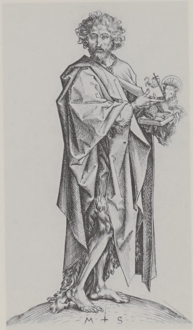
Abb. 7: Martin Schongauer: Johannes der Täufer, Kupferstich, L. 59. Inv. Nr. 140912.

Der Maler des Murrhardter Bildes griff auf eine graphische Vorlage Schongauers zurück und adaptierte dessen Kupferstich mit der Darstellung Johannes des Täufers in seine Darstellung der Heiligenversammlung (Abb. 7). 107 Schongauers monumental und statuarisch wirkende Figur ist etwas lebendiger, nicht zuletzt durch die lockigen und wirren Haaren und des Bartes sowie durch die feinen Schattierungen. Auch die psychologische Ausdruckskraft des asketischen Predigers kommt besser zur Geltung. Dennoch stimmen beide Darstellungen völlig überein. Faltenführung und Gewandelemente ähneln sich bis auf das kleinste Detail. Voluminös und raumhaltig sind die großformati-