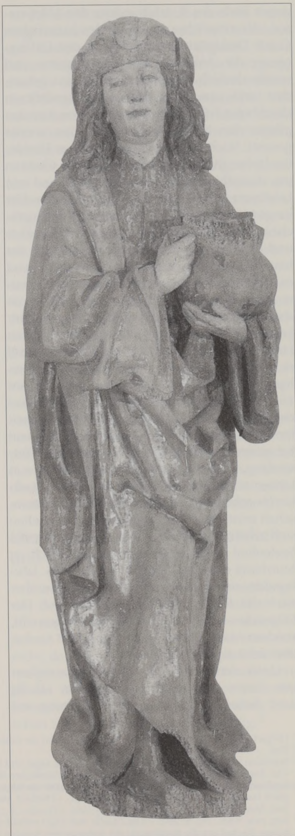
Abb. 4: Veit – Murrhardt, Stadtkirche.

Nach der Überlieferung von Ambrosius starb der aus Mailand stammende Sebastian in Rom