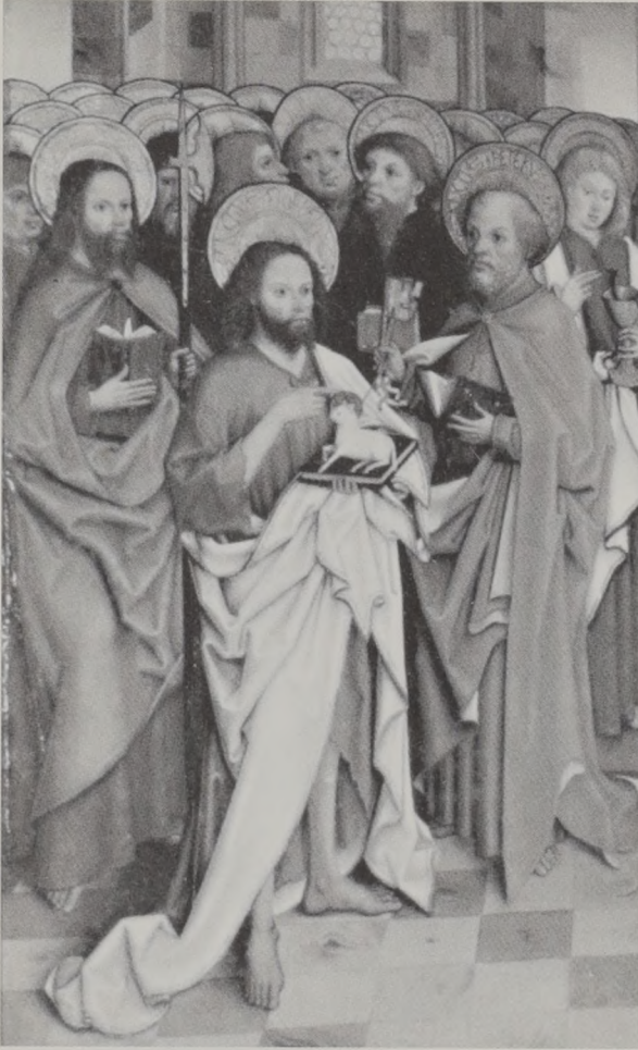
Abb. 10: Tafel mit männlichen Heiligenfiguren aus dem ehemaligen Flügelaltar der Wengenkirche, heute in der Neithartkapelle des Ulmer Münsters.

wurde auf einem Rost am 10. August 258 zu Tode gemartert. Konstantin errichtete über seinem Grab im Jahr 330 die Kirche S. Lorenzo fuori la mura in Rom, die zu den sieben Hauptkirchen gehört. Zusammen mit den Gebeinen des Stephanus ruhen die sterblichen Überreste des Laurentius in der Krypta. 115