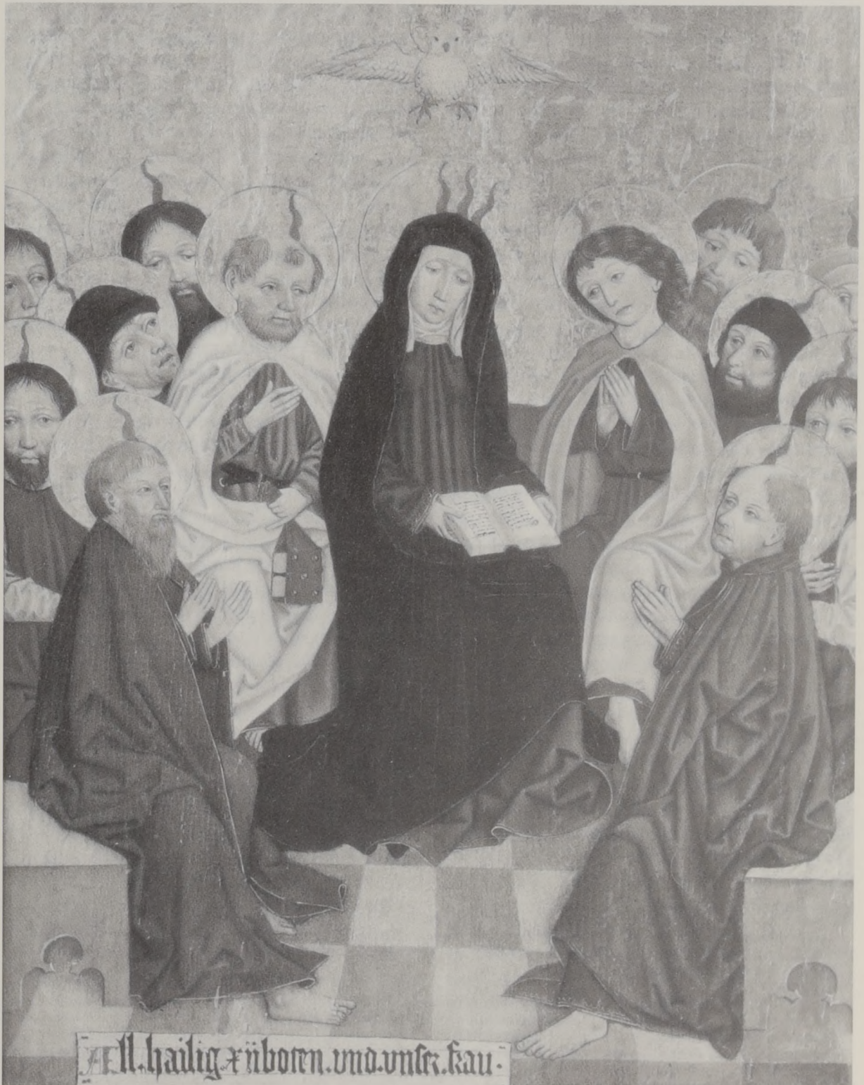
Abb. 5: Das Pfingstereignis – Murrhardt, Stadtkirche.

sakralen Bestimmung mit weltlichen Zügen ausgestatteten Wesensart, verbindet die Talheimer Heiligen mit den Murrhardter Figuren. Jenseits von Leid und mit einem beseelten Gesichtsausdruck vermitteln die Figuren das