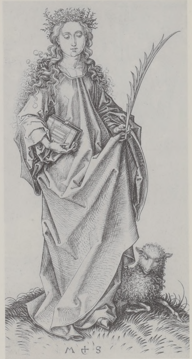
Abb. 12: Agnes von Martin Schongauer, Kupferstich. L. 67. Inv. Nr. 31-1885

Dorothea ist ohne Attribute, von schlanker Statur, mit gesenktem Kopf am linken Bildrand dargestellt. Sie trägt ein rotes Kleid mit eng