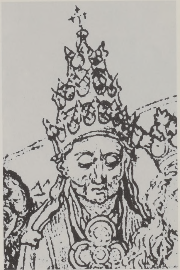
Abb. 9: Papstdarstellung von Schongauer (Detail).