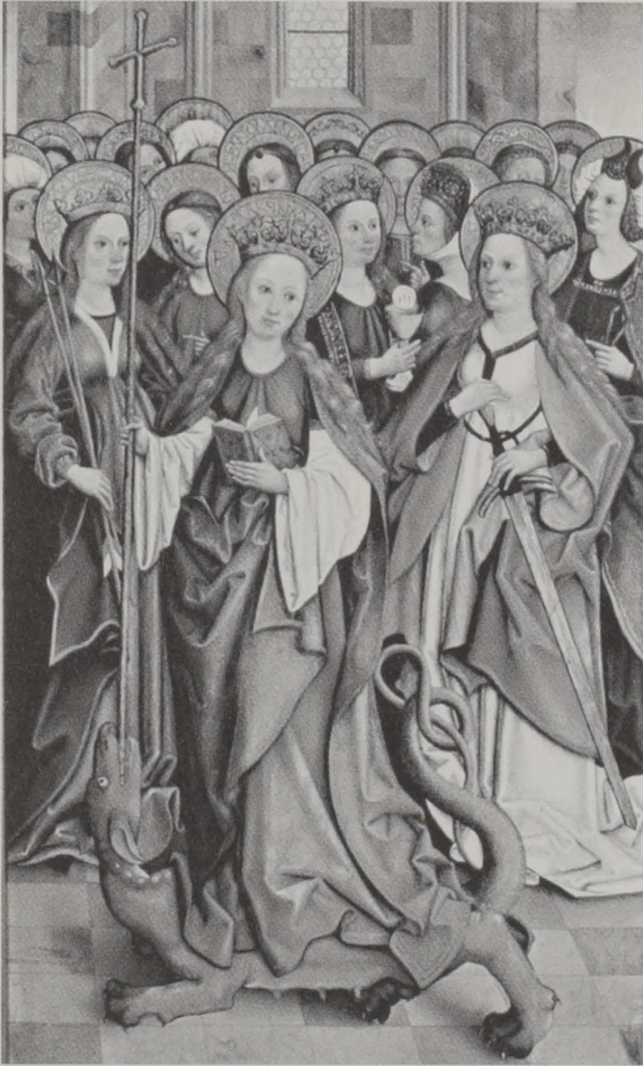
Abb. 13: Tafel mit weiblichen Heiligenfiguren aus dem ehemaligen Flügelaltar der Wengenkirche, heute in der Neithartkapelle des Ulmer Münsters.

Der Schreiber Theophilus sagte spöttisch zu ihr, sie solle ihm aus dem Garten ihres Gemahls Rosen und Äpfel schicken. Daraufhin erschien ein goldlockiger Botenknabe mit einem Blumenkorb, und der ungläubige Mann wurde bekehrt. Besonders in Deutschland war Dorothea beliebt, vor allem als Schutzpatronin der Gärtner, Wöchnerinnen und Bergleute. 128