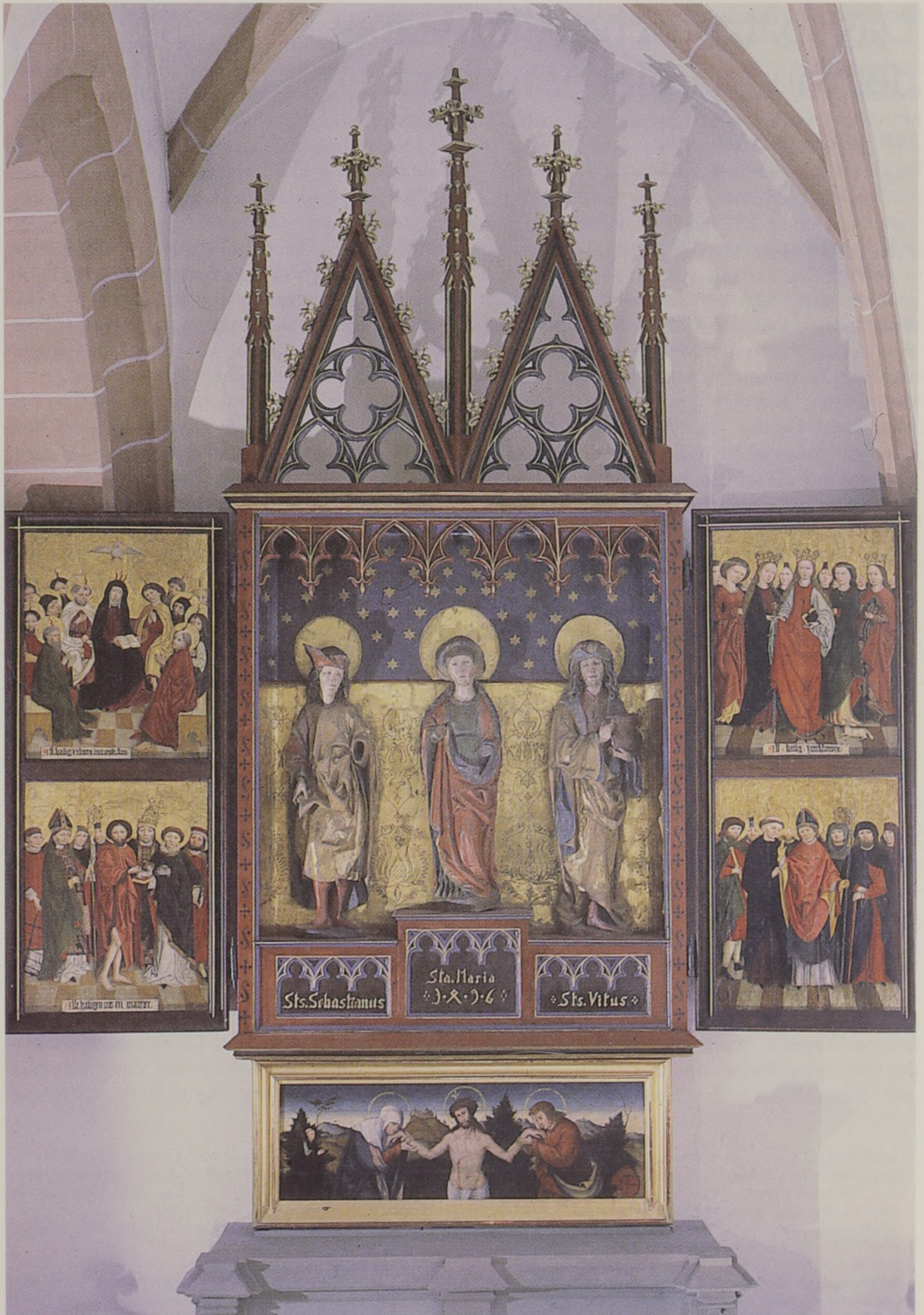
Abb. 1: Gesamtaufnahme des Schreins mit Flügel und Predella.