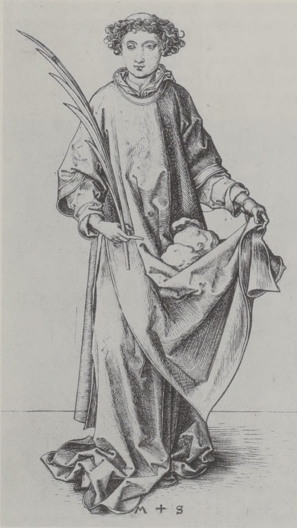
Abb. 8: Stephanus von Martin Schongauer – Kupferstich, L. 66. Inv. Nr. 289-1889.

blom stellte auf einer der Tafeln des Wengen-Retabels Johannes den Täufer ebenfalls als mittlere Figur dar (Abb. 10). Auf der vielfigurigen Komposition des gleichen Themas, einer Schar von männlichen Heiligen, die unverkennbare Übereinstimmungen mit der von Murrhardt zeigt, ist er zwar in Dreiviertelansicht und mit einem anderen Faltensystem wiedergegeben, aber es ist weder ein enger Zusammenhang zwischen den drei Werken von Schongauer, Zeitblom und dem Meister von Murrhardt, noch ein lokaler Bezug des letzteren Malers zu Ulm zu leugnen. 110 Noch mehr Ähnlichkeit weist trotz abweichender Kopfhaltung die Johannesfigur des Meisters des