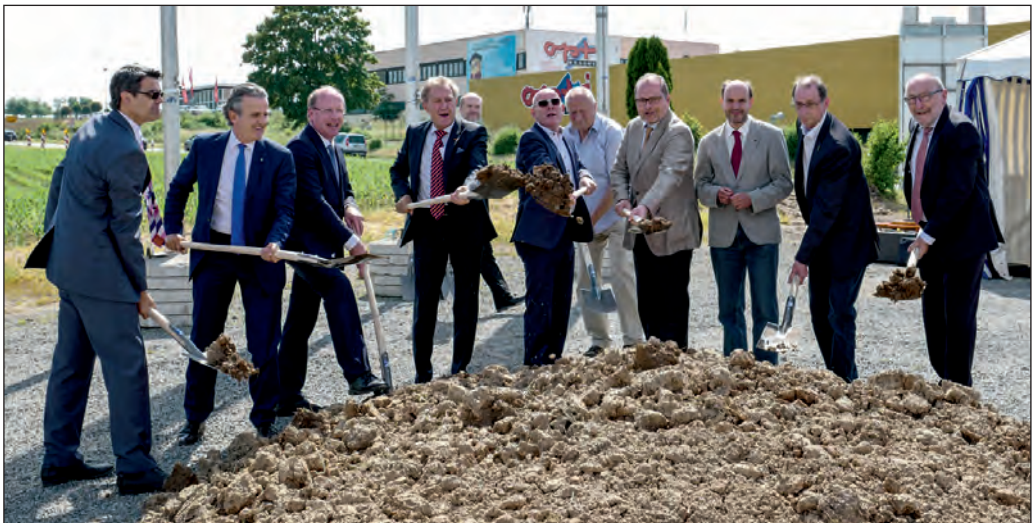
Viel Politprominenz beim Spatenstich für den Ausbau der B 14 von Nellmersbach nach Maubach.