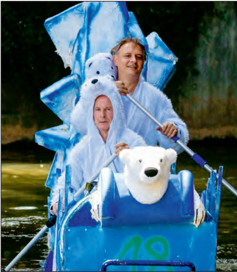
Eines der zahlreichen originellen Boote bei der Juze-Murr-Regatta.

Auf dem Stiftshof gibt es die 26. Auflage des internationalen Kulturmarkts. Das Zusammenbringen der verschiedenen Kulturen bei Essen, Musik und Tanz ist das Anliegen dieser Veranstaltung, in die auch eine große Zahl an Flüchtlingen eingebunden ist.