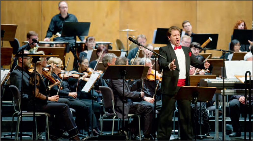
War auch im Bürgerhaus ein Genuss: Das aufgrund der Witterungsverhältnisse vom Marktplatz verlegte classic-ope(r)n-air.

Seinen 75. Geburtstag feiert Dieter Schulte. Er gehörte von 1969 bis 1998 als jeweils direkt gewählter CDU-Abgeordneter des Wahlkreises Backnang/Schwäbisch Gmünd dem Bundestag an. Von 1982 bis 1993 übte er das Amt eines parlamentarischen Staatssekretärs im Verkehrsministerium aus.