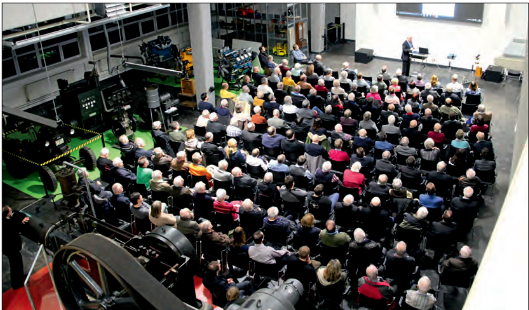
Über 160 Besucher lauschen dem ersten Vortrag des Fördervereins im neuen Technikforum Backnang.

Die Sportparty feiert mit schwungvoller Live-musik, abwechslungsreichen Showelementen und einer Vielzahl von Ehrungen ihren 25. Ge-