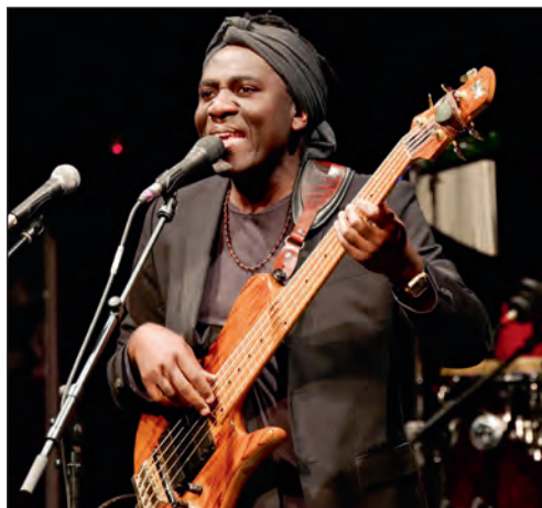
Mit Richard Bona tritt einer der weltbesten Bassisten im Bürgerhaus auf.

Das Kolping-Bildungswerk im Bildungshaus bietet jetzt auch in Backnang eine Ausbildung im Fach Physiotherapie an.