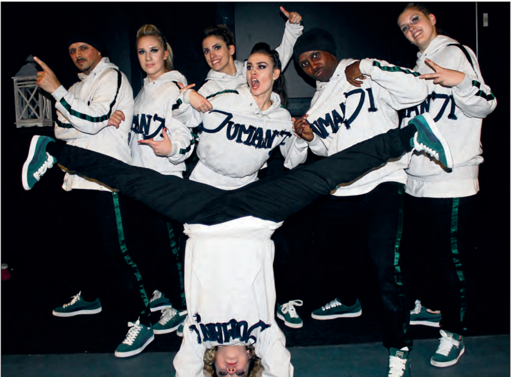
Ist Europameister im Streetdance: Die Backnanger Gruppe Jumanji.