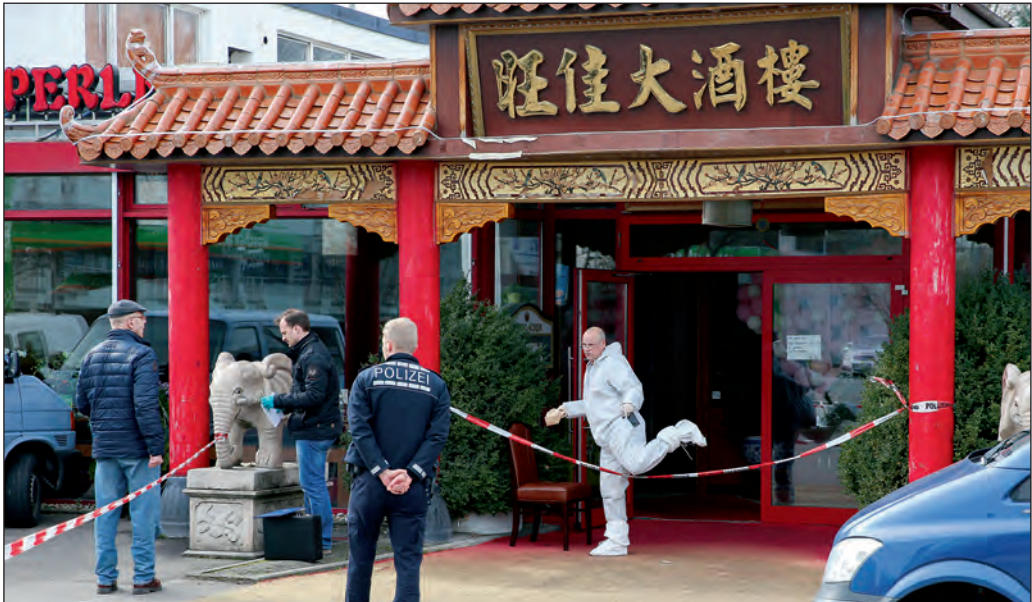
Schauplatz eines abscheulichen Verbrechens: Das Restaurant „Asien-Perle“ in der Stuttgarter Straße.