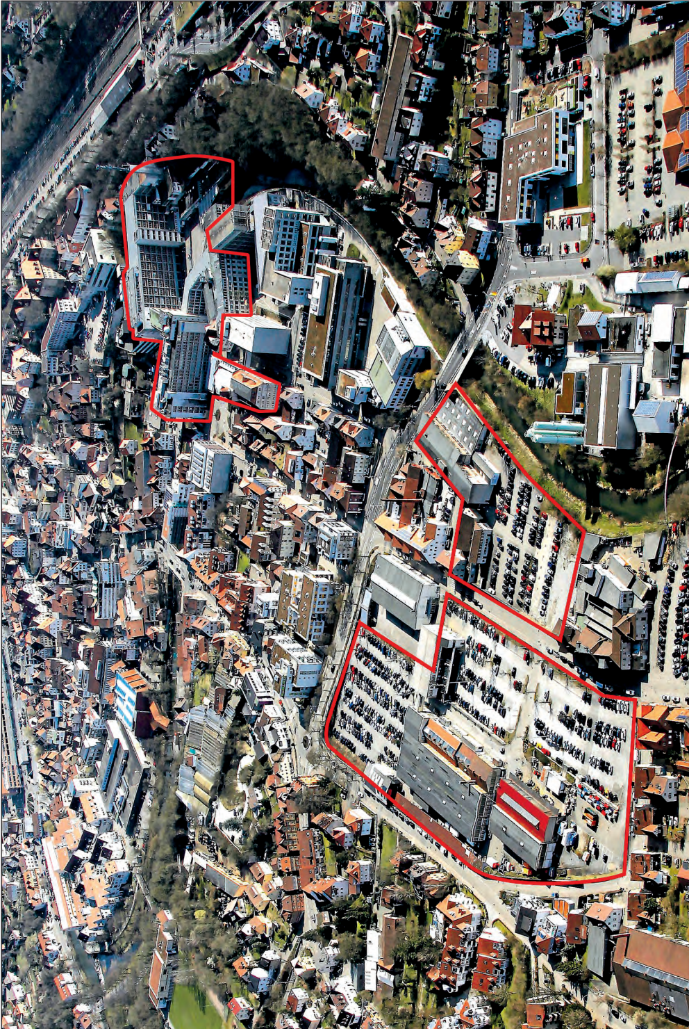
Die Riva-Holding erwirbt insgesamt sechs Hektar Industrieflächen entlang der Wilhelm- und der Gerberstraße.