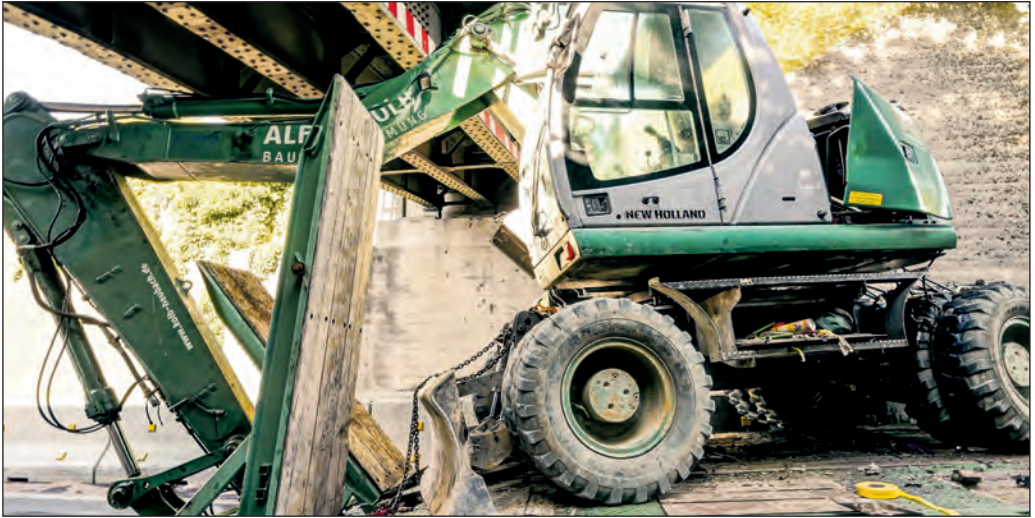
Wird bei einem Auffahrunfall so stark beschädigt, dass sie abgerissen werden muss: Die Eisenbahnbrücke der Linie Backnang-Marbach.

dass sie komplett abgerissen und ersetzt werden muss.