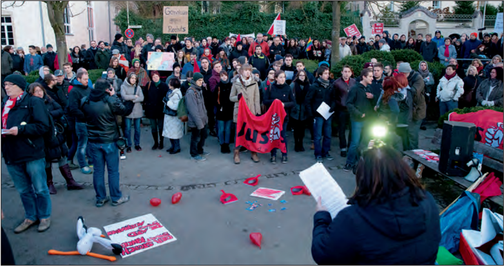
Lauter Protest gegen die AfD-Wahlveranstaltung im Bürgerhaus.