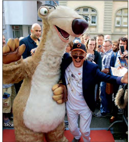
Otto Waalkes bei seiner Stippvisite in Backnang.

tionsfilm leiht er dem tollpatschigen Faultier Sid seine Stimme.