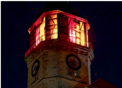
Der Stadtturm erstrahlt bei der Feierstunde zum Tag der Einheit in den deutschen Nationalfarben.

Am Vorabend des Tags der deutschen Einheit findet auf dem Marktplatz eine Feierstunde statt. Das Wahrzeichen der Stadt, der Stadtturm, erstrahlt in Schwarz-Rot-Gold.