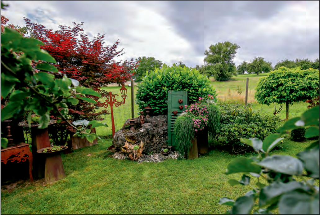
Einer der gepflegten Gärten in den Schöntalen.