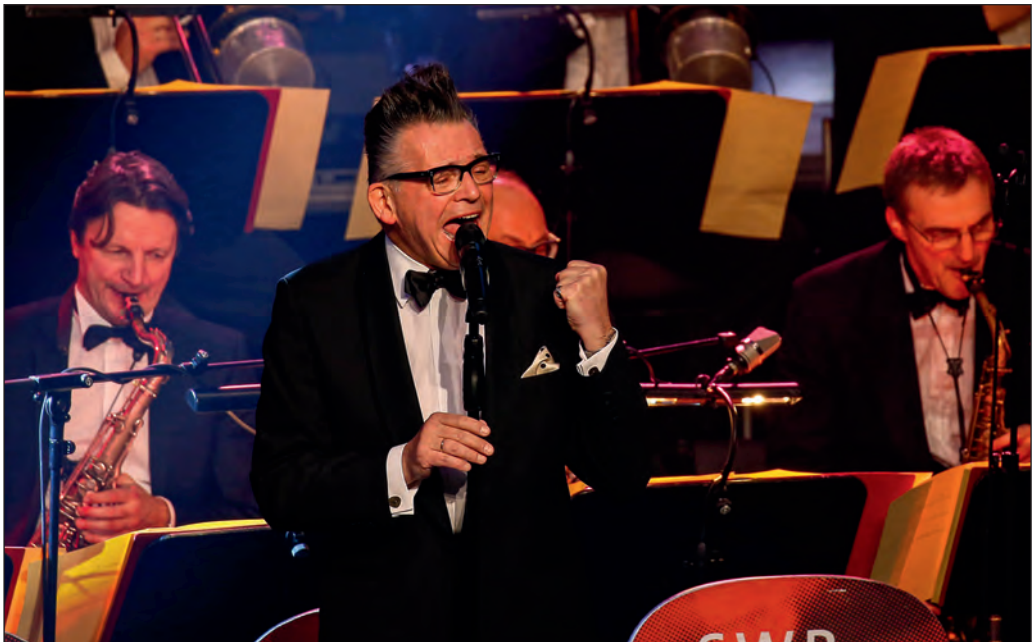
Der bekannte Entertainer Götz Alsmann bei seinem Auftritt im Bürgerhaus.

Hansa-Rostock-Fans machen nach abgesetztem Fußballspiel gegen den SG Sonnenhof Großaspach Randalie in der Gaststätte „Zur Uhr“. Sie richten ordentlichen Schaden an und verschwinden, als die Polizei anrückt, ohne die Zeche zu bezahlen. Tage später besucht der Präsident der SG Sonnenhof die Wirtsleute und sagt zu, dass der Verein für den entstandenen Schaden in der Gaststätte aufkommen wird.