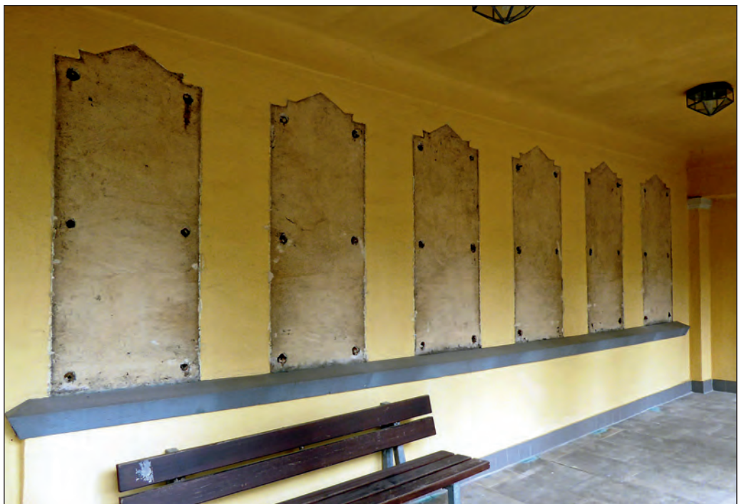
Dreier Diebstahl in der Aussegnungshalle auf dem Stadtfriedhof: Nur noch die Umrisse der Gedenktafeln sind zu erkennen.

Unbekannte stehlen auf dem Stadtfriedhof 14 große Bronzetafeln. Die Beute wird mit brachialer Gewalt aus der Wand der Aussegnungshalle herausgerissen. Auf den Tafeln stehen die Namen jener Backnanger, die im Ersten Weltkrieg gefallen sind.