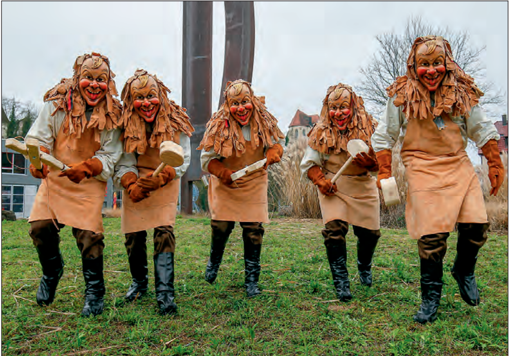
Mitglieder der neuen Brauchtumsgruppe „Backemer Träppler Buaba“ vor dem Gerbersymbol.