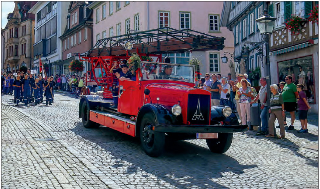
Eine historische Drehleiter beim Jubiläumsumzug der Backnanger Jugendfeuerwehr.