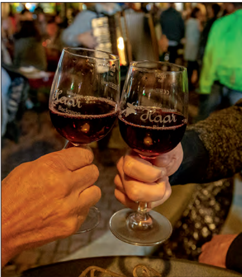
Das Weindorf auf dem Adenauerplatz ist immer für ein (oder zwei) Gläschen gut.

Auf dem Adenauerplatz findet seit nunmehr 15 Jahren das Backnanger Weindorf statt. Im Gegensatz zum Straßenfest herrscht eine entspannte Atmosphäre mit bewusst reduziert gehaltener Musik sowie einer vielfältigen Wein- und Speisenauswahl.