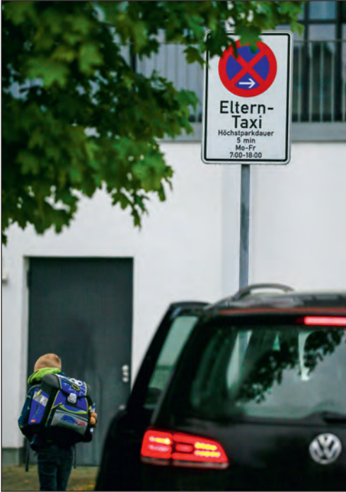
Neues „Eltern-Taxi“-Schild an der Plaisirschule, das für einen geregelten Ablauf sorgen soll.