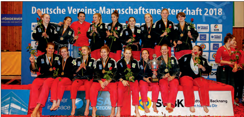
Große Freude bei den Judofrauen der TSG Backnang nach dem Gewinn der deutschen Meisterschaft vor heimischer Kulisse.

In der Stadthalle findet die erste Weinmesse statt. Die Winzergenossenschaft Aspach und Weinbau Holzwarth ziehen eine erfreuliche Bilanz. Die Besucher sind vom Ambiente und der großen Auswahl an Weinen angetan.