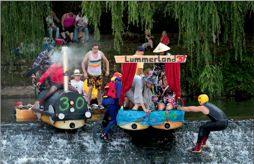
Für viele Boote bei der Juze-Murr-Regatta ein schwieriges Hindernis: Das Wehr an der Bleichwiese.