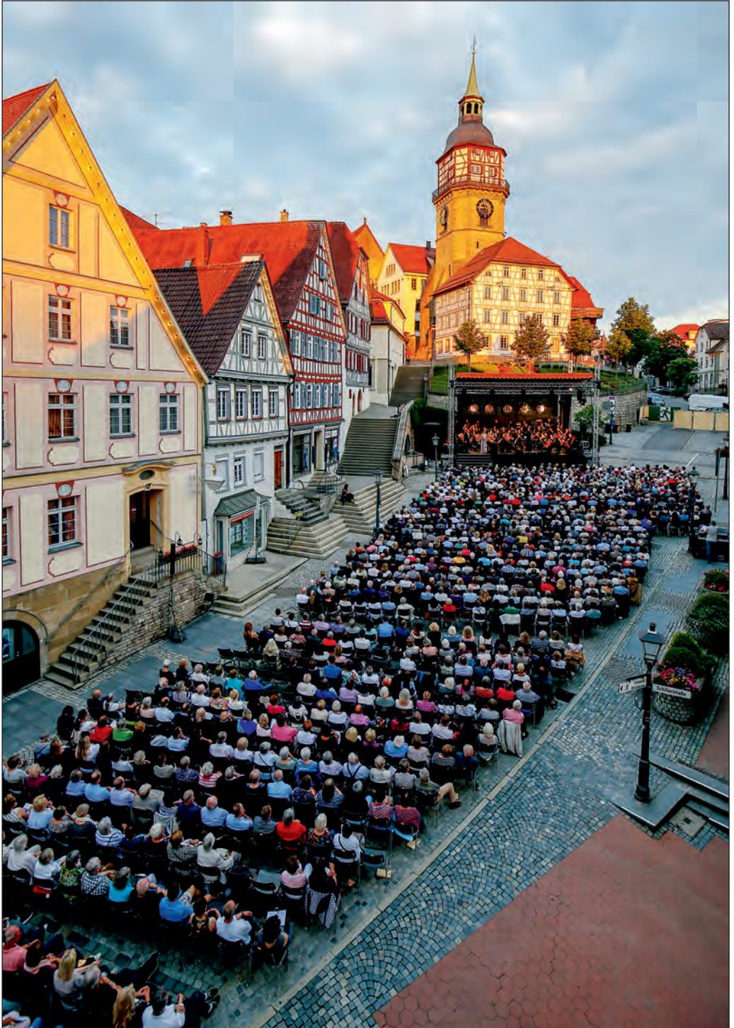
Wie immer stimmungsvolle Atmosphäre beim classic-op(e)r(n)-air auf dem Marktplatz.