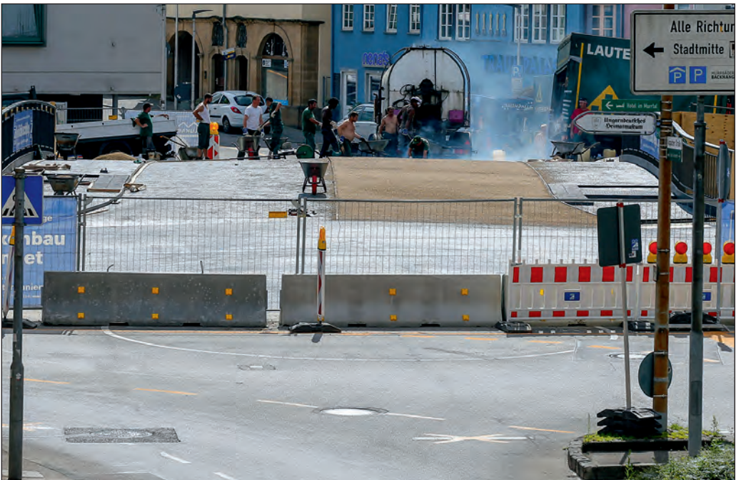
Wird gerade noch rechtzeitig zum Backnanger Straßenfest fertig: Die neue Aspacher Brücke.