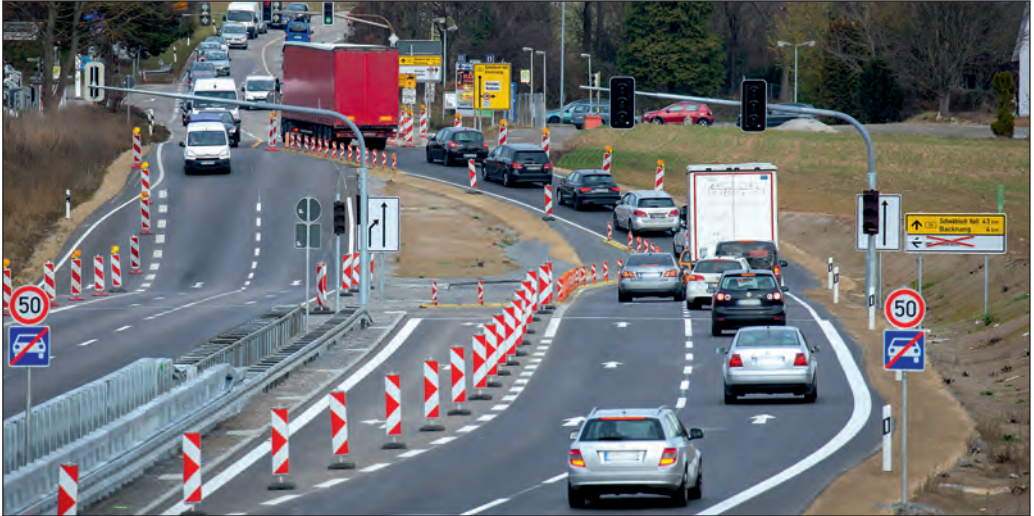
Nach rund zweijähriger Bauzeit wird der vierspurige Abschnitt der B 14 von Nellmersbach nach Backnang-Waldrems für den Verkehr freigegeben.