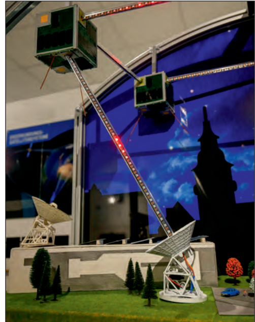
Ein Modell im Backnanger Desk-Showroom veranschaulicht, wie die vier Nanosatelliten untereinander und mit der Bodenstation kommunizieren.

Der Backnanger Karnevals-Club (BKC) hebt die „Backemer Tröppler Buaba“ aus der Taufe – eine Brauchtumsgruppe, die an das historische Gerberhandwerk in Backnang erinnern soll. Dafür wurde extra eine spezielle Holzmaske entworfen.