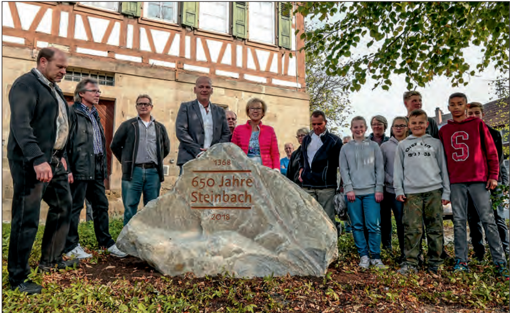
Ein Jubiläumsstein beim Rathaus wird von nun an immer an das 650-Jahr-Jubiläum von Steinbach erinnern.