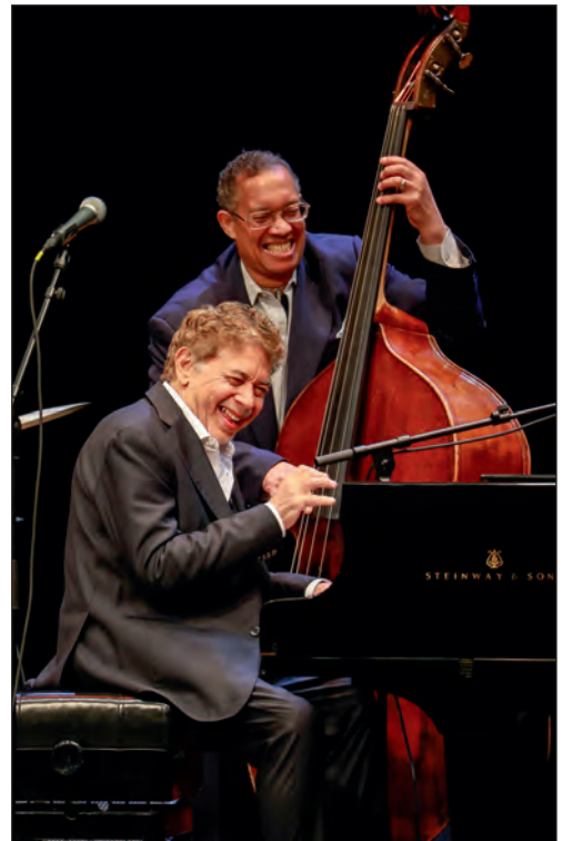
Der Jazzpianist Monty Alexander aus Jamaika hat offensichtlich viel Freude bei seinem Auftritt im Bürgerhaus.