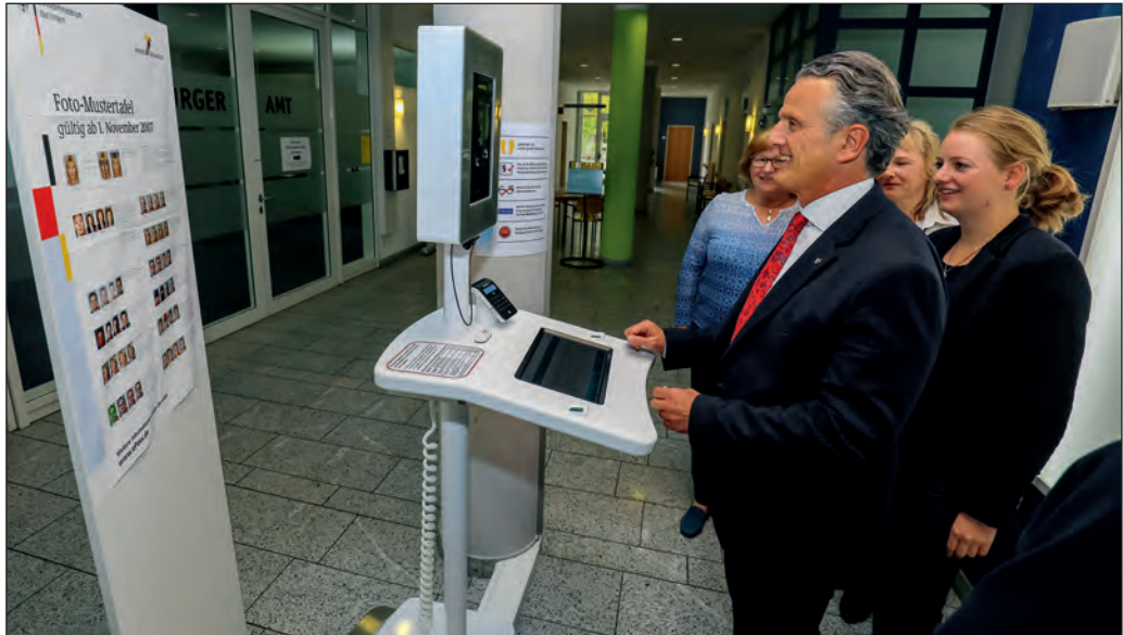
Soll die Wartezeiten verkürzen: Das Selbstbedienungsterminal im Bürgeramt.

Steinbach feiert ein Wochenende lang das 650-Jahr-Jubiläum der urkundlichen Ersterwähnung. Der Festsonntag beginnt mit einem öku-