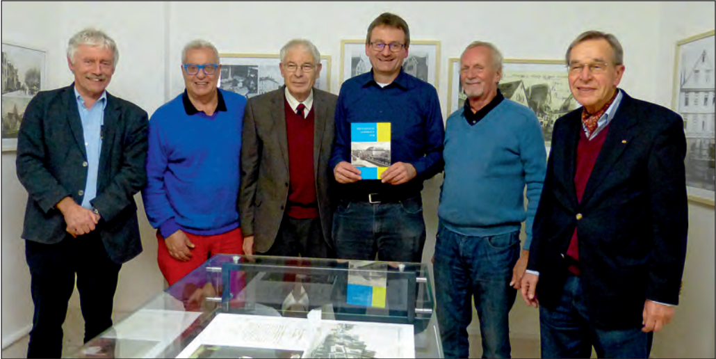
Autoren und Herausgeber präsentieren stolz den Band 26 des Backnanger Jahrbuchs.