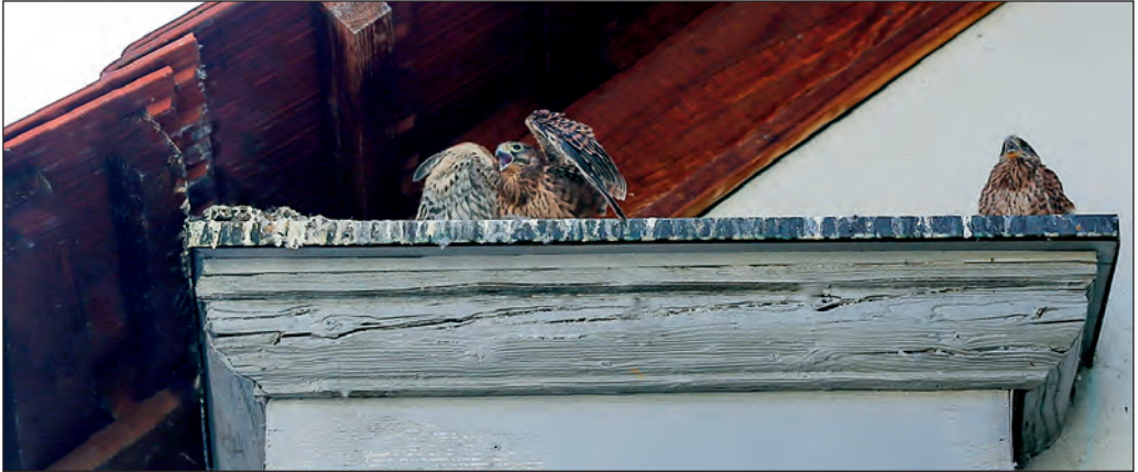
Turmfalken nisten unter dem Dach der Galerie der Stadt Backnang.

schäftsführung der ANT Nachrichtentechnik in Backnang. Seit vielen Jahren engagiert er sich an führender Stelle in der Bürgerstiftung Backnang.