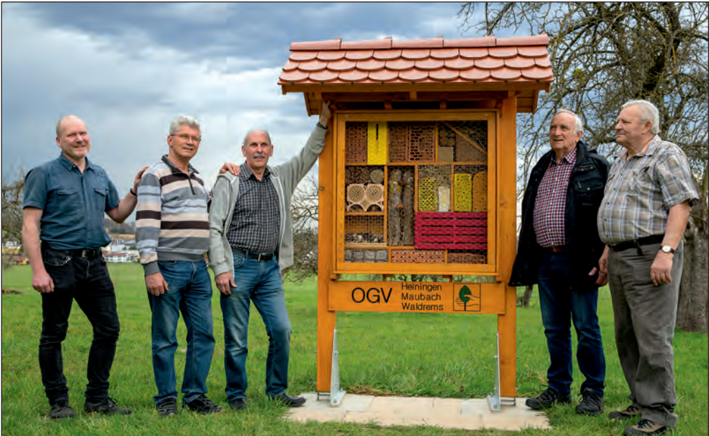
Mitglieder des Obst- und Gartenbauvereins Heiningen/Maubach/Waldrems präsentieren eines der drei Insektenhotels des Vereins.