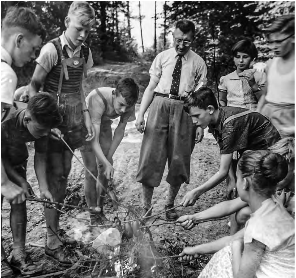
Als Lehrer mit seiner Schulklass auf einem Wandertag im Jahr 1955.