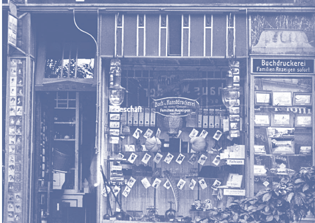
Papierhandlung in der Rheinstraße 10