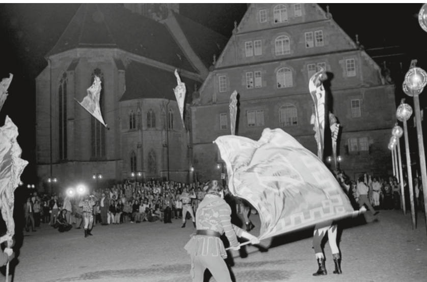
Anlässlich der „Italienischen Nacht“ trat auf dem Schillerplatz eine toskanische Fahngruppe aus Arezzo auf; gleichzeitig sorgte auf dem Marktplatz der Schlagersänger Heino für Stimmung, 19. Juni 1974

Obwohl kaum ein Budget für touristische Angebote und ein Rahmenprogramm vorhanden war, gab es in der Stuttgarter Innenstadt nach den Spielen Auftritte von Musik- und Folkloregruppen der jeweiligen Gastländer. Diese „Stuttgarter Nächte“, die von der Initiative „Freundlicher Stuttgarter“ organisiert wurden, waren große Erfolge. So feierten laut Presseberichten ca. 60.000 Fans nach dem überraschenden Sieg