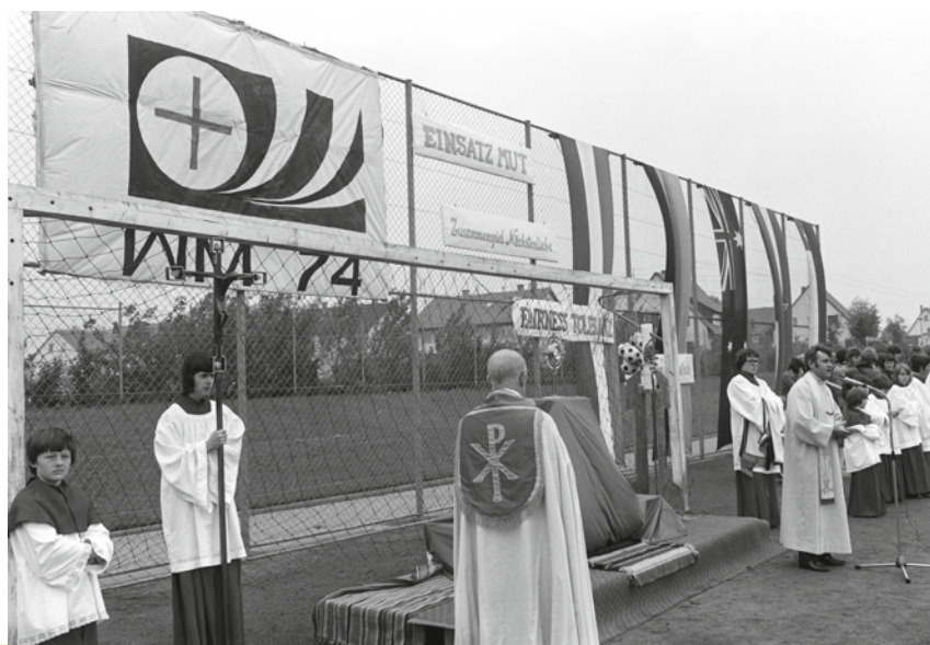
Der Fronleichnamsgottesdienst in Renningen (Landkreis Böblingen) stand im Zeichen der kommenden Vorrundenspiele, 13. Juni 1974. Während der WM wurde die bis heute bestehende „Arbeitsgemeinschaft Christlicher Kirchen Stuttgart“ gegründet, die für die Turnier-Besucher Gottesdienste anbot