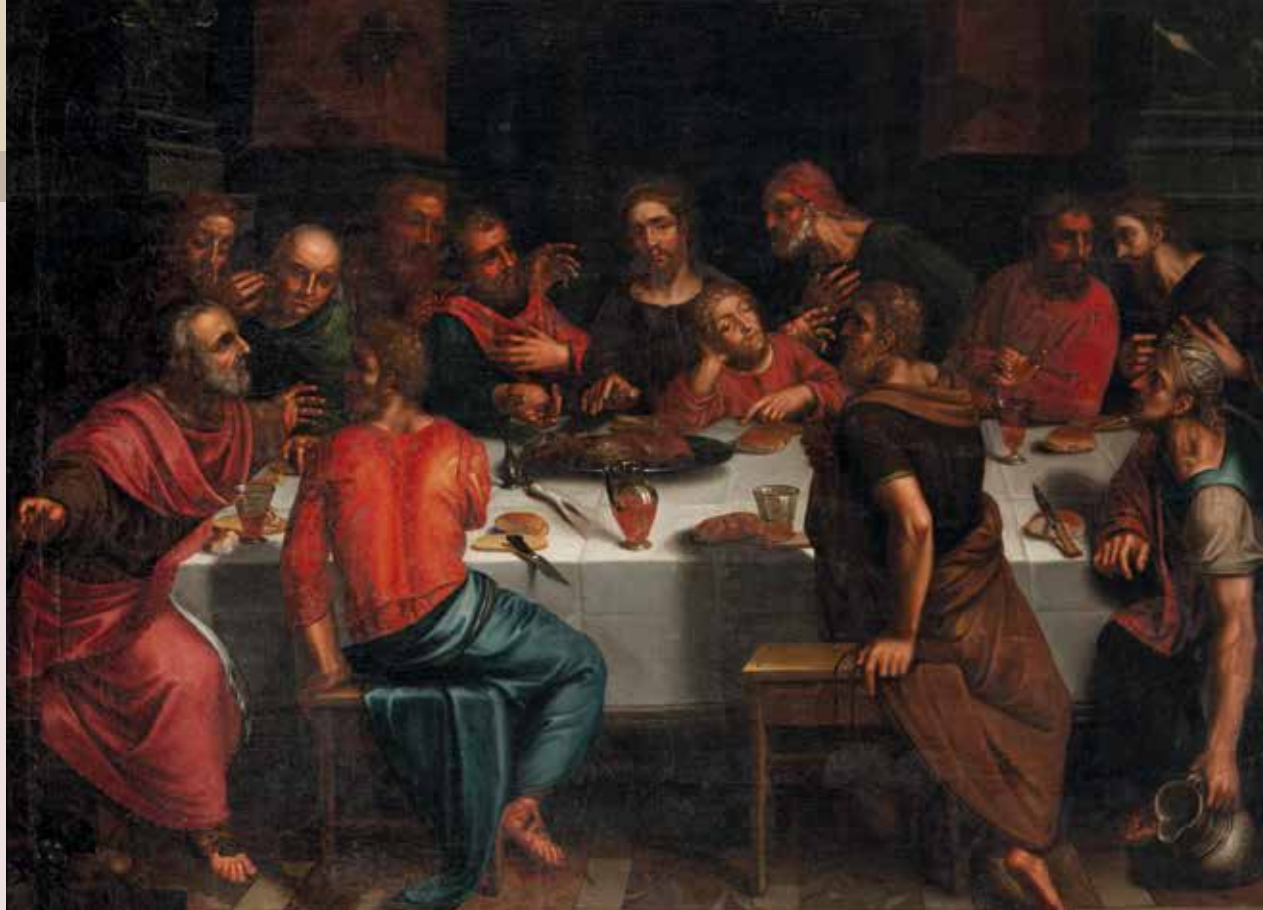
Letztes Abendmahl, Nicolas Guibal (1725–1784), Stuttgart, 1781 (Landesmuseum Württemberg)