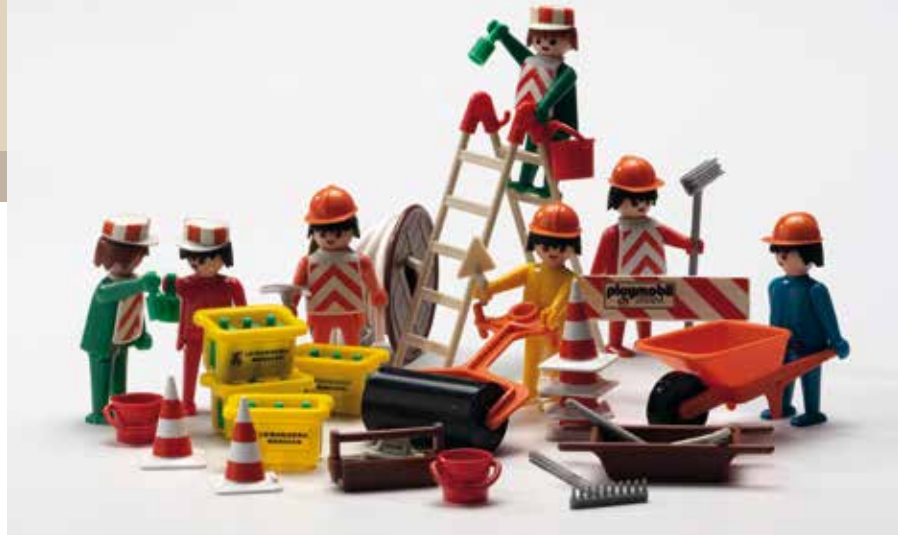
Spielzeugset „Playmobil Klickey – 3400 Bauarbeiter Baustelle“ der Firma Geobra, 1974 (Landesmuseum Württemberg, Foto: Hendrik Zwietasch, Bildarchiv 413211)

Fakt ist: Alkohol löst etwas in uns aus. Verantwortlich dafür sind chemische Reaktionen in unserem Gehirn: Wenn wir ihn trinken, sind wir entspannter, fröhlicher und kontaktfreudiger. Gleichzeitig ist uns bewusst, dass die Grenze zu den weniger erfreulichen Folgen wie Enthemmung, Übelkeit oder Kontrollverlust fließend ist und die negativen Effekte nicht lange auf sich warten lassen. Womit wir wieder bei der Frage wären: Warum trinken wir überhaupt Alkohol?