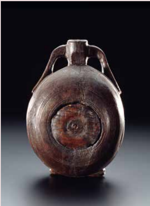
Abb. v.o.n.u.: Henkelkrug, Bad Schussenried, „Riedsachen“, um 3.900 v. Chr., und drei jungneolithische Becher, um 4.300 v. Chr. (Landesmuseum Württemberg, Foto: Hendrik Zwietasch, Bildarchiv 413378) | Hölzerne Feldflasche, Oberflacht, Kreis Tuttlingen, Grab 233, 7. Jh. n. Chr. (Landesmuseum Württemberg, Foto: Hendrik Zwietasch, Bildarchiv 109101) | Römisches Weinsieb und Kelle, Aichholzhof, Markgröningen, 3. Jh. n. Chr. (Landesmuseum Württemberg, Foto: Hendrik Zwietasch, Bildarchiv 412266)