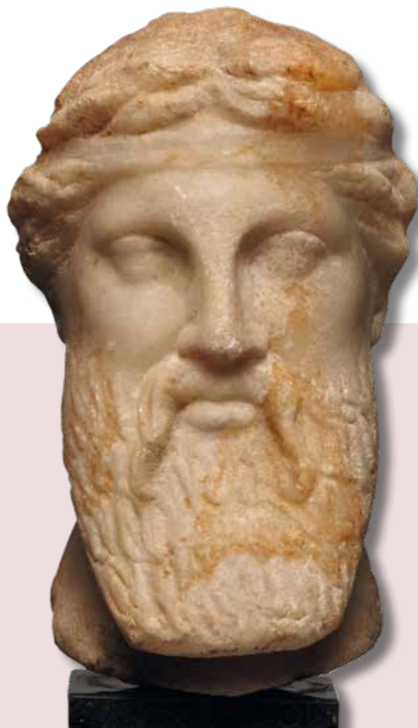
Kopf des Dionysos, Nildelta / Ägypten, 1. Jh. v. Chr. (Landesmuseum Württemberg, Foto: Hendrik Zwietasch, Bildarchiv 108472)

Im Christentum hingegen wird das Trinken von Alkohol in der Bibel differenziert bewertet: Während übermäßiger Konsum als Sünde gilt, ist das maßvolle Trinken von Alkohol, vor allem in Gemeinschaft, weitgehend positiv belegt. Zudem hat Wein im Gottesdienst als Symbol des Blutes Christi sakrale Bedeutung. Während der Feier der Eucharistie (Danksagung) bzw. des Abendmahls im Gottesdienst erinnert der Wein zusammen mit Brot oder Hostien, die den Leib Christi repräsentieren, an die Erlösung der Menschheit durch Jesu Opfertod.