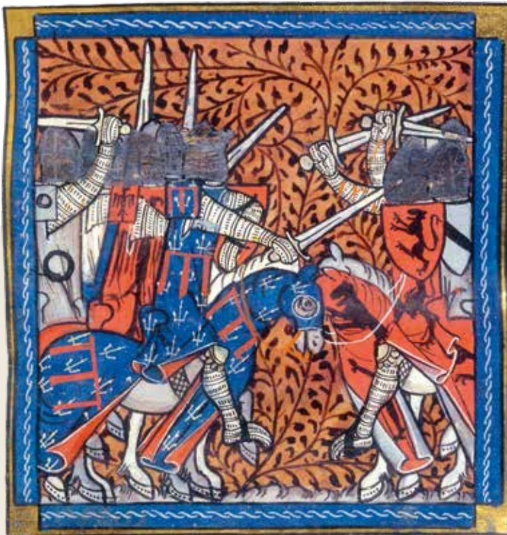
Konradin und Karl von Anjou in der Schlacht von Tagliacozzo 1268. Französische Buchmalerei, aus: Grandes Chroniques de France , um 1335/40, British Library London. | Konradin siegelt als König von Jerusalem und Sizilien, Herzog von Schwaben, an einer Urkunde für das Kloster Weißenau von 1262 August 15. Das Siegel zeigt den König auf einem Thron sitzend, in der Rechten ein Lilienszepter, in der Linken eine Kugel mit Kreuz.

Über Verona, Pavia und Pisa erreichte der junge Staufer Rom, wo ihn sein Verwandter, Senator Heinrich von Kastilien, ein Enkel König Philipps von Schwaben, im Juli 1268 feierlich empfing. Heinrich und Konradin einte die Gegnerschaft zum Papst und zu Karl von Anjou. Am 18. August verließ Konradin Rom in Richtung Süditalien mit einem Heer von über viereinhalbtausend Mann, bestehend aus deutschen und italienischen Rittern. Auf der Palentinischen Ebene östlich von Tagliacozzo kam es am 23. August zur Entscheidungsschlacht. Die zahlenmäßige Unterlegenheit des französischen Heeres wurde mit einer raffinierten Kriegstechnik ausgeglichen. Zunächst schlugen die Soldaten des Staufers das Heer Karls von Anjou in die Flucht – zumindest