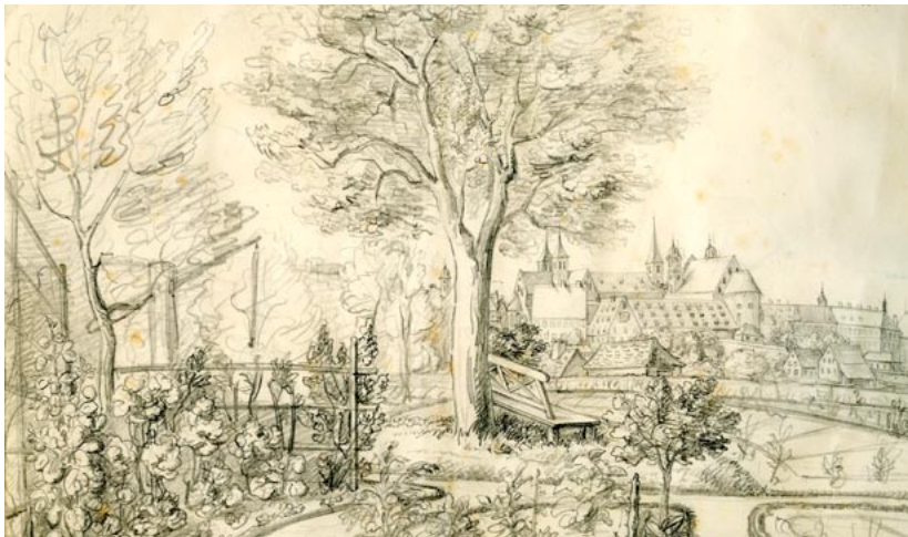
Ellwangen. Zeichnung von Karl Scheurlen, 1852

Während des Ersten Weltkrieges befasste sich Ernst von Scheurlen mit Fragen der Wasserversorgung, der Desinfektion und der Seuchenbekämpfung. In Stuttgart setzte er sich für den Bau einer zentralen Kläranlage ein. Nach 1918 galt sein Augenmerk dem Bau der Landeswasserversorgung.