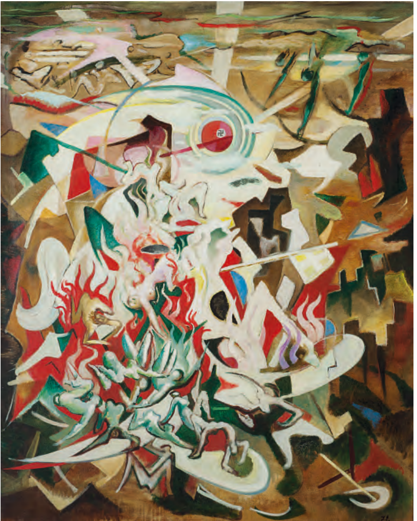
Eine Kugel mit Hakenkreuz setzt einen Höllensturz in Gang: «Sieg der Gerechtigkeit, Untergang des Unsterns Hitler und Zerstörung Stuttgarts» titulierte Oskar Zügel sein «Schicksalsbild», das er 1934 in Stuttgart begann und 1936 in Spanien fertigstellte.