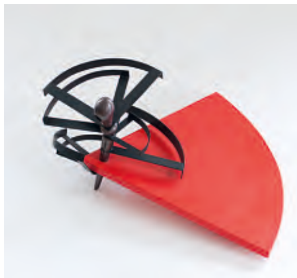
Gerlinde Becks «Monument für Dore Hoyer» zeichnet poetisch die Bewegungen der Ausdruckstänzerin nach. Nachlassverwalter Kuno Schlichtenmaier hat einen Film produziert, der die Verbindung der Bildhauerin zu Musik und Tanz thematisiert.

Leben, um sein umfangreiches Werk im Bewusstsein der Öffentlichkeit zu erhalten. Neben rund 1200 Skulpturen gehören dazu hunderte von Gemälden, Aquarellen und Zeichnungen sowie weit über 1000 Gipsmodelle, die in einer großen Lagerhalle magaziniert sind. Loth hat angegeben, wie viele Güsse jeweils angefertigt werden dürfen. Soweit diese Zahl zu Lebzeiten nicht erreicht wurde, sieht sich die von dem Galeristen Kuno Schlichtenmaier beratene Stif-