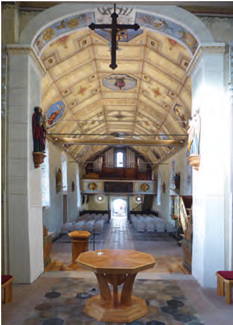
Martinskirche, Blick zum Chor. Bei der Martinskirche handelt es sich um eine der ältesten Kirchen von Mengen. Sie erhielt in der Spätgotik ihre eigentliche Gestalt.

Dieser betet voll Inbrunst zu Maria. Im Fresko scheint er von gleicher Größe zu sein wie sein Gegenüber. Tatsächlich war er im wahren Leben auffallend klein und schwächlich. Er war jedoch hochgebildet und galt als diplomatisch erfahren. Sein Auftreten wurde allgemein als sicher und gewinnend bezeichnet. Bereits fünf Tage nach seiner Wahl brachte er das Entsetzen und die Trauer zum Ausdruck, die das grauenhafte Kriegsgeschehen in ihm auslöste. Er äußerte zudem seine feste Entschlossenheit, dass er unter Einsatz aller ihm verfügbaren Mittel das Ende des Blutvergießens und der Verwüstungen beschleunigen wolle. Bei seinem Amtsantritt stellte er sogar ein Friedensprogramm vor, da er den Weltkrieg als Selbstmord der europäischen Nationen verstand. Bei jeder sich bietenden Gelegenheit rief er zum Frieden und zum gerechten Ausgleich der politischen Interessen auf. Zu Beginn des Jahres 1915 versuchte er sogar zwischen Österreich-Ungarn und Italien zu vermitteln, zusätzlich war er Initiator eines weltweiten Friedensgebets. 16