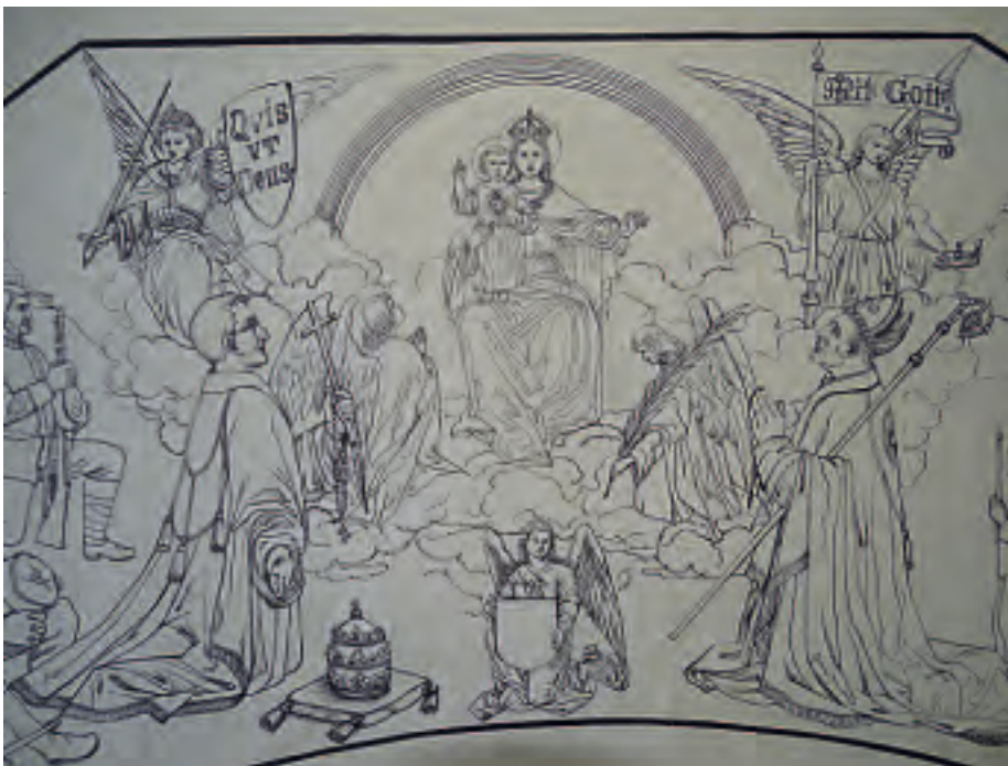
Der erhaltene großformatige Entwurf für das Chorbogenfresko der Martinskirche, ein sogenannter Bozzetto, wurde dem Auftraggeber für die Auftragsvergabe vorgelegt. Dieser zeigt nur geringfügige Veränderungen gegenüber dem ausgeführten Fresko. Einzig Kaiser Wilhelm II. ist näher an den Thron Marias gerückt.