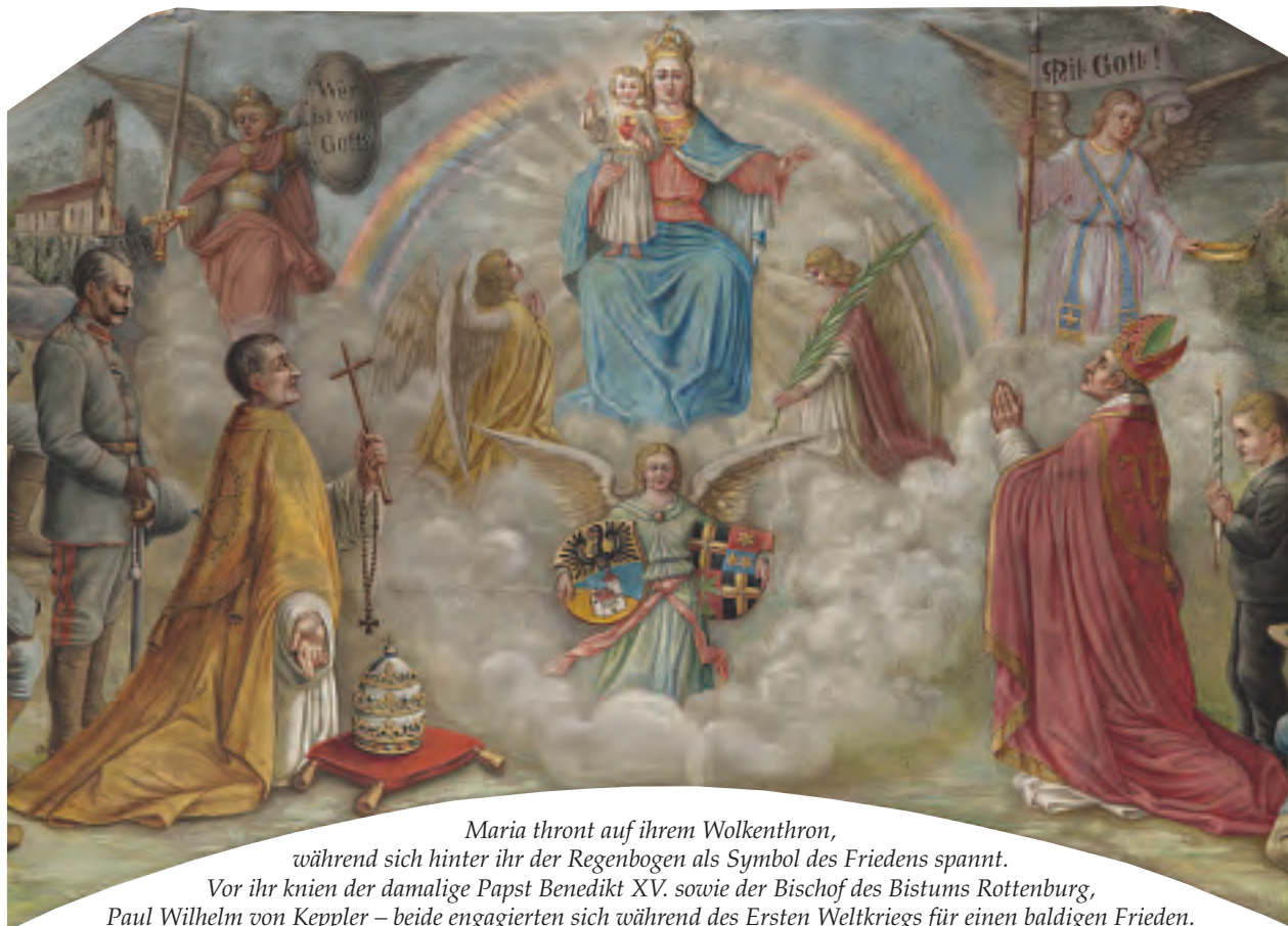
Maria thront auf ihrem Wolkenthron, während sich hinter ihr der Regenbogen als Symbol des Friedens spannt. Vor ihr knien der damalige Papst Benedikt XV. sowie der Bischof des Bistums Rottenburg, Paul Wilhelm von Keppler – beide engagierten sich während des Ersten Weltkriegs für einen baldigen Frieden.