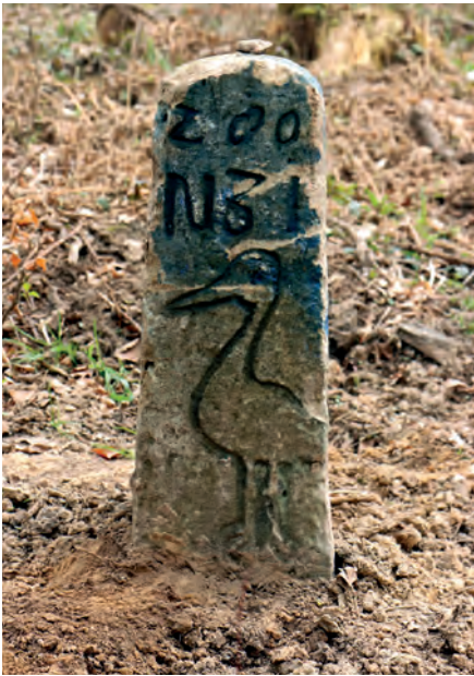
Mal mehr, mal weniger kunstvoll – die meisten Grenzsteine zeigen einen Storch, den Wappenvogel von Großbottwar.

erfassen, überwachsene wieder freistellen, reinigen und je nach Zustand vorsichtig restaurieren und parallel zur historischen Grenzbeschreibung katalogisieren. Die Arbeit lieferte durchaus interessante Ergebnisse: Nahezu alle im Wald gelegenen Grenzsteine sind heute noch vorhanden, während die Steine im Offenland zu einem Großteil nicht mehr auffindbar sind. Die Eigenarten und »Handschriften« verschiedener Steinmetze ließen sich zuordnen und viele Details der Beschriftung interpretieren. Es entstand eine umfangreiche und eindrucksvolle Dokumentation, zu der in diesem Frühjahr sowohl eine Ausstellung im Großbottwarer Rathaus wie auch mehrere gut besuchte Grenzsteinwanderungen stattgefunden haben.