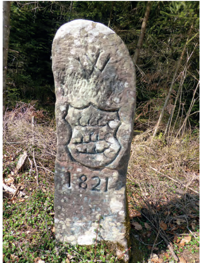
Auf der württembergischen Seite der Steine findet sich das Hirschstangenwappen.