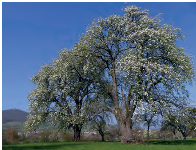
Zu den prächtigsten Baumgestalten im Vereinsgebiet zählt ein schöner Bestand mächtiger alter Wasserbirnen.

tenmuttergarten«, der auch Edelreiser seltener oder in Baumschulen nicht mehr erhältlicher Sorten für die Veredelung von Neupflanzungen liefert. Ein Hauptanliegen der Vereinsmitglieder ist der Erhalt der Wiesen für die Zukunft. So pflanzen sie sorgfältig ausgewählte Obstarten, die nach heutiger Einschätzung dem Klimawandel besser gewachsen sein könnten. Dazu gehören etwa für sommerliche Trockenperioden geeignete Esskastanien oder Maul-