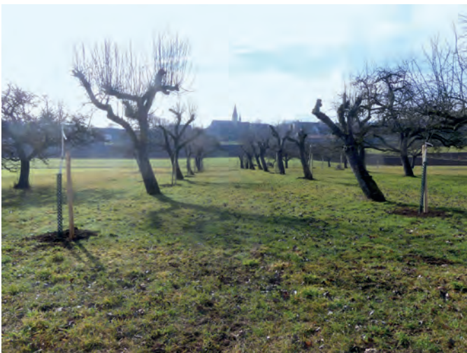
Mit Neupflanzungen werden Lücken im historischen Streuobstgürtel ergänzt.

gelt und damit Lebensraum für viele geschützte und selten gewordene Arten wurde. Doch gerade solche Kulturlandschaften mit kleinen Einzelflächen haben es in der modernen Land- und Forstwirtschaft schwer. Einst übliche Bewirtschaftungsformen sind zum Teil verschwunden, viele Flächen zu klein, um sie mit Maschinen wirtschaftlich nutzen zu können. Doch wenn sie aufgegeben werden und brachfallen, verliert die Landschaft nicht nur ihr Gesicht, ihren landschaftlichen Reiz, sondern auch die Vielfalt der Arten schwindet – oft unwiderruflich. Diesen Verlust nicht hinzunehmen, sondern aktiv dagegen anzugehen, hat sich seit 1995 die Umweltgruppe Kirchheim e.V. zum Ziel gesetzt. Der größte landschaftliche Schatz der Hügelland-