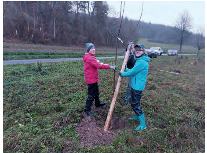
Das Pflanzen von Obstbäumen ausgewählter alter Sorten war eine der ersten Maßnahmen.

zu gestalten und wieder in die Kulturlandschaft einzufügen. Das ausgedehnte Stück, das sich über fast einen halben Kilometer neben der Bundesstraße 19 entlang des Harthäuser Talbaches hinzieht, war dabei, langsam zuzuwachsen. Die Eigentümer, Straßenbauverwaltung und Gemeinde, die diese Bachaue während des Straßenbauverfahrens vor Jahren als Überschwemmungs- und Ausgleichsfläche erworben hatten, waren gerne bereit, den