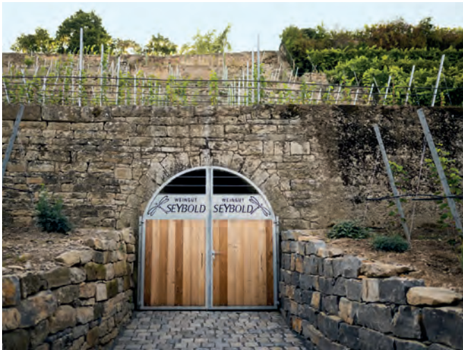
Mit dem restaurierten Eingangsbereich und einem Holztor ist der Keller heute ein Aushängeschild für das Weingut Seybold.