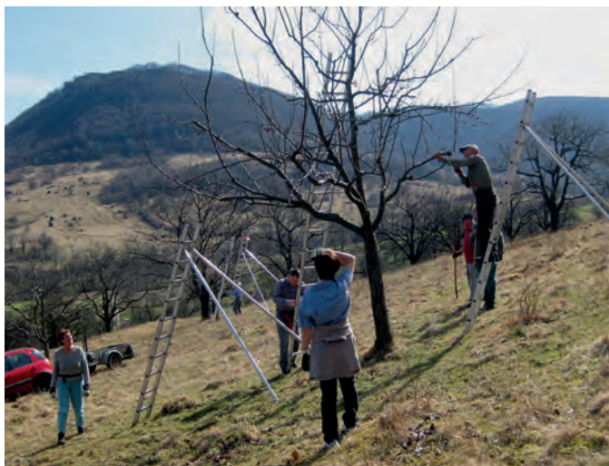
Ihre guten Kenntnisse im Baumschnitt geben die Fachwarte des Vereins in Schnittkursen gerne weiter.