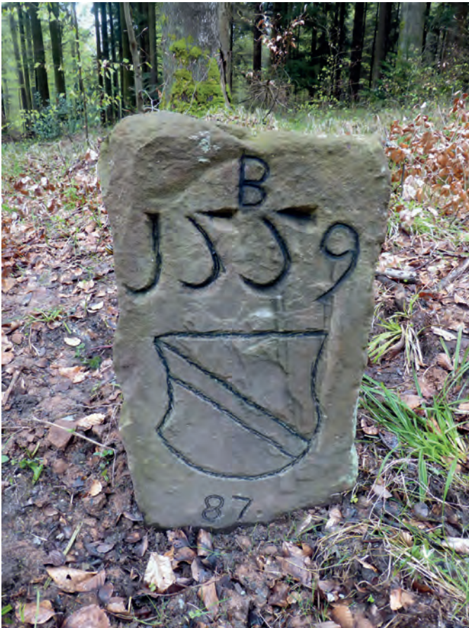
Die badische Seite der Steine zeigt das badische Wappen mit dem Schrägbalken.