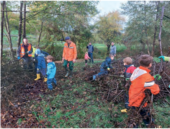
Ist eine Benjeshecke erst einmal aufgeschichtet, lässt sich ihre Entwicklung über Jahre beobachten.