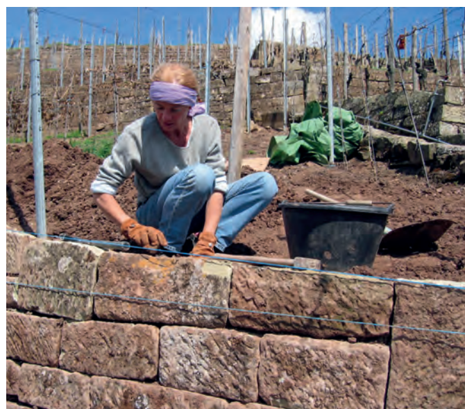
Die exakte Bearbeitung und Einpassung der Steine sind eine entscheidende Grundlage für eine möglichst lange Stabilität der Mauer.

allen wichtigen »Stakeholdern« sowie einer professionellen Öffentlichkeitsarbeit hat die Allmende Stetten ihr Trockenmauerprojekt und das Thema Kulturgut Steillage in eine breite Öffentlichkeit getragen. Davon zeugen ein Dokumentarfilm, ein Fotoband zum Museumsweinberg, Führungen, Broschüren und nicht zuletzt die Tatsache, dass sich der Rems-Murr-Kreis aus Anlass seines 50. Geburtstags in diesem Jahr mit einem eigenen Trockenmauer-Sanierungsprojekt des Themas angenommen hat.