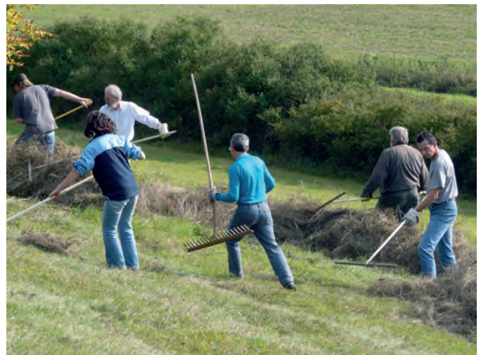
Wo eine Beweidung nicht möglich ist, muss regelmäßig gemäht und das Heu hangabwärts abgeräumt werden.