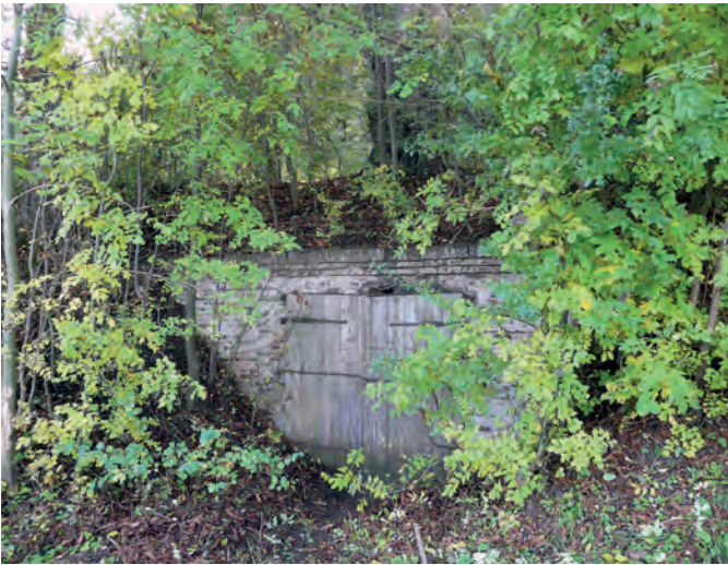
Der ehemalige Eiskeller hinter der unscheinbaren Tür ist heute ein wichtiges Fledermausquartier.

schaft am Riesrand sind die verstreut gelegenen Wacholderheiden und Magerrasen. Sie sind durch Hüteschafhaltung entstanden und benötigen diese auch weiterhin. Mit beeindruckendem Sachverstand arbeiten die Aktiven der Umweltgruppe schon über 27 Jahre an dem Ziel, in Kooperation mit Schafhaltern für möglichst alle Flächen eine Schafbeweidung wiederherzustellen. Wo eine Beweidung nicht oder noch nicht gesichert ist, engagiert sich die Grup-