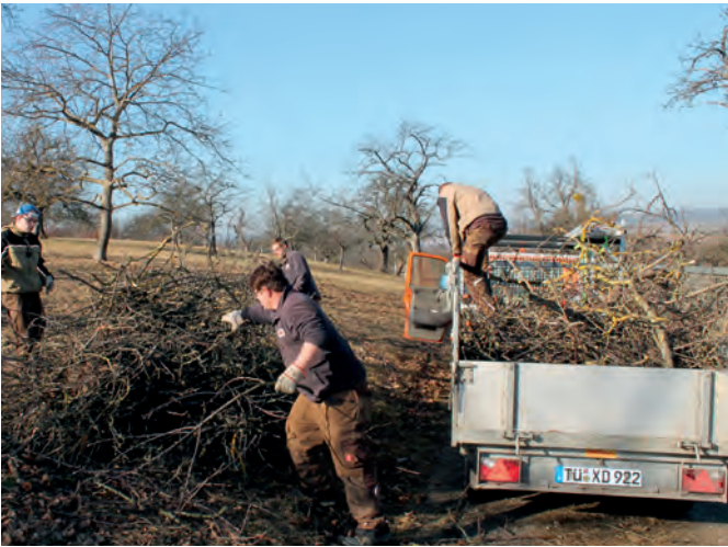
Die gesicherte jährliche Abfuhr und Verwertung des Baumschnitts durch die AiS ist für die meisten Gültesbewirtschafter eine große Arbeitserleichterung.