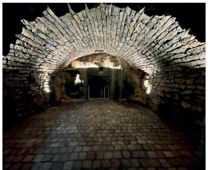
Nach einem halben Jahr Arbeit mit Ausräumen und notwendigen Reparaturen an Gewölbe und Mauern präsentiert sich der Keller mit einem ebenen Boden aus historischem Granitpflaster und LED-Beleuchtung.