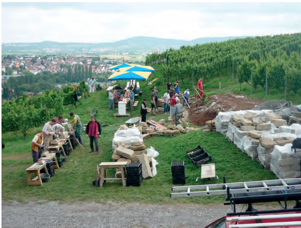
Die inzwischen über 80 erfolgreichen Teilnehmerinnen und Teilnehmer der Trockenmauer-Seminare tragen die gelernte Mauertechnik wieder hinaus in die ganze Region.