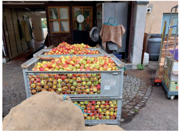
In der AiS-eigenen Dorfmosterei Bodelshausen wurden im Herbst 2022 über fünfzig Tonnen Obst gepresst und weiterverarbeitet.