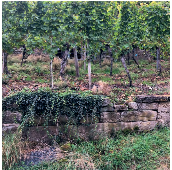
Vor Beginn der Restaurierungsarbeiten war vom ehemaligen Eiskeller im Weinberg nahezu nichts mehr zu sehen.