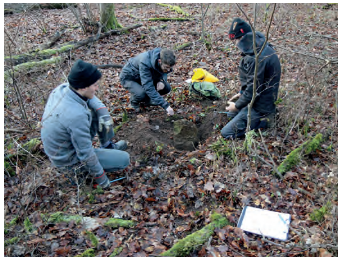
Mit Hilfe der guten historischen Karte ließen sich auch Grenzsteine wiederfinden, die schon lange vom Waldboden bedeckt waren.