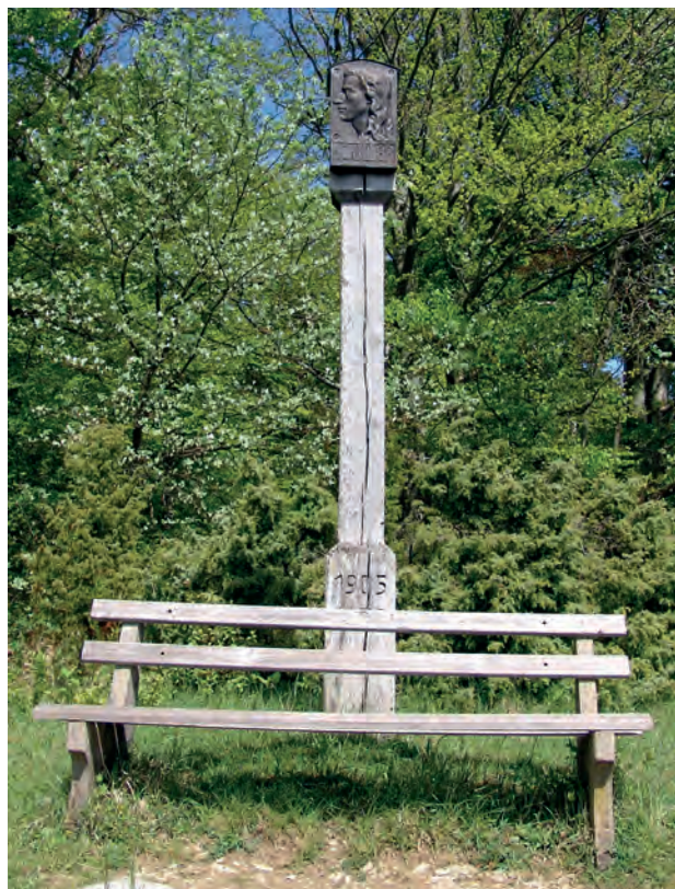
Das 1905 errichtete Schillerdenkmal in Jungingen