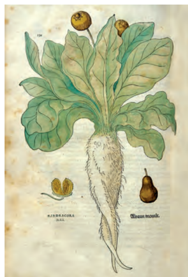
»Herbarium«, Aquarell von Nathalie Wolff (oben).

Beide besitzen eine Affinität zu Flora und Fauna und geheimnisvollen Geschichten darum herum. So hat es ihnen die Alraune angetan, und die acht aus Samen gezogenen Pflanzen werden in der Heslacher Wohnung gehegt und gepflegt, was wegen der Klimaempfindlichkeit mühsam ist, und nun blüht eine erstmals nach mehreren Jahren. Die in männlicher und weiblicher Form vorkommende Alraune ( Mandragora officinarum , beziehungsweise autumnalis ), deren Wurzel an die menschliche Gestalt