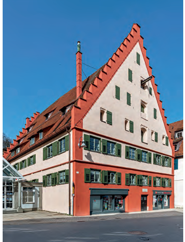
Der stattliche Bau des ehemaligen Salzstadels mit seinem hohen Treppengiebel ist ein aussagekräftiges Zeugnis der Reichsstadtvergangenheit von Biberach geblieben.