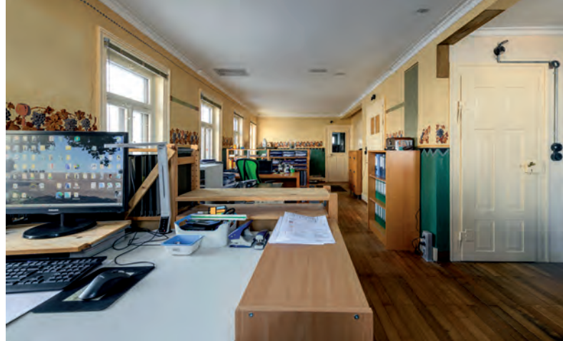
Links: Auch nach der Sanierung erhalten geblieben: der Krämerladen mit einer ursprünglichen Einrichtung. Rechts: Modernes Arbeiten in alter Gaststube: das Architekturbüro der Bauherrin

schaft »Zur Molkerei« ein, in der wohl vor allem die Männer des Ortes am Feierabend zum geselligen Trinken saßen. Man betrat die Kneipe entweder durch den Laden oder über das Treppenhaus, das von der Molkerei eine Etage tiefer heraufführte, die ihrerseits über zwei Außentüren im Sockel zugänglich war. Die große Wirtstube, die hinter dem Laden die gesamte Längsseite und auch die ganze untere Giebelseite einnahm und deren Decke wegen der großen Spannweite von einer gusseisernen Stütze getragen wird, war über einem gestrichenen Sockel an Wand und Decke mit reichen Dekorationsmalereien geschmückt. Im Lauf der Jahrzehnte waren sie mehrfach im jeweiligen Zeitgeschmack verändert und schließlich ganz übertüncht worden. Im voll ausgebauten Dachgeschoss befand sich schließlich eine Wohnung, wobei die Zimmer, mit Ausnahme des einen im Zwerchhaus, von den Dachschrägen bestimmt waren. Mit der Aufgabe von Molkerei und Wirtschaft in den 1940er-Jahren sowie dem Laden in den 60ern wurde es still um das Haus, das zunächst noch bis 1999 einfachen Wohnzwecken und einer Flaschnerwerkstatt diente, aber dann verwarlosend leer stand und auf seinen Abbruch wartete.