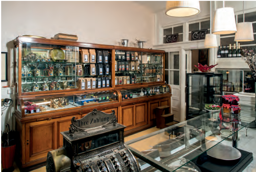
Eintauchen in eine vergangene Welt: der Verkaufsraum mit seinem Vitrinenschrank und der Ladentheke

früh den Namen »Süßes Löchle« erhielt, darüber kann man nur spekulieren. Offenbar hat der Volksmund dabei kräftig mitgeholfen. Sicher ist nur, dass der Ausdruck erstmals auf einer Bildpostkarte von 1902 auftaucht.