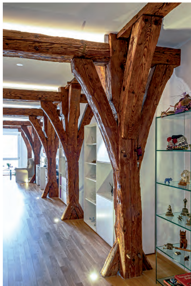
Die Stützenreihe der Tragkonstruktion des Daches blieb auch beim Ausbau des ersten Dachgeschosses zu Wohnungen sichtbar.

wertvolle Bau ist zwar stärker genutzt als zuvor, hat jedoch im Unterschied zu vielen Gewerbeimmobilien in Innenstadtlagen nur wenig von seinem historischen Aussagewert verloren. Dies ist nicht zuletzt der Schonung der vorhandenen Originalsubstanz zu verdanken und deren geschickter Einbeziehung in die neue Nutzung. So sind beispielsweise in der heute von einer großen Buchhandlung genutzten Ladenzone im Erd- und ersten Obergeschoss die Bauphasen der Erbauungszeit um 1510 und der Umbauzeit nach 1808 ablesbar geworden. Besonders zu begrüßen ist, dass der ursprüngliche Hallencharakter des Salzlagers partiell wieder nachvollziehbar ist. Bei der Aufteilung der Wohnungen im ersten Dachstock blieb die für die ursprüngliche Funktion signifikante Ständerreihe der Holzkonstruktion voll sichtbar. Bei der Erfüllung von bauphysikalischen und feuerpolizeilichen Auflagen oder bei der Belichtung der neuen Wohnungen mittels Gauben und Sonderkonstruktionen von Dachflächenfenstern, bei denen die historischen Sparren nicht angetastet wurden, erwies sich die Architektin in technischer wie gestalterischer Hinsicht als besonders einfalls-