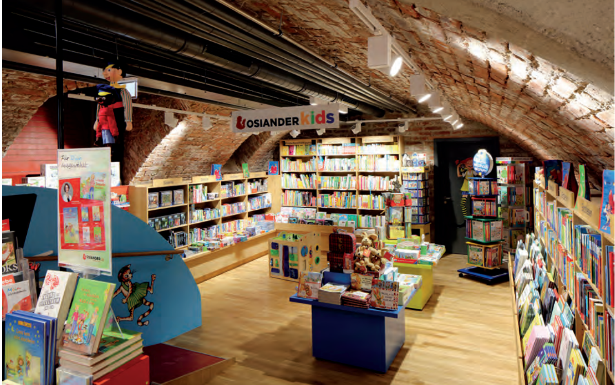
Zeugt von der ursprünglichen Funktion des Gebäudes: Der erhalten gebliebene Rest des großen Weinkellers wurde in die Ladenutzung integriert.

Geschosse reichende Halle für die Lagerung von Salzfassern. Im linken, etwas schmälere Schiff erstreckte sich dagegen über die gesamte Gebäudetiefe vom Marktplatz bis zur Rückfront im Erdgeschoss ein großer gewölbter Keller, in dem die Weinvorräte des Heiliggeistspitals gelagert wurden. Darüber befanden sich im Obergeschoss einige Stuben für die Verwaltung, von denen die vordere, zum Marktplatz gelegene als repräsentativer Raum zum Abschluss der Salzgeschäfte diente und sich durch eine schicke Bohlenbalkendecke auszeichnete, die erst jetzt im Zuge der Bauarbeiten wiederentdeckt wurde. Das obere Vollgeschoss diente als Wohnung für den Salzmeister, während die vier großflächigen Dachebenen als Kornspeicher für das Spital genutzt wurden. Dass der Bau große Lasten tragen musste,