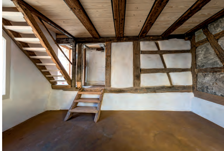
Links: Die Stube mit ihrem ultramarinblauen Anstrich nach der Restaurierung. Das Fensterband wurde nach Befund rekonstruiert. Rechts: Der ehemalige Werkstatttraum im Erdgeschoss mit gesicherten Oberflächen. Die Treppe aus dem 19. Jahrhundert wurde nicht entfernt, sondern kann bei Bedarf wieder die Verbindung ins Obergeschoss herstellen.