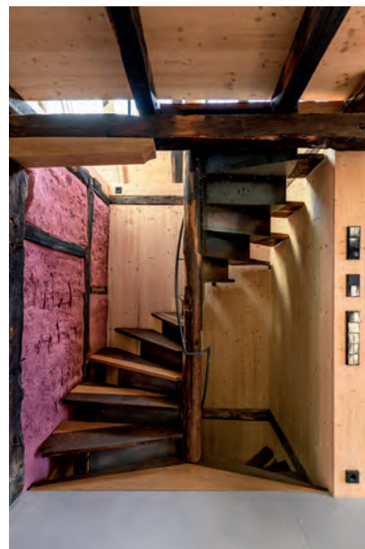
Links: Entmutigende Entdeckungen der großen Bauschäden bei Baubeginn: die völlig verrottete Außenwand zum Nachbarn. Mitte: Zeugen von handwerklicher Qualität: Die Ergänzungen am historischen Fachwerk von 1460/65 aus Eichenholz mit seinen Holzverblattungen. Rechts: Die durch das ganze Haus führende frühneuzeitliche Spindeltreppe wurde aufwändig repariert und dient wieder der Erschließung der oberen Geschosse.

nen Wohnen zu nutzen. Auf jeden Fall wollte er es vor dem Abbruch bewahren, von dem damals mehrere historische Wohnbauten in der Stadt betroffen waren. Öffentlicher Unmut regte sich darüber in der Bürgerschaft, nicht zuletzt, weil die modernen Ersatzbauten, darunter auch solche in der unmittelbaren Nachbarschaft der Ochsen-gasse, sich wenig gegliückt in die historische Umgebung einfügen.