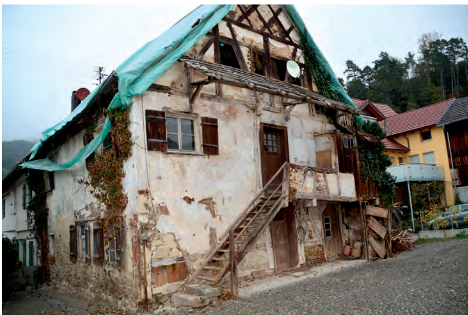
Erschreckend: der Zustand des einsturzfährdeten Hauses 2014 mit notgesichertem Dach.