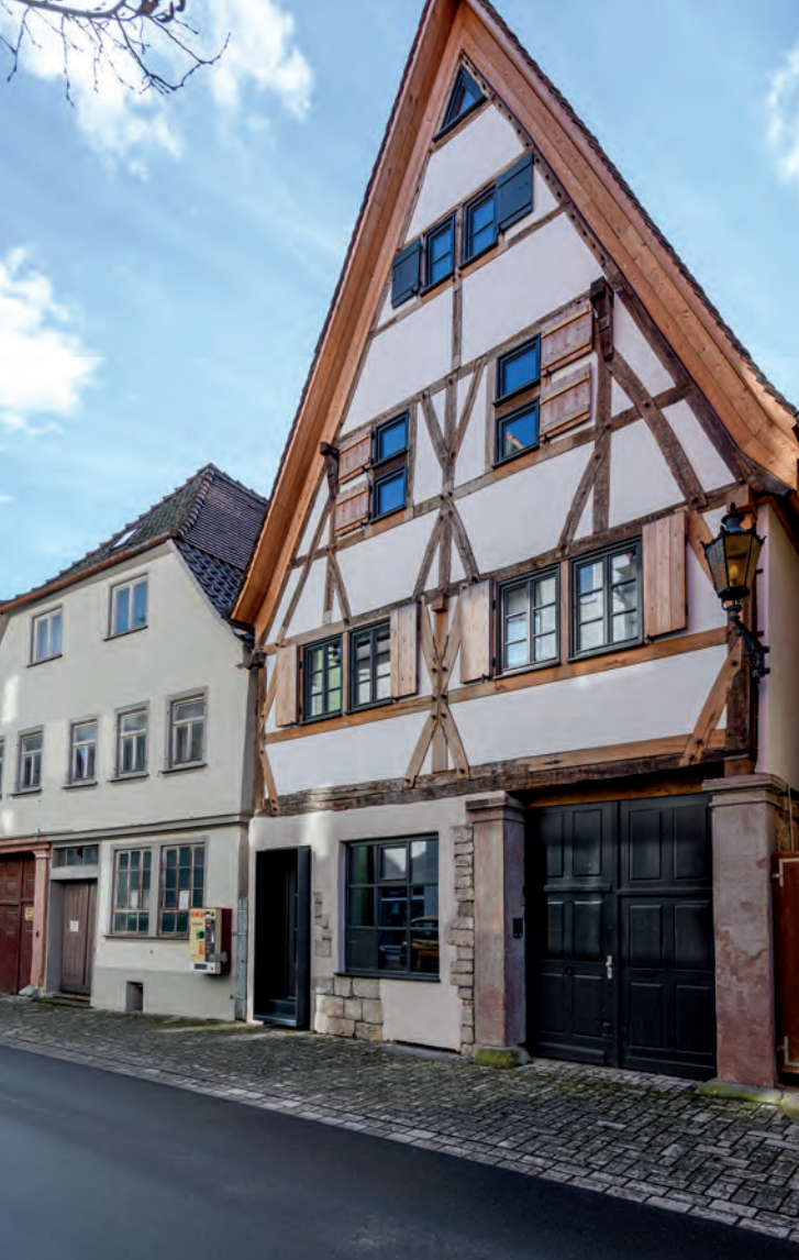
Nach der Sanierung: das bis ins Mittelalter zurückgehende Haus in der Bad Mergentheimer Altstadt zwischen historischen Nachbarn und wenig geglückten Neubauten.