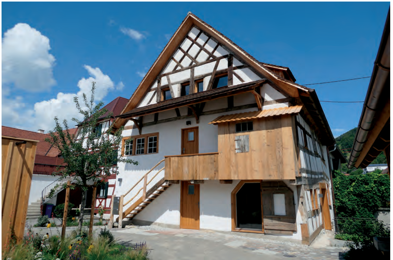
Das ehemalige Rebmannhaus in Sipplingen nach der vorbildlichen Sanierung