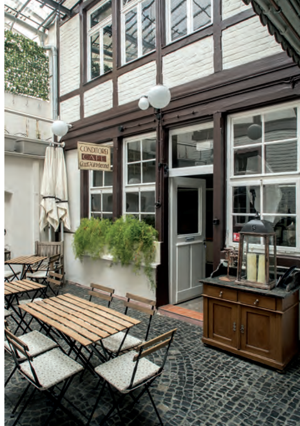
Mit Außenbewirtschaftung: der glasüberdeckte Innenhof mit Blick auf die alte Backstube im Rückgebäude

Nicht mehr zu übersehender Sanierungsstau sowie feuer- und gesundheitspolizeiliche Auflagen