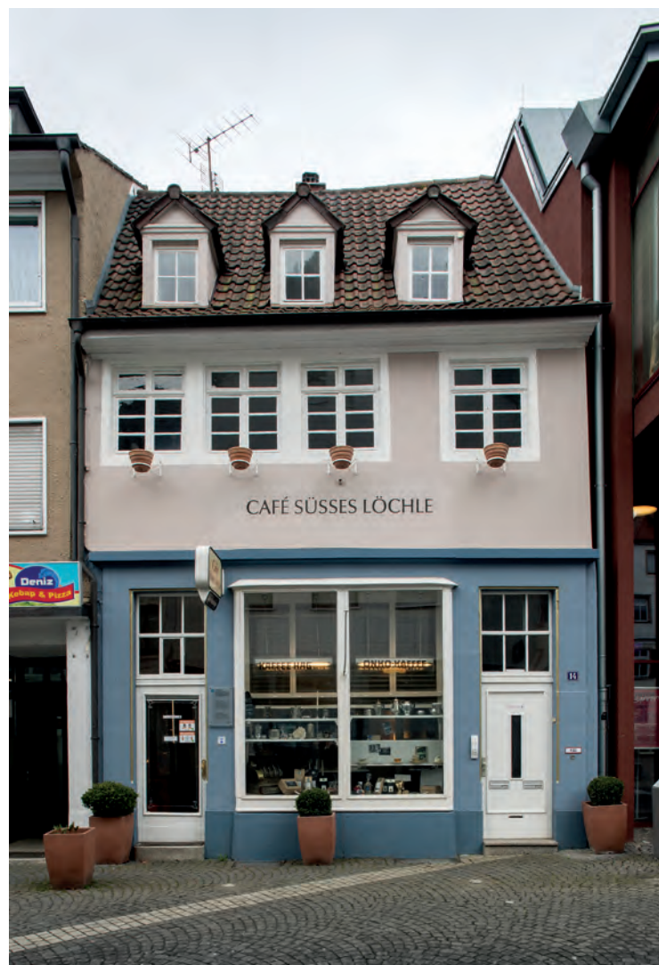
Eine Institution in der Lahrer Innenstadt: das Café »Süßes Löchle«, seit 1887 in einem Haus, das bis in das 18. Jahrhundert zurückreicht

Schon 1887 hatte hier der Konditormeister Eugen Hildebrand eine Feinbäckerei eröffnet, die er zwei Jahre später durch eine »Caféstube mit Wein- und Likörausschank« erweiterte, wie es in einer Anzeige in der Lokalzeitung hieß. Die Geschäfte müssen rasch gut gelaufen zu sein, denn 1891 konnte Hildebrand das bislang nur gemietete Anwesen kaufen. Fotos der Jahre um 1900 zeigen, dass das Erdgeschoss zur Straße mit dem Laden- und Hauseingang und den Schaufenstern sowie das Innere im opulenten Stil des späten Historismus für die Konditorei umgebaut worden waren. Der Sohn Karl führte die süße Institution von Lahr mit ebenso glücklicher Hand weiter. Warum das Café Hildebrand schon