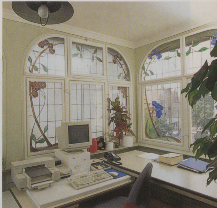
Veranda als Büro: Arbeiten mit modernster Ausstattung im Jugendstil-Grün und im natürlichen Grün.