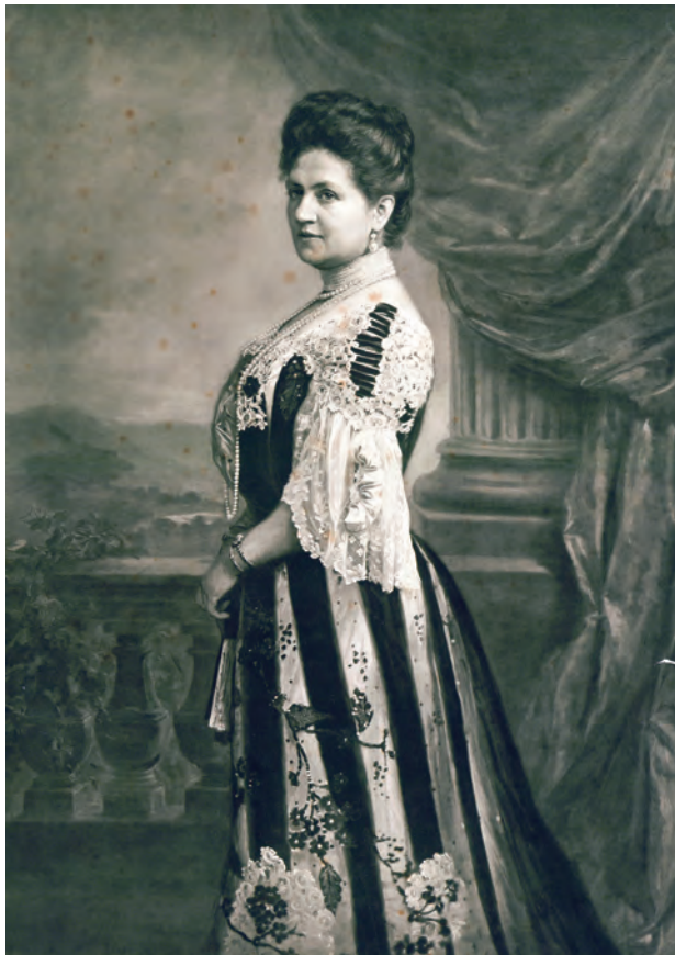
Der Kupferstich von 1896 zeigt Charlotte Königin von Württemberg (1864–1946) auf einer Terrasse stehend. Um den Hals trägt sie eine Perlenkette, in der Hand hält sie einen Fächer.

Der Verein stand Frauen über 18 Jahren offen, die «berufsmäßig» ein Kunsthandwerk ausübten. Nach Art einer Berufsgenossenschaft konnten die Mitglieder auf eine eigens gegründete Darlehens-