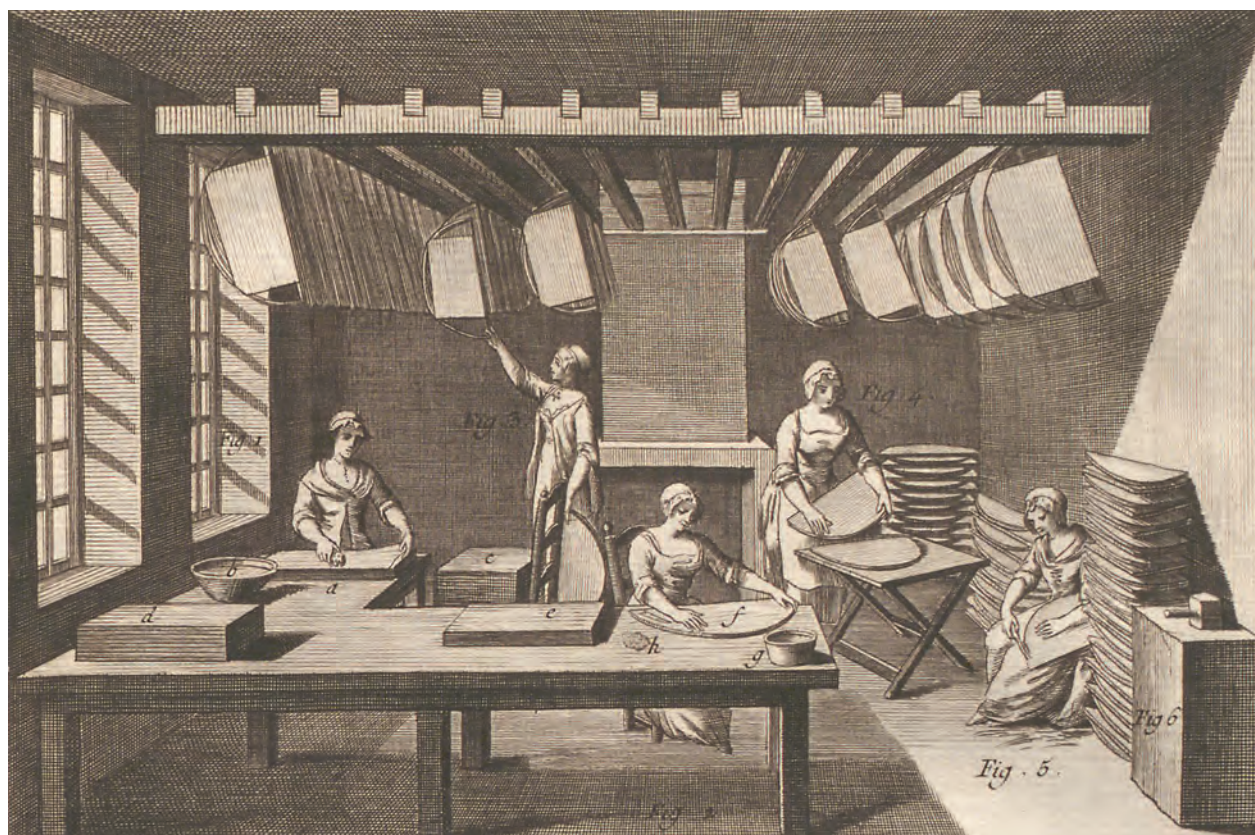
Ab 1751 veröffentlichten Jean d'Alembert (1717–1783) und Denis Diderot (1713–1784) ihre Encyclopédie , um das gesamte Wissen ihrer Zeit öffentlich zugänglich zu machen. Die beigegefügtten Kupferstiche lassen die Arbeitsschritte der «Éventailistes» (Fächermacher) nachvollziehen: Die «Colleuse» (Fig. 1) klebt das Papier, das von der «Leveuse» (Fig. 2) auf den Rahmen aufgezogen wird. Das Strecken und Trocknen der Fächerblätter übernimmt die Etendeuse (Fig. 3). Die «Coupeuse» (Fig. 4) schneidet die Blätter aus dem Rahmen, während die «Arrondisseuse» (Fig. 5) das Papier abrundet und schließlich glättet und klopft (Fig. 6).

Mit dem wirtschaftlichen Verfall Frankreichs vor und während der Revolution (1789–1799) ging es auch mit den französischen Fächermanufakturen bergab. Eine Wiederbelebung erfolgte aber bereits wenige Jahrzehnte später. Mit Kaiserin Eugénie von Frankreich (1826–1920), eine gebürtige Spanierin, die sich das 18. Jahrhundert zum Vorbild nahm und die heimische Modewaren- und Fächerindustrie