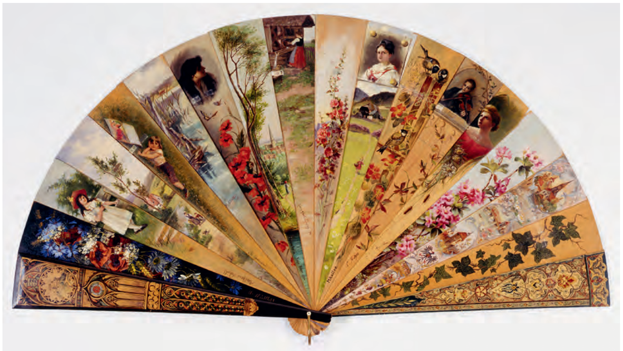
Tatsächlich bekam Königin Charlotte 1894 von den Mitgliedern des Württembergischen Malerinnenvereins zwei Briséfächer geschenkt. Insgesamt übermittelten durch dieses Gruppengeschenk 37 Malerinnen und Kunsthandwerkerinnen ihre Geburtstagsgrüße.