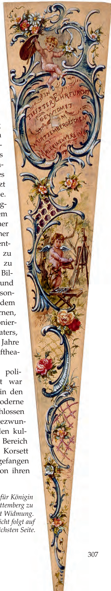
Detail des Fächers für Königin Charlotte von Württemberg zu ihrem 30. Geburtstag mit Widmung. Die Gesamtansicht folgt auf der nächsten Seite.

Obwohl Charlotte politisch sehr interessiert war und sich als Monarchin den Entwicklungen der Moderne gegenüber aufgeschlossen zeigte, blieb auch sie gezwungen, ihr Wirken auf den kulturellen und sozialen Bereich zu beschränken. Im Korsett der Konventionen gefangen übernahm sie allein von ihren