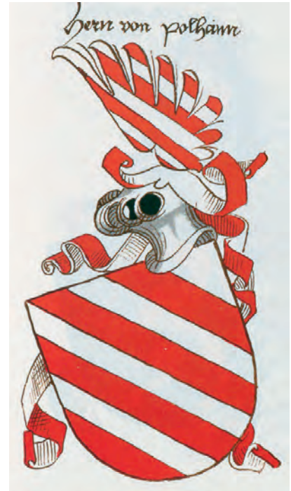
Links der Ursprung, das Wappen des Grafen Boppo grauffe zuo berg» und «Grauffe vo Echingen». Diese Wappenversion übernahm die Stadt Ehingen 1979 als Stadtwappen. In der Mitte das Wappen des «Grauff von Schälklingen», das sich nur in der Abfolge der Farben vom Wappen des Grafen Boppo unterscheidet; rechts das Wappen der «Herrn von Polhaim», die als Dienstmannen der Passauer Bischöfe aus dem Hause Berg ihr Wappen wohl vom Berger Wappen abgeleitet haben.