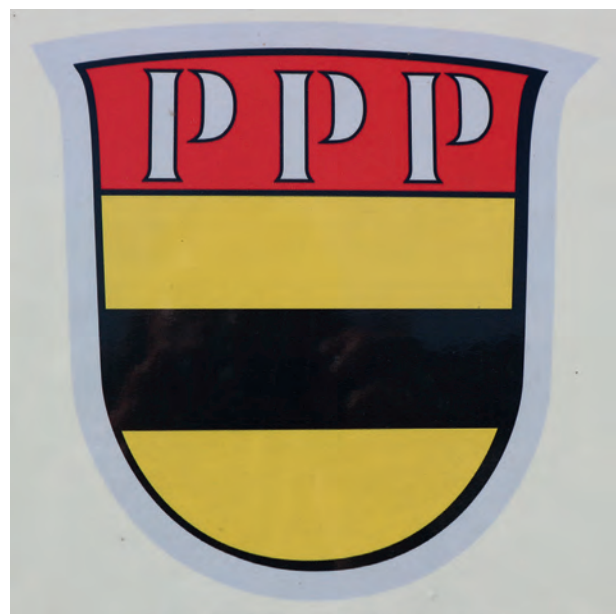
Wettenhausen ist heute ein Ortsteil der Gemeinde Kammeltal. Für das Gemeindegewappen wurde unter Hinzufügung dreier «P» das Wappen der Grafen von Roggenstein und des Reichstifts Wettenhausen übernommen, dessen Stifter sie vermutlich waren.

Die Gründung des Klosters Wettenhausen liegt im Dunkeln. Die Legende erzählt von einer Stiftung durch Gertrud von Roggenstein und ihre beiden Söhne Wernher und Konrad, wobei nicht erwiesen ist, ob daraus die Klostergründung hervorgegangen ist. 33 Eine Gräfin, Gertrud von Roggenstein, soll mit ihren Söhnen Conrad und Wernher im Jahre 982 ihre Güter in Ettlenschieß 34 und Weidenstetten 35 dem Kloster Wettenhausen geschenkt haben. 36 Erstmals urkundlich erwähnt ist das Kloster um 1130 durch den Bischof von Augsburg, Hermann von Vohburg. 37 Hermann von Vohburg war ein Vetter Diepolds III. 38 und stammte aus dem Geschlecht der Markgrafen von Cham (Rapotonen) 39 , was auf eine verwandtschaftliche Verbindung zu den Herren von Roggenstein hinweisen könnte. Die Verbindung zum nahen Kloster