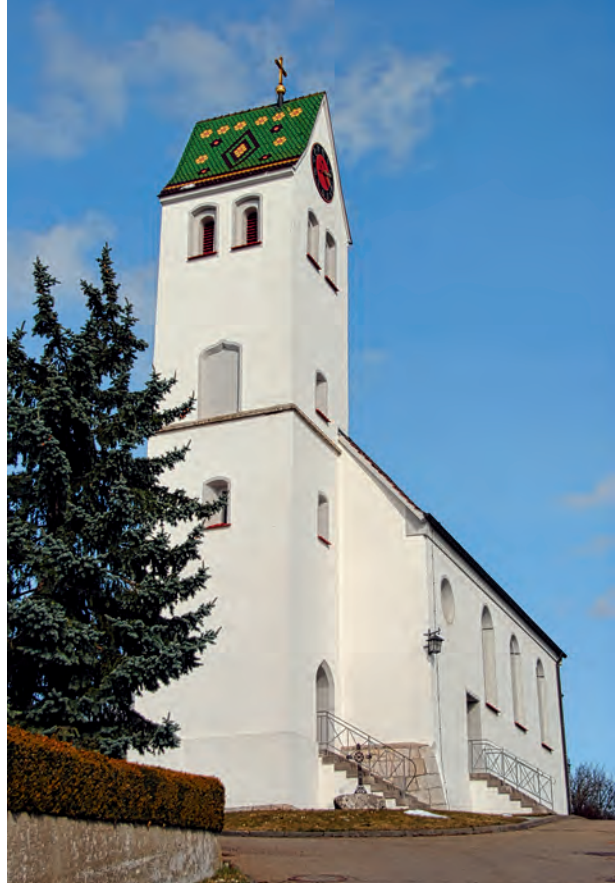
Die Kirche in Berg befindet sich an der Stelle der ehemaligen gräflichen Burg.

Hansmartin Decker-Hauff berichtet über Poppo: War Graf Poppo der Ahnherr von Frauenseite? Und wenn er es war, zu welchem Geschlecht gehörte er? Ein Graf von Lauffen? Der aus der Zwiefalter Chronik bekannte Stammvater der Grafen von Berg? 7 Immo Eberl schreibt: Graf Poppo wird im allgemeinen als Abkömmling des Hauses der Grafen von Lauffen ange-