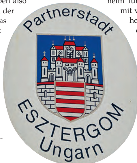
Wappen der Stadt Esztergom in Ungarn, der Partnerstadt von Ehingen: Es entspricht dem Wappen der Arpaden (ungarische Großfürsten und Könige von 895 bis um 1300).

Ein weiterer denkbarer Hinweis auf ein von den Arpaden abgeleitetes Wappen findet sich in Oberösterreich. Die ausgestorbene Familie von Polheim führte ein Wappen, silbern (weiß) mit vier roten Schrägbalken. Die Polheimer saßen bei Griefskirchen, das im Mittelalter zu Bayern und zum Bistum Passau gehörte. Sie waren freie Adelige im Umkreis der Bischöfe von Passau. 44 Die Verbindung zum