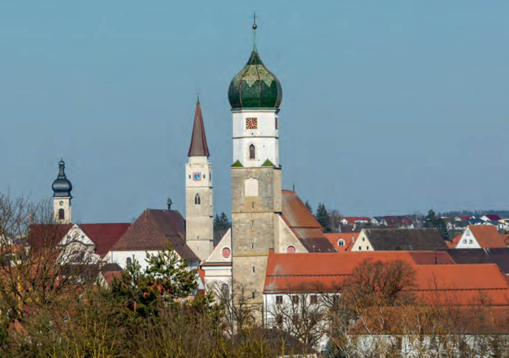
Die von den Grafen von Berg gegründete Stadt Ehingen von Westen aus gesehen. Das Stadtbild wird dominiert von drei Kirchen: der Liebfrauen-, der Stadtpfarr- und der Konviktskirche.

Ein weiterer, vorsichtig zu bewertender Hinweis auf die Herkunft Poppo aus dem Hause der Diepoldinger könnte die Tatsache sein, dass 1179 Markgraf Diepold III. eine Kirche in Ebnath, 15 zum Bistum Regensburg gehörend, nicht vom örtlich zuständigen Bischof von Regensburg,