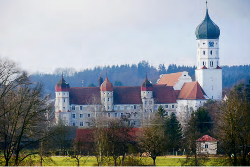
Kloster Wettenhausen, die vermutlich erste Grablege der Grafen von Berg.

gleichbare Beispiele. Um 1240 übernimmt Graf Ulrich I. von Württemberg nach seiner Eheschließung mit Anna von Veringen das Veringer Hirschgeweih-Wappen, das bis zum heutigen Tage als Familienwappen des Hauses Württemberg geführt wird. 43 Bei Sophia und Poppo war eindeutig der höhere Standesrang der Braut für die Wappenwahl entscheidend.