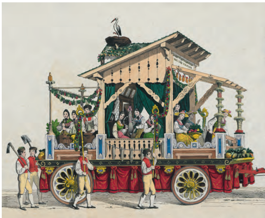
Flachsbereitung auf den Fildern. Wagen im Festzug der Württemberger 1841.

Wie sozio-ökonomische Faktoren damals zusammenhingen, zeigt die Geschichte der Rübenzuckererzeugung in Württemberg. Auch hier war die Centralstelle führend, vor allem die technischen Experten, die 1836 das Schützenbachische Patent der Zuckergewinnung aus Runkelrüben zu begutachten hatten. Von ihrem Urteil hing die Vergabe eines landesweiten Patentes ab. Denn wenn sich bewahrheiten sollte, dass sich aus Runkelrüben tatsächlich Zucker im großen Stil preiswert extrahieren ließe, dann könnten enorme Summen für die Einfuhr von Rohrzucker aus Westindien und anderen Ländern gespart werden. Da überall in Europa mit dem zuckerhaltigen Rübensaft experimentiert wurde, stand zu erwarten, dass irgendeinem Verfahren über kurz oder lang der Durchbruch zur Wirtschaftlichkeit gelingen werde. Zwar waren die Gutachter skeptisch, aber am Ende stimmten sie der Erprobung auf dem Rittergut Maisenhalden der Freiherren von