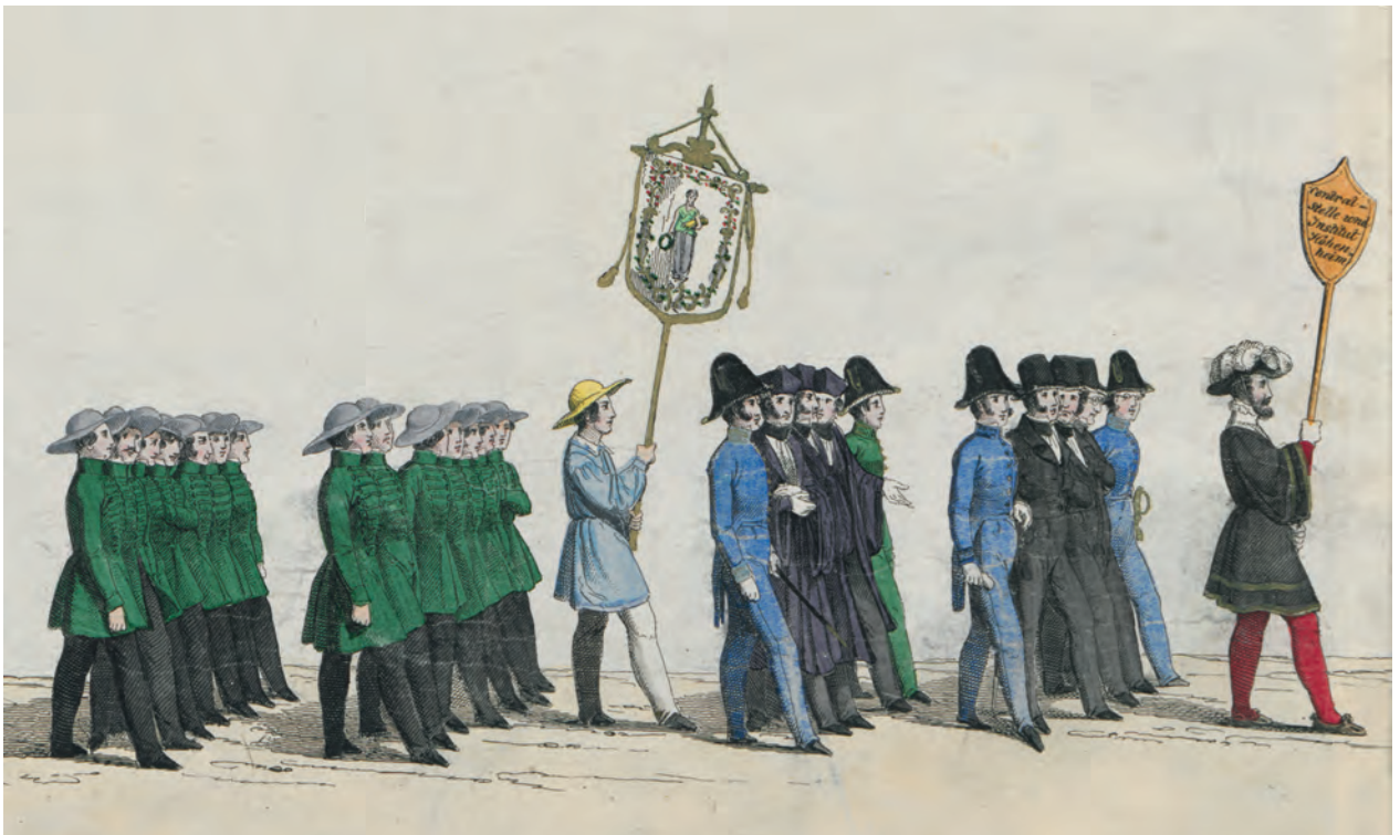
Das Präsidium der Centralstelle des landwirtschaftlichen Vereins (rechts) sowie Lehrer und Zöglinge des Landwirtschaftlichen Instituts Hohenheim im Festzug der Württemberger zum 25-jährigen Regierungsjubiläum König Wilhelms I. am 28. September 1841 in Stuttgart.

Entsprechend den Vorgaben schuf die Centralstelle geeignete Instrumente, wie den landwirtschaftlichen Verein, der durch zu gründende Bezirksvereine in die Oberämter hineinwirken sollte, das Landwirtschaftliche Institut Hohenheim 1818, das Correspondenzblatt als Kommunikationsorgan zwischen Centralstelle und Vereinsmitgliedern, das der Verleger Johann Friedrich Cotta – selbst Mitglied der Centralstelle – drucken und verbreiten wollte, aber zunächst nicht erscheinen konnte, weil sich kein Redakteur fand. Erst fünf Jahre später (1822) konnte die Cotta'sche Buchhandlung die ersten Hefte ausliefern. Die Centralstelle rief außerdem zur Gründung von Spezialvereinen auf, die sich einzelnen Zweigen der Landwirtschaft wie Schafzucht, Tabakbau, Weinbau, Seidenzucht oder dem für den Anbau nicht unwichtigen Klimawidmen sollten. Der landwirtschaftliche Verein, dem alle Landwirtschaftskundigen und –freunde beitreten sollten, erlebte zur Enttäuschung seiner Initiatoren nicht den erhofften Zuspruch. Es meldeten sich Leute, die nicht berufen werden konnten, weil sie keinem Vortrag folgen, keine Berichte und Aufsätze wegen ungenügender Schulbildung verfassen konnten. Und es gab Oberämter, wo der Appell zwar sofort aufgegriffen wurde, wie in Rottenburg a. N., Kirchheim/Teck, Rottweil, Tübingen, Ulm und Ellwangen, aber nach anfänglicher Euphorie die Aktivitäten abflauten. Auch gab es Landstriche, wo der Aufruf zur Gründung jahrzehntelang