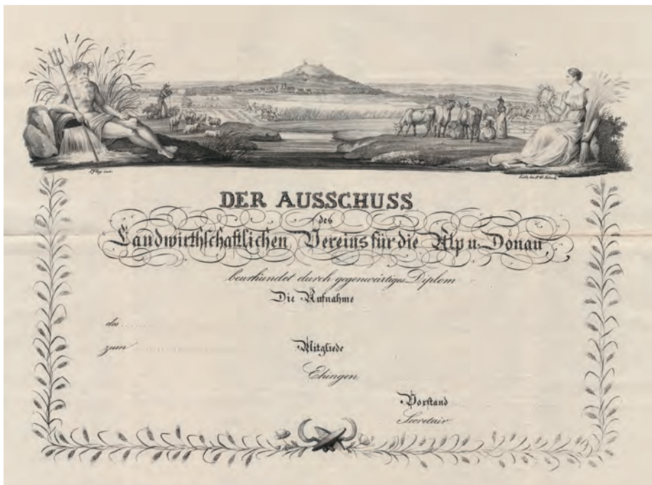
Aufnahmediplom des Ausschusses des (nicht anerkannten) Landwirtschaftlichen Vereins für die Alp [sic] und Donau, Ehingen, 1829/30 – mit allegorischer Darstellung von Ackerbau und Viehzucht: Ceres, Göttin der Fruchtbarkeit und Flussgott Neptun mit Dreizack vor dem Bussen, der höchsten Erhebung im nördlichen Oberschwaben, Lithographie von F. G. Schulz nach einem Entwurf von Johann Baptist Pflug.

Warum im Oberland so spät landwirtschaftliche Vereine entstanden, dafür können etliche Motive angeführt werden. Vordergründig wäre eine diskrete Opposition der mehrheitlich katholischen Oberschwaben gegenüber den protestantischen Beamten denkbar. Doch dieses Klischee greift zu kurz. Eher ist es ein tief verwurzeltes Misstrauen gegenüber allem, was die Regierung in Stuttgart an Gesetzen und Verordnungen erließ. In der Wahrnehmung der bäuerlichen Bevölkerung bedeuteten sie Eingriffe in den Alltag, oft verbunden mit Kosten, wie die Bestimmungen zur Umwandlung von Lehen- und Grundabgaben in genau berechnete Geldbeträge oder gar deren Ablösung und Allodifikation, die der Staat schon 1828 gestattete, aber durch übereifrige Kameralbeamte und die Standesherrschaften verhindert wurde. Die Oberamtänner, die bei Ruggerichten und Amtsversammlungen Erlasse der Regierung zu erläutern und zu vertreten hatten, waren Stadtbewohner, studierte Juristen, gelehrte Schreiber, aber keine Landwirte. Wenn die Oberbeamten für die Gründung eines landwirtschaftlichen Vereins warben, dann hatten sie ihre eigene Karriere im Blick; die Bauern aber fragten nach Kosten und Vorteilen einer Mitgliedschaft. Vor allem wollten sie keine Belehrungen von Leuten anhören, die keine landwirtschaftliche Praxis vorweisen konnten, sondern über wirklich drängende Probleme – wie die Abschaffung des Zehnten – frei reden. Aber kein Oberamtmann war dazu bereit! Falls doch ein landwirtschaftlicher Verein gegründet