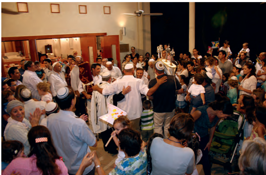
Jeden Herbst feiern Jung und Alt vor der Synagoge von Shavei Zion ausgelassen das Fest Simchat Tora. An diesem Tag dankt man Gott für das Geschenk der Tora, des Gesetzes.

Eine ganz besondere und ebenfalls schwäbische Gründung in Shavei Zion kann 2019 ihr fünfzigstes