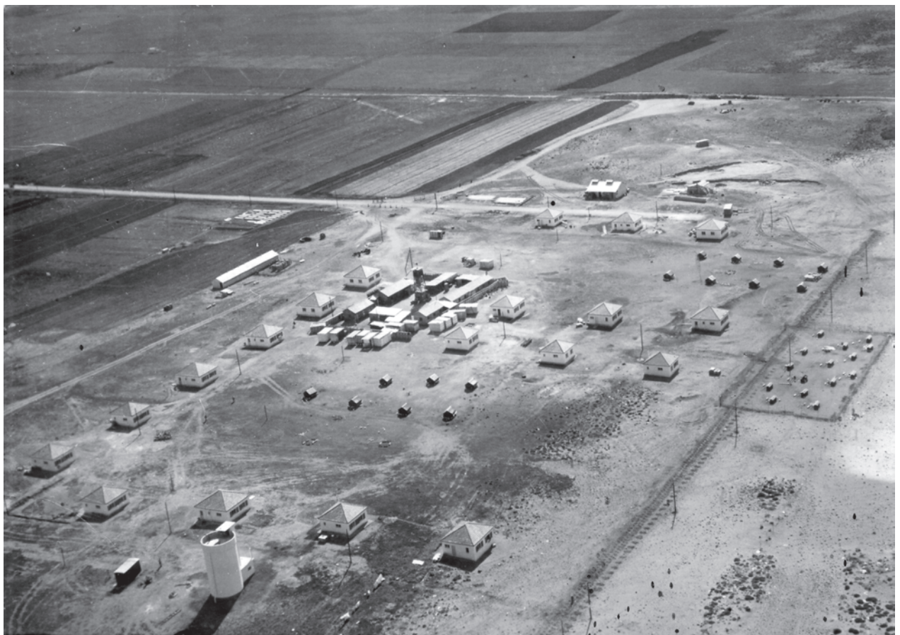
Shavei Zion im Jahr 1939. Im Zentrum stehen noch die Baracken, der Wachturm und die «Lifts», die Umzugscontainer aus Holz. Die ersten Häuser aus Beton und der neue Wasserturm sind schon fertig, rechts der Strand mit vielen kleinen Hühnerställen. Die Straße links führt zur Hauptstraße Haifa-Naharija.

Am 29. November 1947 beschloss die Vollversammlung der Vereinten Nationen mit 33 gegen 13 Stimmen die Errichtung eines jüdischen und eines arabischen Staates. Nach diesem Teilungsplan lagen Shavei Zion, Naharija und andere Siedlungen in Westgaliläa auf arabischem Staatsgebiet. Leopold Marx zitierte in seiner Dorfchronik einen Bericht, der die damalige Stimmung wiedergab: Unsere Freude ist gedämpft. Wir kennen die Lage, wir sehen die Gefahr. Am Ort wird der Wachdienst verschärft. Im Januar 1948