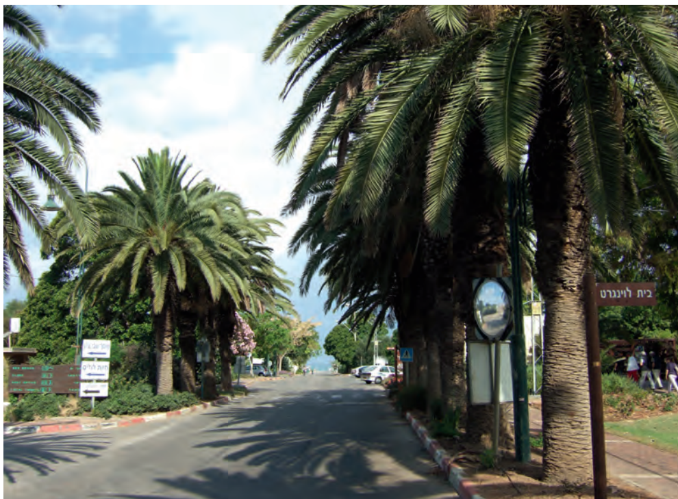
Die Eingangsstraße von Shavei Zion führt durch die Siedlung direkt zum Strand. Heute ist der Ort ein grünes Paradies am Mittelmeer.

eine Plastikfabrik, die Folien und thermogeformte Verpackungen zum Beispiel für Lebensmittel herstellte.