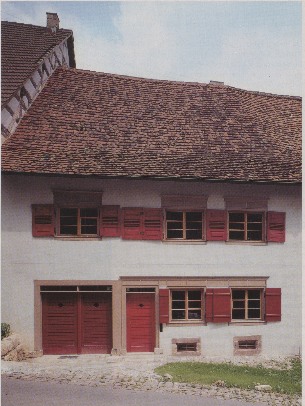
Straßenseite des Hauses Graben 15 in Rottweil-Altstadt, erbaut Mitte des 15. Jahrhunderts.

Im ersten Obergeschoß wurden die wertvollen, noch vorhandenen Holzteile der Bohlenstube, die Konstruktion und die Innenwände ausgebaut, restauriert und wieder eingebaut. Die Stube hat man in die Einzelteile zerlegt; nur so konnten nach Art des Zimmermanns Bohle für Bohle, Stirnbohle, Eckpfosten, Türpfosten, Eselsrücken, Bohlentüren, Wandschränke, Fußschwellen, Dielenboden und Kastenfenster ergänzt werden. Auch bei den alten Holzdielenböden verfuhr man so. Nach vorgefundenen Kacheln hat man die beiden Kachelöfen ausgeführt und aufgebaut. Bei der Untersuchung der