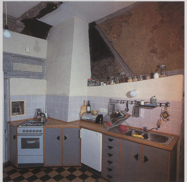
Lange Straße 26 in Schwäbisch Hall, erstes Obergeschoß. Oben die Küche mit dem historischen Rauchfang, unten das Bad.

che, die aus einer Kaufvertragsurkunde von 1868 hervorgeht und wohl bereits im 18. Jahrhundert vollzogen wurde, hatte weitgehende Umbauten zur Folge. Die ehemals überwölbte Balken-Bohlendecke der Wohnstube ist im Zuge des Austausches der straßenseitigen Fassade entfernt worden, an der Stelle des ehemals offenen Abzugs wurde ein geschlossener Kamin eingezogen und die Hinterladeröffnung zur Küche für die Befuerung des Stubenofens zugemauert. Die Küche ist durch den nachträglichen Einbau von Wänden von der Treppe abgetrennt und zur innenliegenden Küche geworden. Die Grundrißaufteilung wurde durch das Schließen von Türöffnungen verändert. Im ganzen