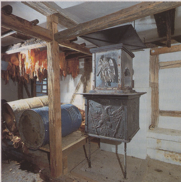
Trockenraum mit Ofen von 1780 im Zwischengeschoß der Biberacher Weißgerberwalk.

Wir bedanken uns bei allen Bewerbern für die hervorragenden Leistungen im Umgang mit historischer Bausubstanz und deren Erhaltung und bedauern es sehr, daß wir eine Auswahl treffen mußten aus Bewerbungen, die sich in nichts nachstanden. Ohne die Vielzahl von überzeugenden, gut renovierten Gebäuden, die von ihren Eigentümern engagiert präsentiert wurden, hätte der Denkmalschutzpreis der Württemberger Hypo und des Schwäbischen Heimatbundes nicht die Qualität erreicht, die den einzigen privaten Denkmalschutzpreis im Lande in den letzten Jahren auszeichnet.