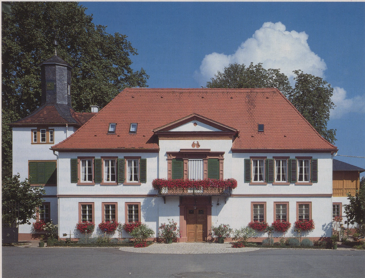
Gut Üttingshof bei Bad Mergentheim, das Herrenhaus von 1871 steht auf älteren Fundamenten.

Erst 1414 wird der Ort wieder genannt, als das Spital von Mergentheim den halben Üttingshof von Hans Schütz kauft. In den folgenden Jahren kauft das Mergentheimer Spital nach und nach den ganzen Hof mit allen Rechten auf. Der Deutschor-