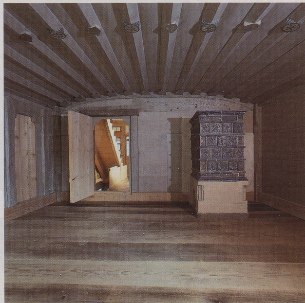
Bohlenstube von 1464/65 mit Kachelofen im ersten Obergeschoß des Hauses Graben 15 in Rottweil.

Im Jahr 1982 erwarb die Familie Bürk das Anwesen. Exakte Bauuntersuchungen und Freilegungen machten das ganze Schadensmaß erst deutlich. Vieles mußte ausgebaut, restauriert und wieder eingebaut werden. Die Schäden im Gewölbekeller wurden ausgebessert und Teile des Kellers ergänzt. Im stark beschädigten Erdgeschoß mußten die Außenmauern gesichert, der Unterzug eingebaut und das Deckengebälk ergänzt werden. Im heutigen Eingangsbereich wurde ein Boden aus alten Sandsteinplatten eingebaut, im Bereich des Architekturbüros ein Holzboden.