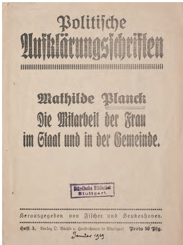
Mathilde Planck: Die Mitarbeit der Frau im Staat und in der Gemeinde . Stuttgart 1919. Mit der Wahl zur Deutschen Nationalversammlung 1919 erhielten Frauen im Reich erstmals das politische Stimmrecht. Viele 1919 gewählte Frauen verloren jedoch schon bald an politischem Einfluss.