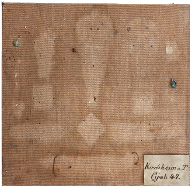
Originale Papp-Platte, auf der die Funde aus Grab 47 montiert waren. Deren Umrisse haben sich in den Staubablagerungen erhalten, wie auch die Beschriftung.