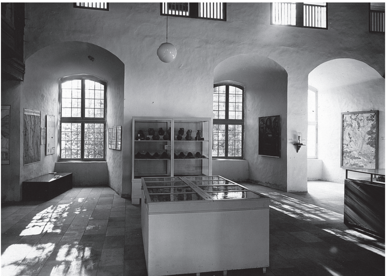
Heimatmuseum Kirchheim Teck; Aufnahme von 1939 in der Schlosskapelle, Ausstellungsbereich «Aus Kirchheims Vergangenheit». Im Hintergrund die Vitrinen mit den archäologischen Funden.

Dies scheint aber erklärlich. Wurden Funde gemacht, kamen sie zeitnah nach Stuttgart zur Präparation und – durch Drängen Laus – eben zurück nach Kirchheim. Sie wurden ganz fortschrittlich und vorbildlich sortiert mit Draht auf Pappen montiert, große Stücke wurden mit Tusche beschriftet. Fotografien aus dem Jahr 1939 dokumentieren nicht allein die gelungene Ausstellung im Schloss Kirchheim, es gibt auch drei Detailaufnahmen mit einigen der Alamannenfunde. Was hier abgelichtet ist, entspricht eher den Angaben von Walther Veeck von 1931 als jenen des Katalogs Kirchheim von 1962, und es ist durch einige der von Rainer Laskowski 1987 noch aufgefundenen Papp-Platten ganz klar als Gliederung nach Fundzusammenhängen zu erweisen. Es erschien Otto Lau gar nicht nötig, die Funde und Zusammenhänge detailliert zu dokumentieren, er hatte ja das Original fest montiert und beschriftet vorliegen. Und es lässt sich zweifelsfrei im Vergleich der Fotos von 1939 8 und dem Katalog Kirchheim von 1962 nachweisen, dass es erst zwischenzeitlich zu Verwechslungen gekommen ist.