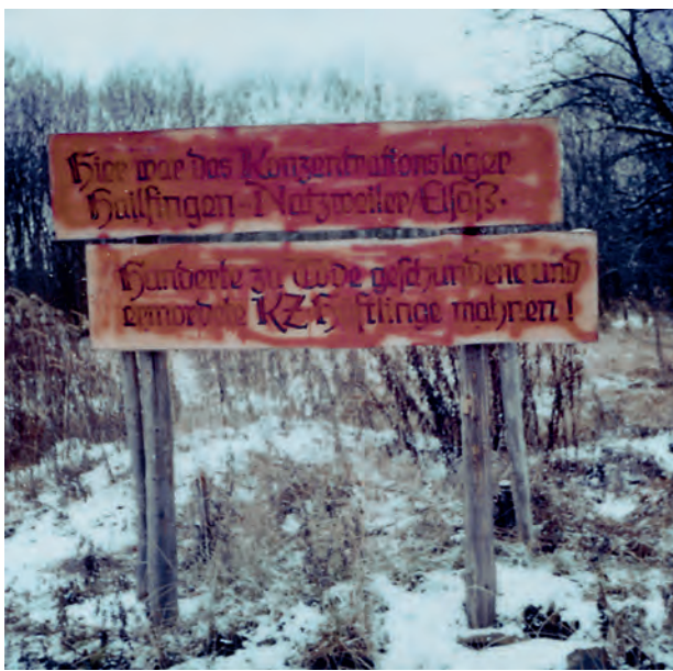
Die von der DKP Tübingen im Mai 1985 am Ende der Landebahn aufgestellte Gedenktafel, zerstört Anfang 1986 (historische Polaroidaufnahme). Text: «Hier war das Konzentrationslager Hailfingen-Natzweiler Elsass. / Hunderte zu Tode geschundene und ermordete KZ-Häftlinge mahnen. / Nie wieder Faschismus / Nie wieder Krieg!»