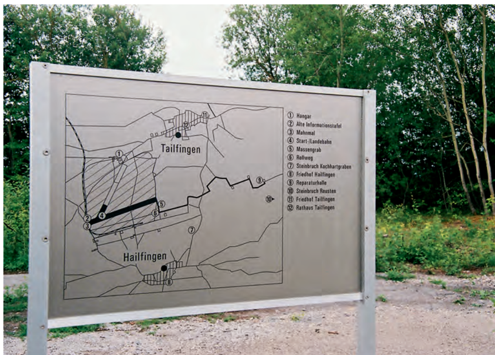
Informationstafel am Mahnmal mit einer Karte des Gedenkpades (2010).

anstrengende Erinnerungsarbeit der Menschen in der Region.