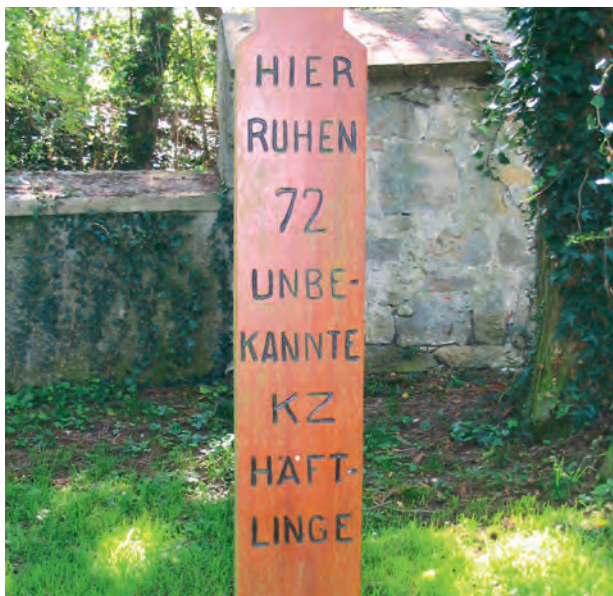
Das 1945 aufgestellte und später erneuerte Holzkreuz hinter dem Gruppengrab auf dem Friedhof Tailfingen.

Welche bleibenden Spuren der Erinnerung hat das Schicksal dieser Menschen hinterlassen? Der Historiker Eberhard Jäckel hat einmal darauf hingewiesen, dass es Teil des nationalsozialistischen Vernichtungswahns war, keine Spuren der Verbrechen zu hinterlassen und nicht nur die Menschen zu vernichten, sondern auch die Erinnerung an sie zu verhindern: Die im Zweiten Weltkrieg ermordeten Juden