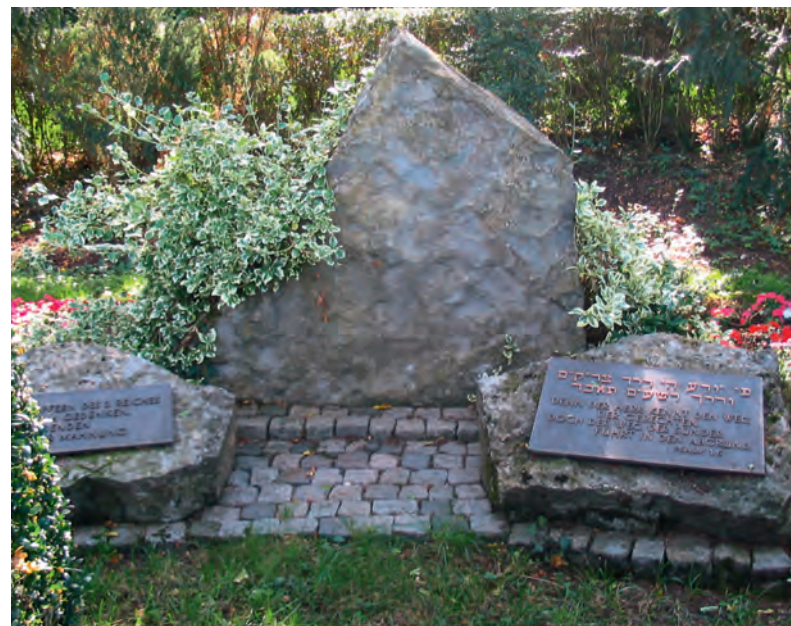
Gedenkstein und Erinnerungstafeln auf dem Friedhof Tailfingen von 1986. Dort heißt es: «Den Opfern des 3. Reiches zum Gedenken, den Lebenden zur Mahnung. / Den Opfern des 3. Reiches zum Gedenken, den Lebenden zur Mahnung. / Denn der Herr kennt den Weg der Gerechten doch der Weg der Sünder führt in den Abgrund. Psalm 1.6.»

Für den Friedhof als Standort habe man sich entschieden, weil das Grab die einzige Stelle sei, die eine eindeutig feststellbare und direkte Beziehung zu den Opfern hat. Der Friedhof biete überdies natürlichen Schutz vor Beschädigungen und Übergriffen, vor Bube-