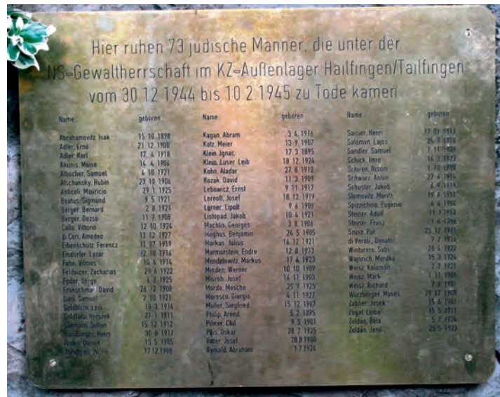
Namenstafel auf dem Gruppengrab (Friedhof Tailfingen). Sie wurde 2010 angebracht und enthält die 73 Namen der hierher umgebetteten Opfer.

Sie wurde umgestürzt und beschmiert, im Januar 1989 mit obszönen Worten, dem Sowjetstern und einem rosafarbenen Davidstern versehen und erneut 1994 beschädigt. Bei der Erneuerung wurde die Tafel ein Stück ostwärts versetzt und einfach umgedreht. Auf der Rückseite war nun die ursprüngliche Fassung mit den Verschmierungen zu sehen. Bis zum Jahr 2010 blieb diese Tafel der einzige Hinweis auf das Lagergelände und seine Geschichte. Bei der Errichtung des Mahnmals von 2010 direkt neben dieser Tafel entzündete sich eine Diskussion, ob diese «alte Tafel» jetzt nicht beseitigt werden sollte. Es konnte schließlich durchgesetzt werden, dass sie als historisches Dokument der Erinnerungsgeschichte nach 1945 erhalten bleibt. Allerdings wurden inzwischen – wohl im Übereifer – die Schmierereien auf der Rückseite entfernt.