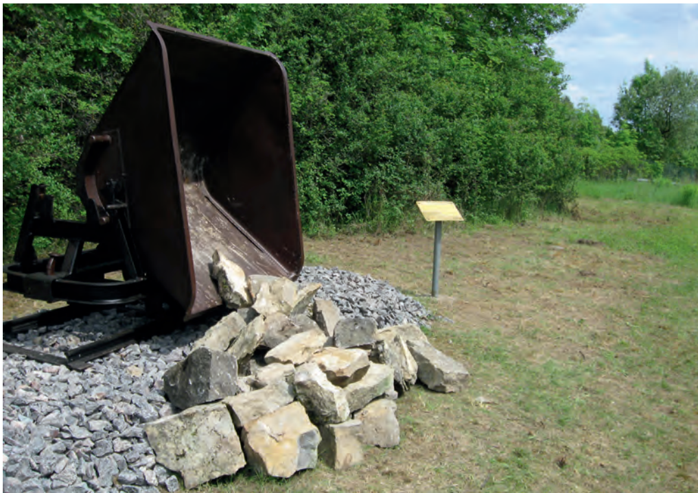
Eine Kipplore am Rande des Steinbruchs von Reusten bildet eine Station des Gedenkpades.

dieses Befehls zerstreuten ich und der Friedhofsaufseher Weiß die Asche der Häftlinge nicht, sondern sammelten die Asche und verbrachten sie in ein Grab der Abteilung Y des städt. Friedhofs. Nachdem das erste Grab gefüllt war, wurde ein zweites Grab angelegt. Die letzten Verbrennungen fanden am 14. Januar 1945 statt. Am 15. Januar wurde das Krematorium durch Luftangriff beschädigt und stillgelegt. Die beiden Aschengräber wurden zugedeckt und wie andere Gräber gerichtet und gepflegt. 8