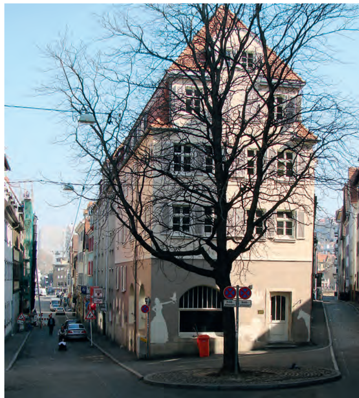
Wenig beachtet, obwohl gut erhalten: die drei Arbeiterwohnhäuser Theodor Fischers im Stuttgarter Leonhardsviertel.

Zu Fischers bekannteren Stuttgarter Bauten gehören die Heusteigschule und die Erlöserkirche. Das voluminöse Gebäude der «Sammelschule» in der Heusteigstraße scheint zusammengesetzt aus einer Vielzahl von Baukörpern, welche die Massen gliedern und mit den dahinter verborgenen Funktionen korrespondieren. Im Wesentlichen besteht die Schule aus zwei annähernd quadratischen, turmartigen Bauten mit einem zurückgesetzten Mitteltrakt. Vielfältige Fensterformen, plastischer Schmuck und bunte Sgraffito-Felder in der oberen Etage lockern