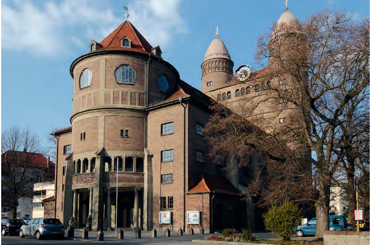
Garnisonskirche, heute Pauluskirche in Ulm: An einen Wasserturm erinnert die Eingangssituation im Westen; die Turmhelme der Rundtürme im Osten rekurren auf syrische Vorbilder.

überlebt hat. Paul Bonatz hielt sich beim Wiederaufbau in freier Form an das Vorbild, Günter Wilhelm fügte den quadratischen Oberlichtsaal hinzu.