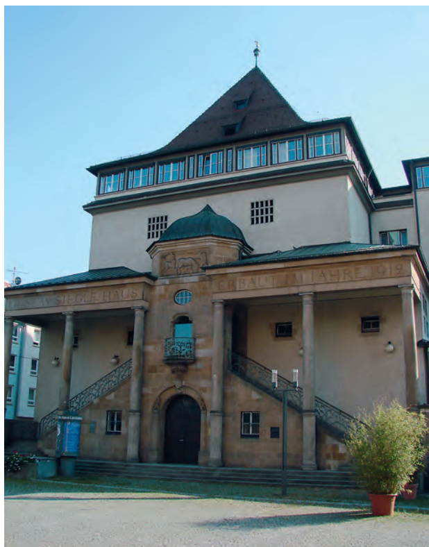
Der Treppenaufgang am Gustav-Siegle-Haus, nach 1945 wiederaufgebaut von Martin Elsaesser, spielt an auf die 1902 entdeckte und in den Schlossgarten versetzte Lusthausruine.

die massigen Baukörper auf. Jeweils vier vogel- und reptilartige Bronzefiguren an einem laternenartigen Absatz der Turmdächer versinnbildlichen die vier Elemente und die vier Temperamente. Wer will, kann in den flachen Bögen der Pfeilerreihe im Eingangsbereich Martin Elsaessers Markthalle vorweggenommen sehen, oder in der Gliederung der Bau-massen Paul Bonatz' Hauptbahnhof.