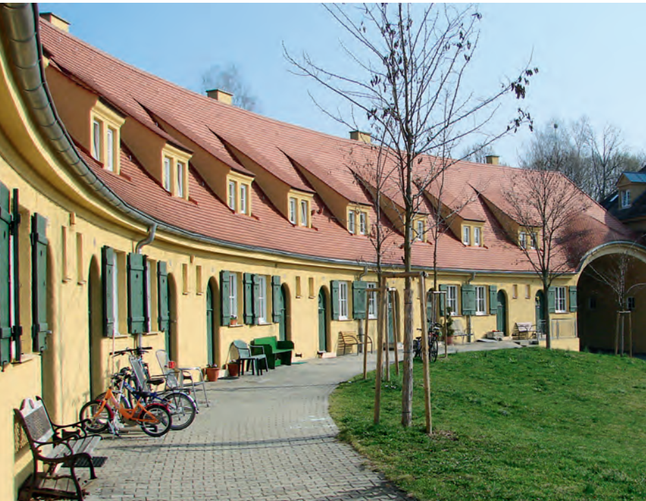
Abbildung links: Bruno Taut hat mitgebaut: Der halbrunde Altenhof, Krönung der Arbeitersiedlung Gmindersdorf.