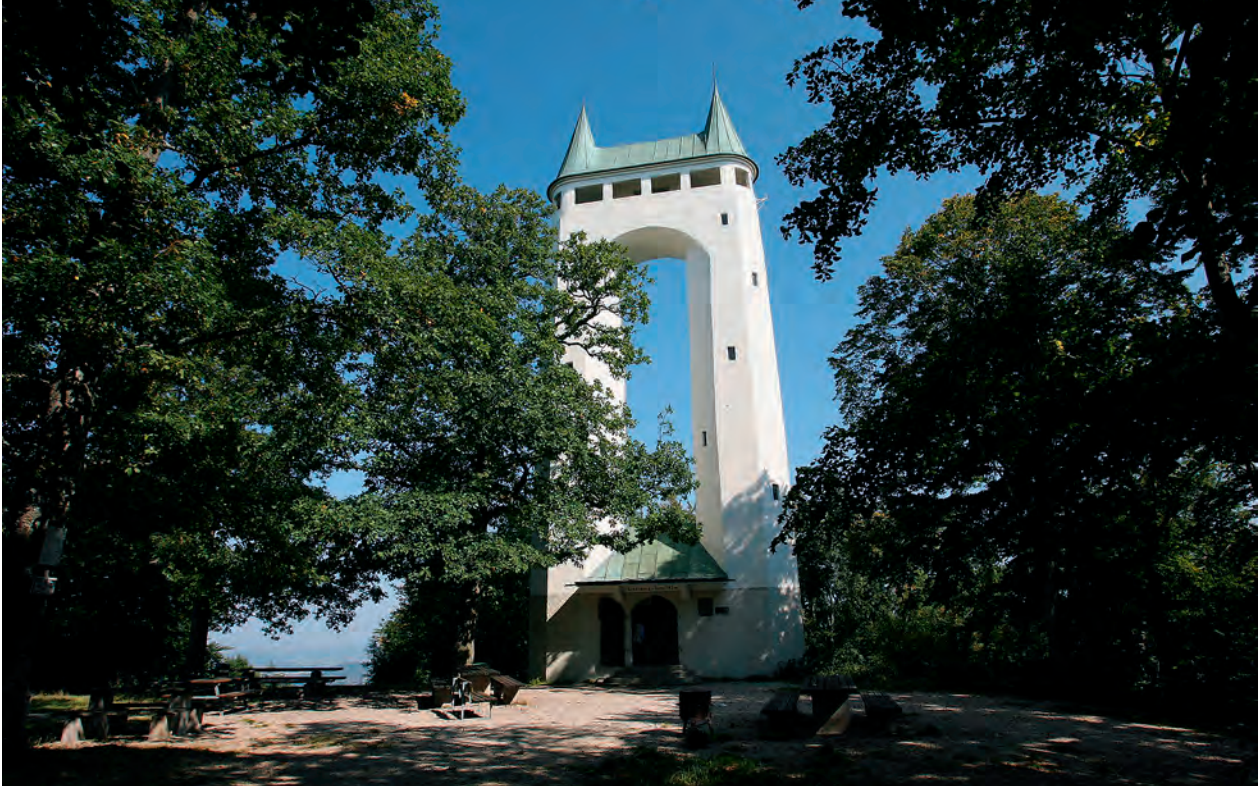
Zwei spitze Rundtürme, durch eine Aussichtsplattform verbunden: Der Schönbergturm, «Pfullinger Onderhos» genannt.

kranz und den Turnverein. Der Bau besteht aus einem querrechteckigen Festsaal mit Bühne und einer angrenzenden, von einem riesigen Gewölbe überfangenen Turnhalle. An den Festsaal schließt seitlich eine Vorhalle mit zwei vorspringenden Eckpavillons an, die einen Sitzungssaal und die Garderobe enthalten.