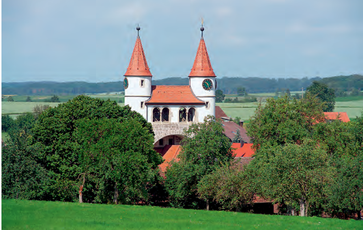
Zwei zu einem Riegel verbundene Rundtürme wurden seit Gaggstatt zu so etwas wie Theodor Fischers Markenzeichen. Erstmals verwendete Fischer die Idee bei einem Entwurf, den er für den Wettbewerb für das Leipziger Völkerschlachtdenkmal einreichte.