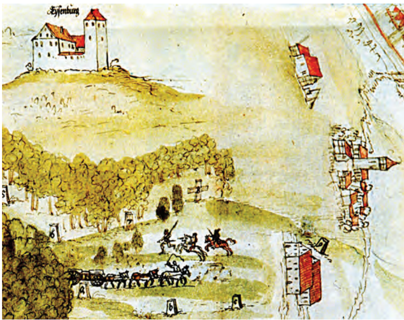
Eine Grenzstreitkarte zwischen den Herrschaften Isenburg und Wehrstein aus dem Jahr 1557 zeigt links oben die Isenburg und rechts davon das Dorf Nordstetten und den Buchhof.

Seither dient der barocke Adelswohnsitz der Ortschaft Nordstetten als kommunales Mehrzweckgebäude. Neben den gemeindlichen Verwaltungseinrichtungen beherbergte das Nordstetter Schloss früher die unteren Klassen der Volksschule samt einem kleinen Turnsaal, die Mosterei, die Gemeindewaage und ein Schlachthaus. Selbst der einst von zwei Pferden gezogene Leichenwagen der Gemeinde Nordstetten fand seinen Platz in der ehemaligen Kutschenremise.