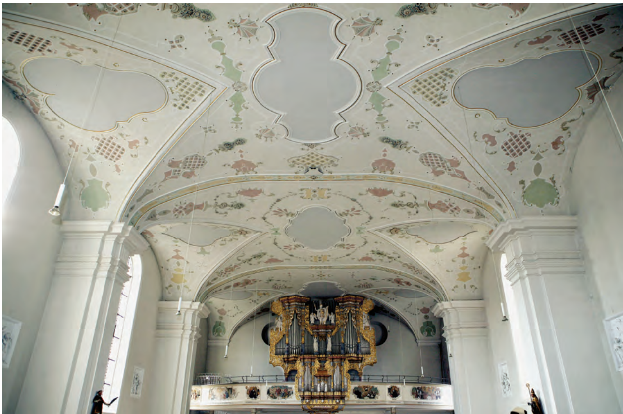
Ein Blick auf den Bandelwerkstück der Horber Stiftskirche und des Nordstetter Schlosses verrät die Handschrift des Baumeisters Melchior Schöntzle aus dem Klosteramt Zwiefalten.

Den finanziellen Wagemut des Nordstetter Schlosserbauers beleuchtet die Tatsache, dass das Nordstetter Schloss der einzige Profanbau ist, der am oberen Neckar im Zeitalter des Barock von einem Mitglied der schwäbischen Reichsritterschaft vollständig neu errichtet worden ist. Bei den anderen Schlössern zwischen Schwarzwald und Schwäbischer Alb handelt es sich dagegen lediglich nur um barocke An- oder Umbauten, weshalb die Nordstetter mit Fug und Recht behaupten können, dass sie das schönste Barockschloss besitzen, weil es weit und breit das einzige ist.