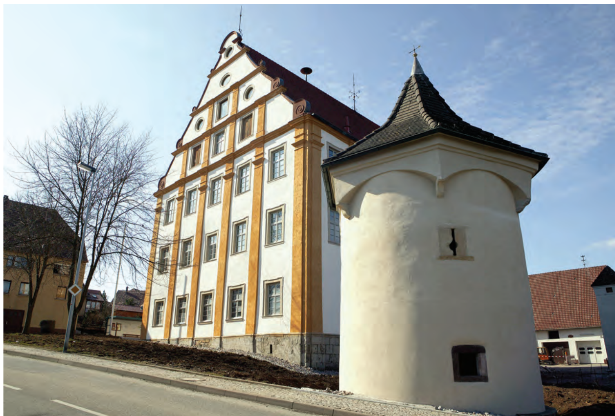
An den Vorgängerbau aus dem 16. Jahrhundert erinnern noch der Gewölbekeller, über dem der barocke Neubau errichtet worden ist, und einer von ursprünglich vier Wehrtürmen.