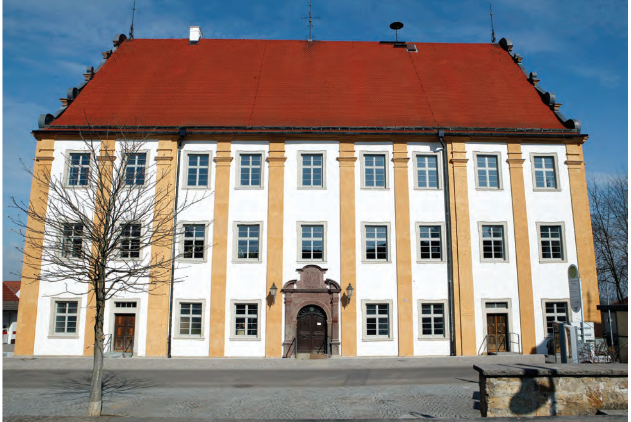
Das Nordstetter Schloss ist mit 27 Meter Höhe ein weit in die Landschaft wirkendes Bauwerk, dessen Südfassade durch geschossübergreifende Lisenen in neun Achsen gegliedert wird.