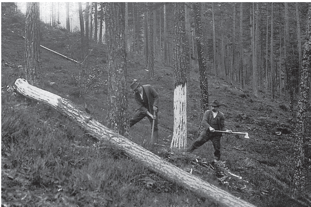
Waldarbeit in den 1920er-Jahren: «Der bergseitige Arbeiter treibt vorsichtig den Keil in den Sägeschnitt, der den Baum zum Fallen bringt, der andere steht bereit, um die letzte Hilfe mit der Axt zu geben, sobald der Stamm sich neigt (Durchhauen der Fallkerbe, damit der Stamm dort nicht splittert und abreißt).» Bildbeschreibung von Otto Feucht, 1926.

Otto Feucht fotografierte hauptsächlich in Württemberg. Seine fotografische Tätigkeit variierte in der Anzahl der Aufnahmen über die Jahre hinweg, beispielsweise unterbrochen durch die Jahre des Ersten Weltkriegs. Auch die Themenschwerpunkte veränderten sich: Ging es zunächst vor allem um besondere Bäume und um Pflanzengesellschaften, widmete er sich später auch der Dokumentation von forstlichen Arbeiten und schuf dadurch einzigartige