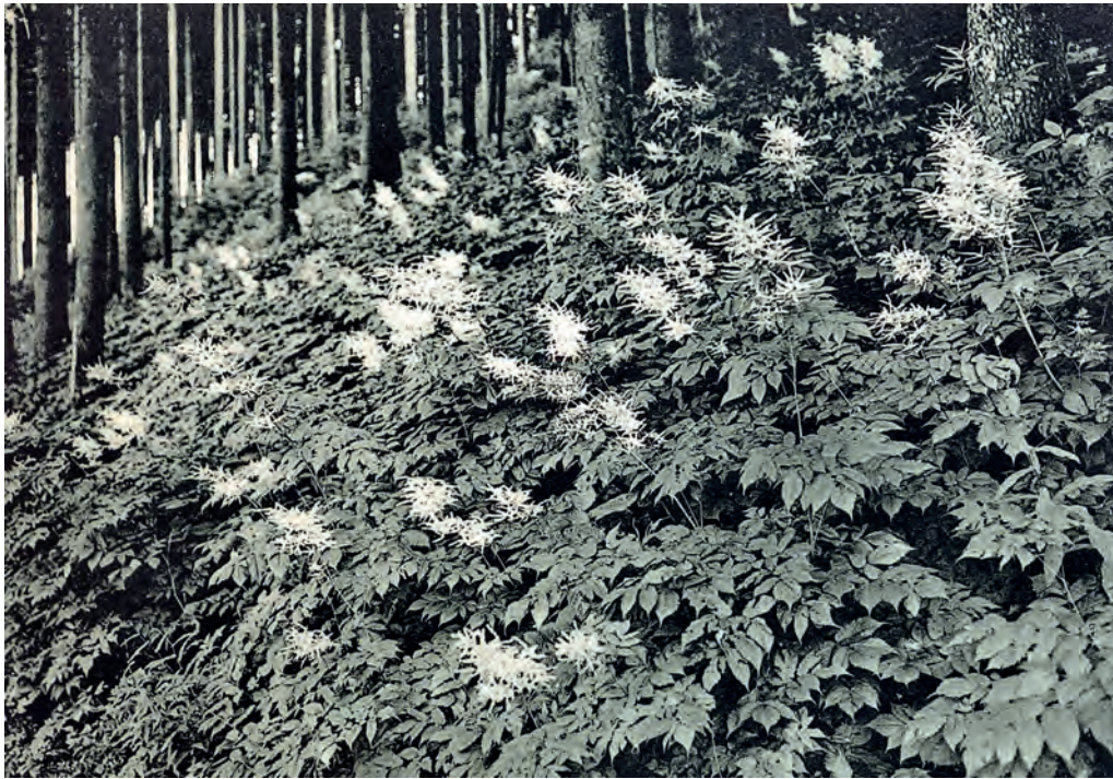
Vegetationskundliche Aufnahmen im Waldesinneren waren zu Beginn des 20. Jahrhunderts noch eine große Herausforderung: Geißbart (Aruncus silvester). Aus «Württembergs Pflanzenwelt», 1912.

Kameraausrüstung erhielt er im Jahr 1908. Dabei handelte es sich um eine Plattenkamera mit einem dreiteiligen Holzstativ sowie einer Tragetasche mit 18 gefüllten Blechkassetten und weiteren Plattenpackungen. Ein Wechselsack machte das Wechseln der Platten, mit einer lichtempfindlichen Schicht beschichtete Glasträger, in voller Sonne möglich. Die Schwierigkeiten bei den Aufgaben, die Otto Feucht sich stellte, blieben dennoch erheblich – beispielsweise benötigte man für die Belichtung einer Nahaufnahme, etwa einer Pflanze an ihrem Stand-