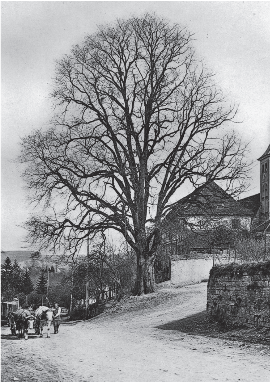
Die Klosterulme in Denkendorf, 1910. Der Baum steht nicht allein, sondern ist wichtiger Teil des Ortsbildes.

Otto Feucht setzte Fotografien dazu ein, Landschaftsveränderungen zu dokumentieren. Die bloße Gegenüberstellung von Bildpaaren unterschiedlicher Aufnahmezeitpunkte macht die Entwick-