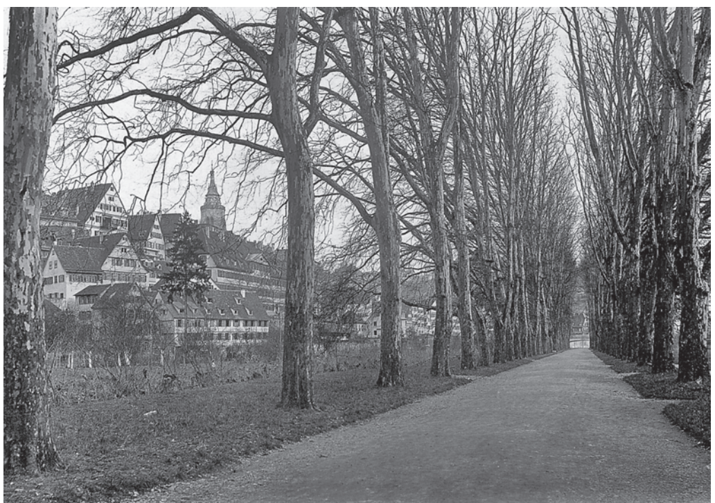
Platanenallee in Tübingen, 1910. Otto Feuchts Fotografien folgen typischerweise einem sorgfältig durchdachten Bildaufbau, der sich an künstlerischen Prinzipien wie etwa dem «Goldenen Schnitt» orientiert. Aus «Schwäbisches Baumbuch», 1911.

Der fotografische Nachlass von Otto Feucht kann erst seit kurzem näher überblickt werden. Ein Großteil der Negative der Jahre 1908 bis 1931 (Glasplatten im Format 10 x 15 cm) lagerte in der Württembergischen Bildstelle in Stuttgart. Völlig überraschend wurden im Jahr 2005 im Dienstgebäude der Landesanstalt für Umwelt, Messungen und Naturschutz Baden-Württemberg (LUBW) in Karlsruhe weitere Negative sowie die von Otto Feucht selbst verfassten Bildbeschreibungen zu allen, d.h. auch zu den Stuttgarter, Negativen gefunden. Hierdurch wurde es möglich, den umfangreichen Bestand (rund 2.200 Aufnahmen) zu erschließen. In einem Gemeinschaftsprojekt zwischen dem Institut für Landespflege der Universität Freiburg, der LUBW sowie dem Landesmedienzentrum Stuttgart (LMZ) erfolgte eine Sichtung dieses Fotobestandes – Verschlagwortung, regionale Zuordnung der Fotografien usw. – und eine wissenschaftliche Auswertung 11 . Über eine Internet-Bilddatenbank macht das LMZ viele der Aufnahmen von Otto Feucht zugänglich 12 . Rund tausend weitere, bisher nicht näher untersuchte Glasnegative mit Aufnahmen etwa aus dem Zeitraum 1920 bis 1945 sowie weitere Dokumente von Otto Feucht befinden sich im Staatlichen Museum für Naturkunde in Stuttgart.