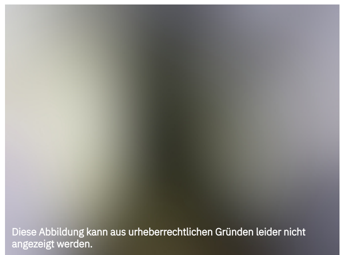
Diese Abbildung kann aus urheberrechtlichen Gründen leider nicht angezeigt werden.

»In unseren Beständen befinden sich zwei Fundstellen, Fragmente von Listen und Meldekarten von Zwangsarbeitern. Beiden Fundstellen ist gemein, dass die Zwangsarbeiter von den großen Geislinger Betrieben WMF und MAG angemeldet wurden, die Nationalität der Personen