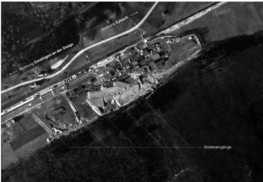
Luftaufnahme der Alliierten 1945. Heute befinden sich im Eybacher Tal weitläufige Sport- und Reitanlagen. Die Stolleneingänge am Südhang oberhalb des Flüsschens sind zugeschüttet und lediglich an wenigen Stellen noch an der künstlichen Geländeformation zu erkennen.

Berg getrieben worden, doch nur der Stollen Rubin sei bis zum Kriegsende beinahe fertig geworden.