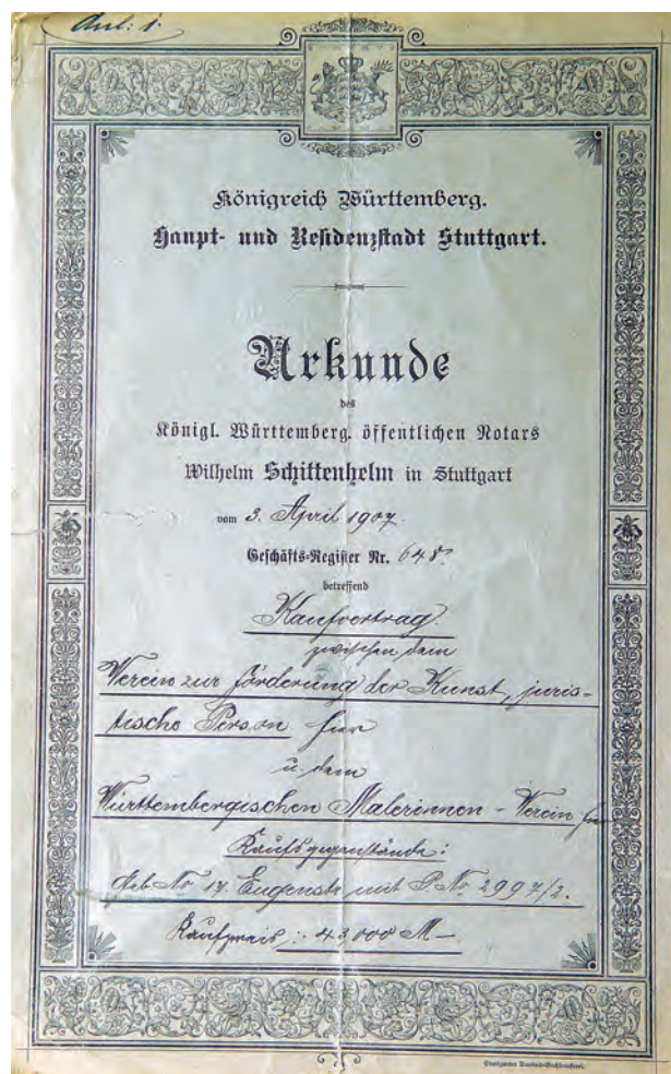
Kaufurkunde vom 3. April 1907, Kunstsammlung Bund Bildender Künstlerinnen Württembergs Stuttgart.