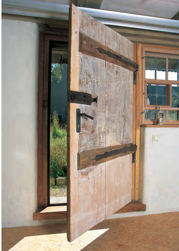
Von hervorragender handwerklicher Qualität sind die Reparaturen und der Nachbau des Holzwerks in Hausen ob Verena.

schnitt geführt hatte, nicht erhalten werden konnten. Ebenso wurde die Ende des 17. Jahrhunderts hinzugefügte Gebäudeverlängerung im Bereich des Stalls nicht wieder aufgebaut. Ansonsten erfolgte ein präziser Wiederaufbau mit den Originalteilen, seien es Blockstufen, Bodendielen, Türblätter, Kachelöfen, Biberschwanzziegel oder selbst kleinste Details wie Beschläge, die alle wieder an ihren historischen Ort zurückkamen. Beschädigte Holzelemente wurden repariert, wobei die handwerkliche Qualität der Arbeit beeindruckt. Nachbauten, etwa von Fenstern, Fensterrahmen und Klapppläden, erfolgten, ebenfalls in exzellenter Ausführung, ausschließlich nach Mustern, die am Haus selbst vorzufinden waren.