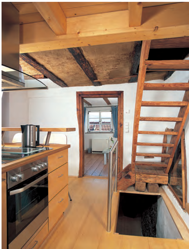
Die Küche gleich hinter der Haustür, ursprünglich und auch nach der Sanierung als Ferienhaus der Mittelpunkt des Burkheimer Tagelöhnerhäuschens.

Dennoch war der Sanierungsaufwand beträchtlich. Die Betondecke mit ihren Metallträgern über dem Stall war wegen des lange eindringenden Regenwassers völlig korrodiert und wurde wieder durch eine Holzbalkendecke ersetzt, wie es sie schon früher an dieser Stelle gegeben hatte. Durch den Abbruch der Zwischenwand wurde der ursprüngliche Grundriss der Küche wieder hergestellt, in die man nun direkt durch die Haustür eintritt. Wegen Sicherheits- und Schallschutzwünschen der Nachbarn musste der westliche Giebel zusätzlich mit