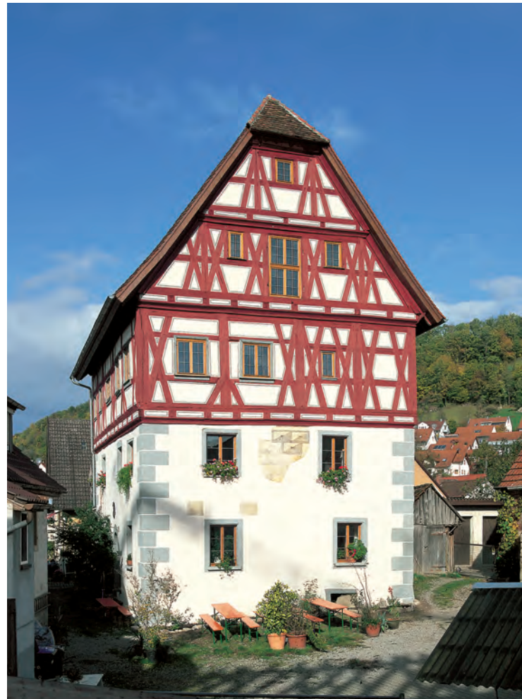
Das imposante «Senftenschlössle» in Untermünkheim nach der Sanierung. Im ehemaligen Adelsitz kann man heute übernachten.

Im 20. Jahrhundert war schließlich vom ehemals repräsentativen Bild eines ländlichen Adelsitzes nicht mehr viel zu erkennen. Der Wassergraben war längst zugeschüttet und die Bebauung des Dorfes bis