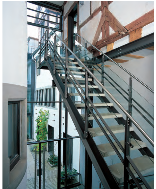
Ein moderner Treppenlauf im bewussten Kontrast zu den restaurierten Bauteilen aus Mittelalter und Renaissance.

es ist aber auch gelungen, durch eine konsequent moderne Formensprache bei allen neu hinzugekommenen architektonischen Elementen einen spannenden Dialog zwischen Alt und Neu zu erreichen. Dabei ist vor allem die haushohe, zur Straße und zum Hof hin völlig verglaste Halle zu erwähnen, die an die Stelle der Überbauung zwischen den beiden