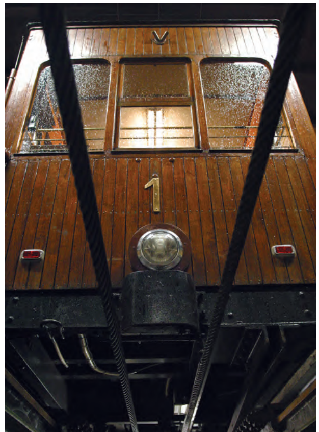
Der Waggon 1 der Standseilbahn, die von Stuttgart-Heslach zum Waldfriedhof führt, von unten aufgenommen.

Die Jury des Denkmalschutzpreises zeigte sich sehr erfreut darüber, dass es trotz zunächst unüberwindbar scheinender bürokratischer Hürden gelungen ist, die alten Wagen zu erhalten und zu restaurieren sowie die historische Antriebstechnik an Ort und Stelle zu belassen. Die Mitglieder waren einhellig der Meinung, in diesem außergewöhnlichen Fall eines beweglichen technischen Denkmals den Verantwortlichen der Stuttgarter Straßenbahnen AG für ihr Engagement eine besondere Anerkennung auszusprechen.