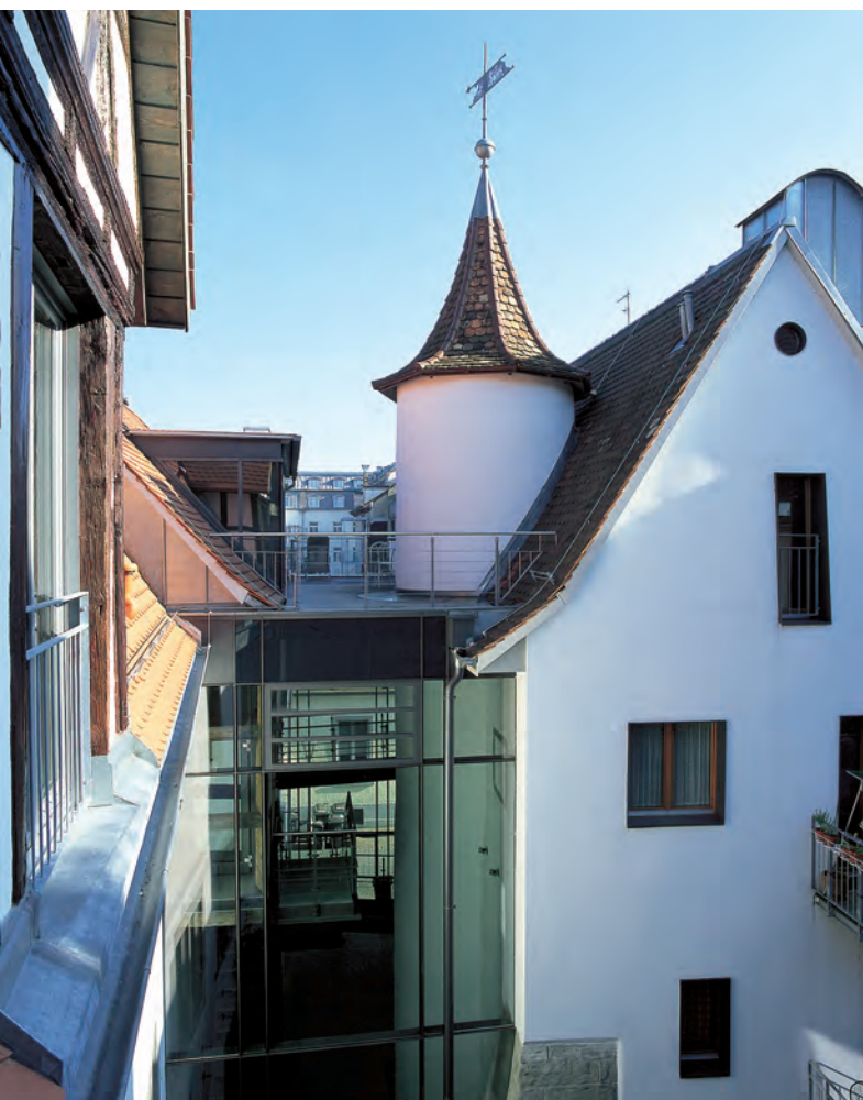
Nach der Freilegung der Häusergruppe Sigismundstraße in der Konstanzer Altstadt bildet eine gläserne Halle die notwendige Zäsur zwischen den historischen Bauten.

Von Anfang an war allen Beteiligten klar, dass in dem Anwesen bedeutende alte Teile steckten, auch wenn die Zusammenhänge zunächst noch nicht nachvollziehbar waren. Umfangreiche Bauaufnahmen und die Auswertung archivalischer Quellen durch die Bauforscher Burghard Lohrum, Stephan King bzw. Mirko Gutjahr und Frank Löbbecke zu Beginn der Planung wie auch begleitend während der Bauphase 2001 bis 2005 brachten erst nach und nach Licht in eine komplexe Bauabfolge, die ihrerseits Mosaiksteine zum Bild der historischen Entwicklung von Konstanz lieferte.