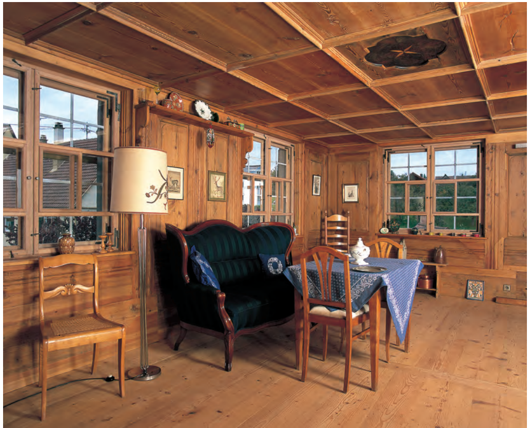
Eine der beiden Stuben des Vogts-hofes in Hausen ob Verena mit ihrer Vertäfelung aus der Mitte des 18. Jahrhunderts.

profilierten Seitenleibungen und auskragendem Fenstersturz sowie dekorativ bemalten Schlagläden für ein moderneres Aussehen. Hinzu kamen jetzt auch die bereits erwähnten Innenausstattungen.