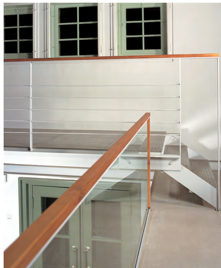
Dem Credo der Holzmanufaktur verpflichtet: Vorbildliche Reparatur und originalgetreuer Nachbau von Türen und Fenstern, dazu formal und handwerklich qualitätsvolle neue Bauteile, die sich dem Gesamtbild einordnen.

Der Ausgang des Zweiten Weltkriegs bildete die größte Zäsur in der Werksgeschichte. Jegliche Produktion für das Militär wurde durch alliierten Beschluss eingestellt. Dem Nachfolgeunternehmen «Rhodia» war mit der Produktion von Kunstfasern Anfang der 1960er-Jahre nochmals ein gewisser Erfolg beschieden. Die Mitarbeiterzahlen von früher wurden jedoch nicht mehr erreicht, und sie gingen rapide zurück, bis das Werk 1994 endgültig stillgelegt wurde. Dem riesigen Areal, auf dem immerhin rund vierzig Bauten als Kulturdenkmale ausgewie-