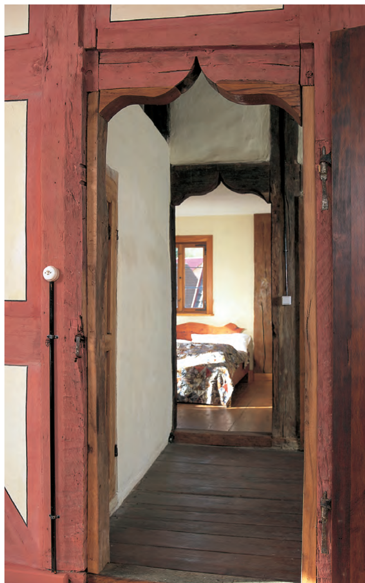
Die Radlerherberge im Untermünkheimer «Senftenschlössle» bietet stimmungsvolle Zimmer mit Geschichte.

Das heißt jedoch nicht, dass man sich als temporärer Bewohner des Senftenschlössles mittelalterlichen Verhältnissen ausliefern müsste. Für entsprechende sanitäre Sammeleinrichtungen ist auf jedem Stockwerk gesorgt, und es gibt selbstverständlich auch eine moderne Zentralheizung. Deren Heizkessel ist im Dachgeschoss installiert, wo er am wenigsten stört, wie überhaupt die moderne Haustechnik behutsam in die historische Bausubstanz integriert wurde. Die größtmögliche Schonung der originalen Oberflächen war stets erklärtes Ziel, ebenso sollten die neuen Installationen optisch nicht in den Vordergrund treten. Neu eingefügte und ersetzte Details, wie zum Beispiel die Türen, ordnen sich erkennbar als Nachbauten oder neutral gehaltene Bestandteile dem Ganzen unter.