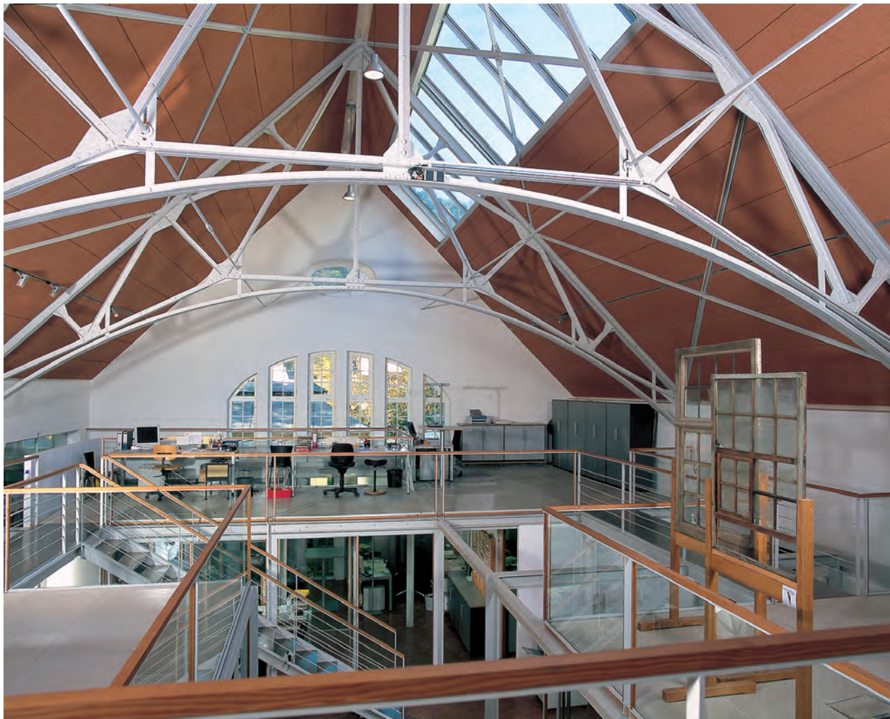
Der ehemalige Speisesaal der Arbeiterkantine mit eiserner Dachkonstruktion von 1909. Die neuen Einbauten für Büros und Ausstellung bestechen durch ihre Leichtigkeit.

sen worden waren, drohte das Ende als gigantische Industriebrache.