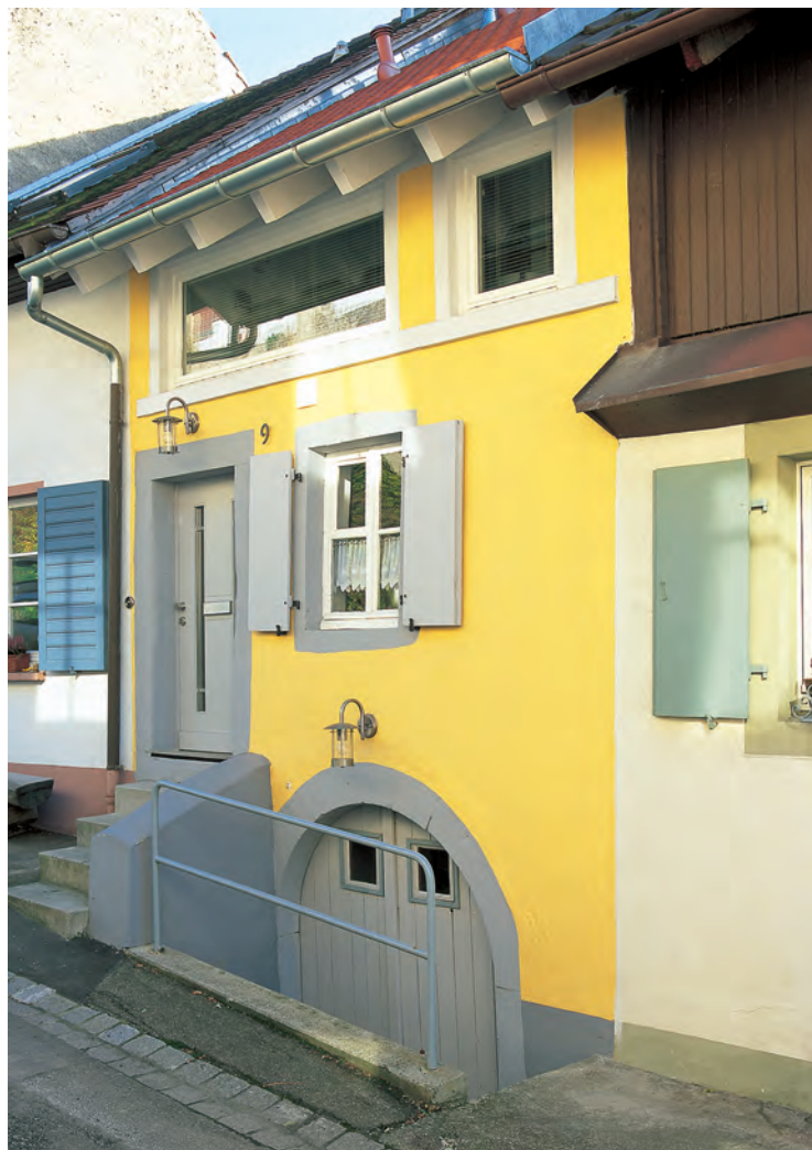
Dieses Tagelöhnerhäuschen, das nur 3,80 Meter breit ist, steht in Burkheim im Kaiserstuhl. Durch die Verglasung des Kniestocks oben fällt das Licht in das neue Bad.

Nach zehn Jahren Leerstand befand sich das Häuschen in einem erbärmlichen Zustand. Vor allem die Dachdeckung auf der Straßenseite war seit geraumer Zeit undicht, sodass das Regenwasser ungehindert eindringen konnte. Niemand wollte sich mit einer vom Zuschnitt und von der Erhaltung her derart problematischen Immobilie belasten. Der Abbruch schien nur eine Frage der Zeit, denn für ein freies Grundstück gab es durchaus Interessenten. Lediglich die Einstufung als Kulturdenkmal und der Kontext der historischen Burkheimer Altstadt als