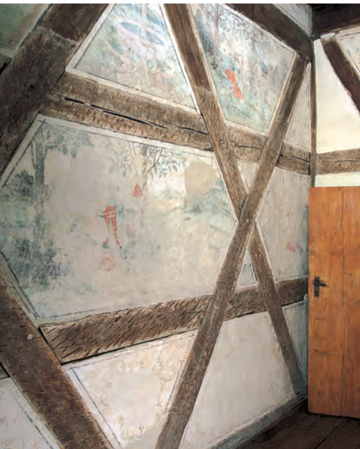
Nur durch Zufall entdeckt: Wertvolle Malereien des 16. Jahrhunderts versteckten sich unter einem späteren Verputz.

geisterte Gruppe, die in der Region zwischen Neckar und Main bereits eine ganze Reihe ähnlicher Objekte in ihre Obhut genommen hatte und damit über einschlägige Erfahrung verfügte. Die gelungene Sanierung des ehemaligen Spitals im nahen Neuenstein brachte den Mitgliedern im gleichen Jahr 2002 schon den Denkmalschutzpreis ein. Auch wenn sie sich in Untermünkheim nicht – wie andere – als finanzkräftige Unternehmer hatten präsentieren können, so überzeugte den Gemeinderat doch ihre offensichtliche Begeisterung für die Sache.