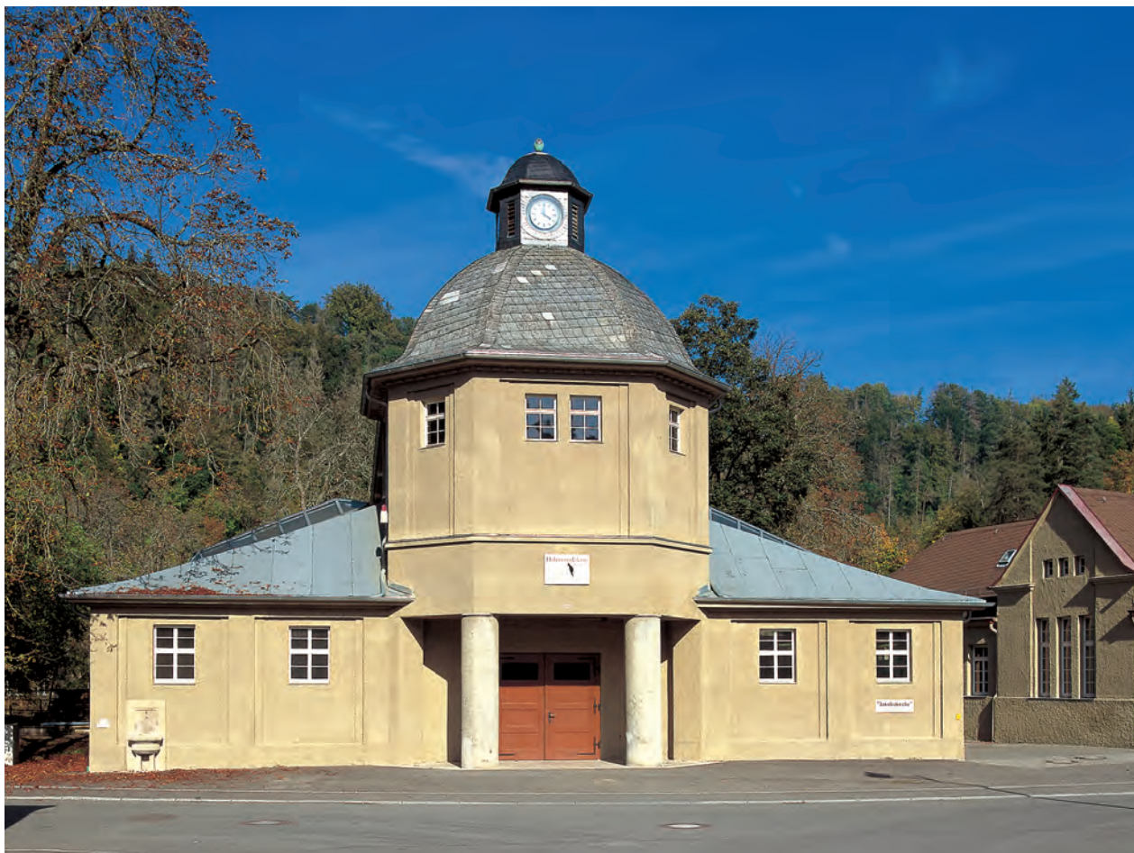
Auch wenn Aussehen und Name anderes vermuten lassen – die «Jakobskirche» diente als Wasch-, Umkleide- und Schlafsaalgebäude für die Arbeiter der Pulverfabrik Rottweil ganz profanen Zwecken. Vorbildlich saniert, ist hier heute die Schreinerei der Holzmanufaktur Rottweil untergebracht.