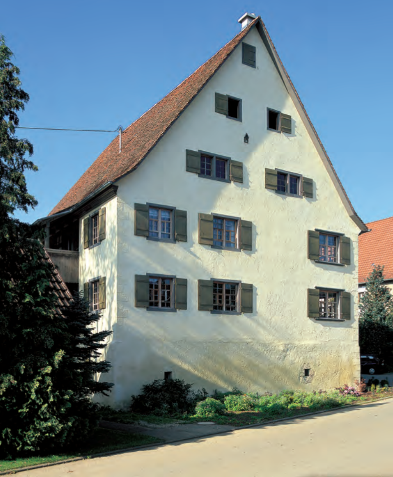
Vogtshof in Hausen ob Verena Kreis Tuttlingen

Der Vogtshof im Ortskern von Hausen ob Verena zählt zu den bedeutenden Bauwerken in der Umgebung von Spaichingen. Es handelt sich um ein für die Region zwischen Alb und Schwarzwald charakteristisches «Quereinhaus», das über einem massiven Sockelgeschoss und zwei Geschossen in Fachwerkbauweise unter seinem durchgehenden Satteldach Wohnteil, Stall und Scheune vereint und von der Längsseite her erschlossen wird.