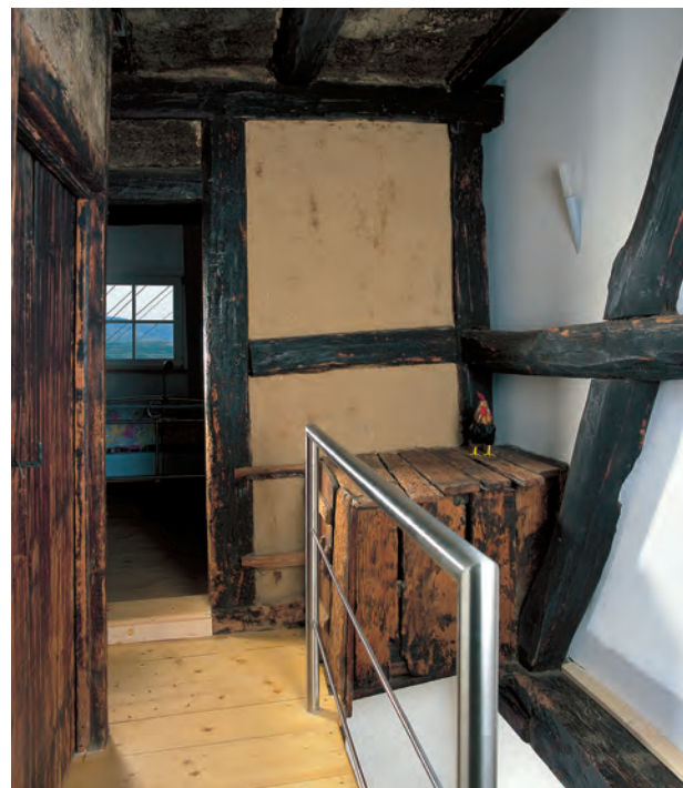
Rußgeschwärzte Balken und Decke sowie ein Holzverschlag für Hühner mitten im Tagelöhnerhaus, Zeugnisse der Lebensweise der früheren Bewohner.

Kleintierstall und Lagerraum im Keller, erschlossen von der Straße über einen vertieften Zugang mit Rundbogen, darüber im Erdgeschoss Küche und Stube sowie der zweigeteilte, von Rauch geschwärzte Dachraum bildeten das nur schwach erhellte Obdach für eine Tagelöhnerfamilie. Von deren kargem Leben erzählen auch die Überbleibsel der Alltagsgegenstände, die in Füllungen zutage kamen: Fragmente grober Schuhe, Scherben einfacher Gebrauchskeramik und schlichter Kachelöfen oder Bruchstücke von Eisen- und Holzgerätschaften. Sorgfältig geborgen und von Valerie Schoenberg wissenschaftlich aufgenommen, sind sie – heute wieder an Ort und Stelle präsentiert – äußerst aussa-