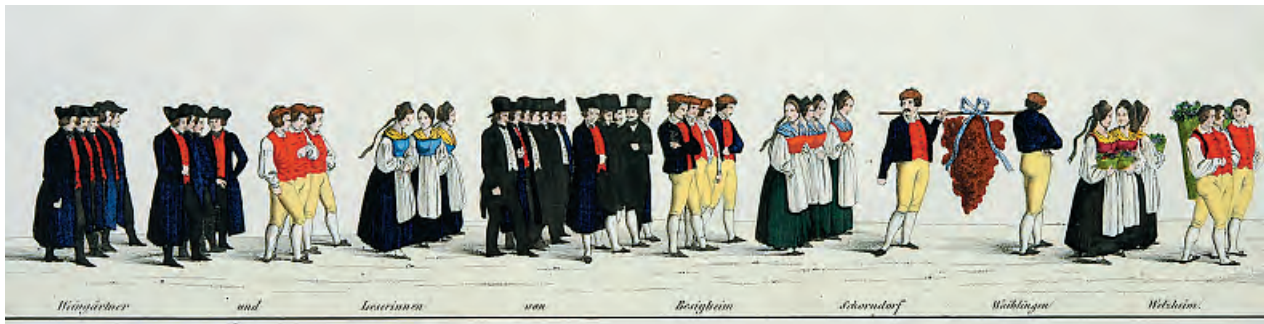
Der große Trauben symbolisiert den Weinbau. Hinter ihm gehen Leserinnen und Weingärtner aus den Oberämtern Besigheim, Schorndorf, Waiblingen und Welzheim.

Bedeutung und Prägekraft sein. In der Analyse solcher Erscheinungs- und Handlungszusammenhänge lassen sich die sozialen, politischen und ökonomischen Strukturen Württembergs in den 1840er-Jahren anschaulich darstellen und man kann zugleich verfolgen, wie soziale (Un-)Gleichheit erlebt und erfahren, wie soziale Distinktion symbolhaft bekräftigt wird.