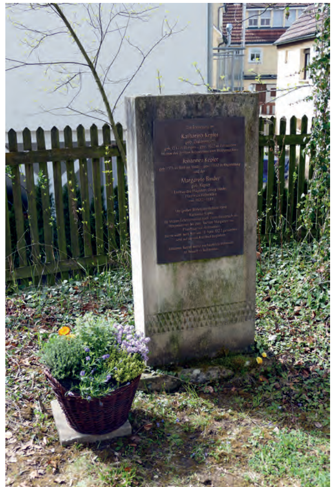
So genannte Kepler-Stein auf dem Kirchhof von Roßwälden, errichtet 2011 vom Stamtisch Heimatkunde, der am 400. Todestag von Katharina Kepler davor einen Korb mit duftenden Kräutern platzierte.