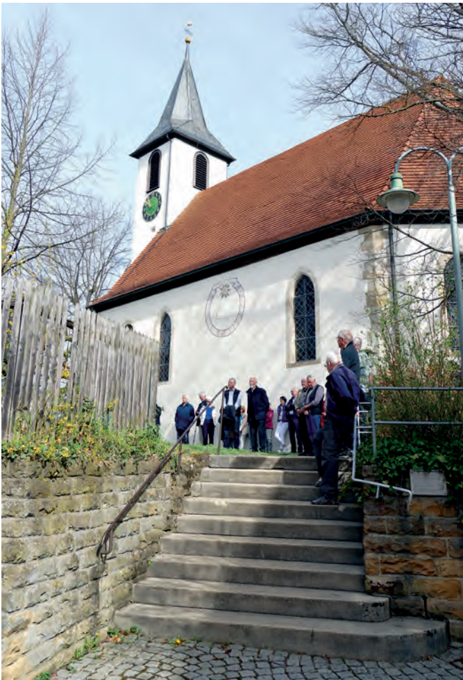
Die Benediktikirche von Roßwälden bei der Gedenkveranstaltung auf dem Kirchhof anlässlich des 400. Todestags von Katharina Kepler. Das spätgotische Kirchlein birgt im Inneren etwas Besonderes: einen siebenneckigen Taufstein. Unten: Das heutige Evangelische Pfarrhaus in Roßwälden stammt aus dem Jahr 1710.