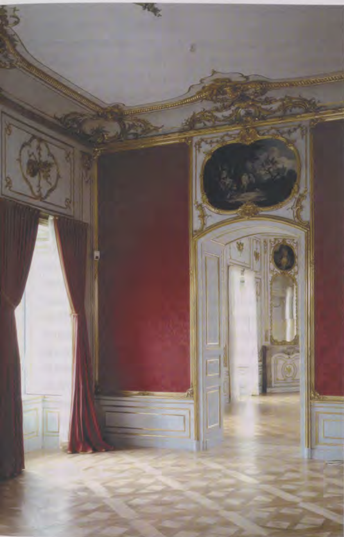
Das restaurierte Assembléezimmer mit seinem eigenartigen Farbspiel hellblau-rot-gold. Das Tafelparkett ist in historischer Technik rekonstruiert.

Nach mehr als 40-jähriger Nutzung durch das Württembergische Landesmuseum, das hier vor allem Ludwigsburger Porzellan präsentierte, wurde das Appartement Herzog Carl Eugens im zweiten Obergeschoss des Ludwigsburger Schlosses in den letzten Jahren restauriert und wird nun der Öffentlichkeit wieder zugänglich. Dieses Appartement ist das einzige authentische Zeugnis der von Frankreich ausgehenden und für ganz Europa Vorbild gebenden Raumkunst des ausgehenden Rokoko, das sich im Ludwigsburger Schloss erhalten hat. Von 1757 bis 1760 schuf der an der Pariser Académie d'architecture geschulte Architekt Philippe de La Guèpière