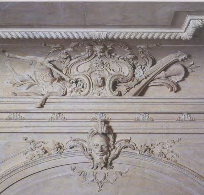
Im Vestibül wird die Musik thematisiert. Stukkateur Ludovico Bossi fand eine eigenwillige Interpretation der volkstümlichen Sackpfeife oder des Dudelsacks.

Unten rechts: Im ersten Kabinett war 1760 eine Wandbespannung aus «weiße pequin peintes», einem kostbaren Seidenstoff, angebracht. Nach dem Vorbild einer solchen im Riesenbau erhaltenen Tapete bemalten Künstler aus der Ludwigsburger Porzellanmanufaktur nun neue Stoffbahnen. Damit wird der ursprüngliche Raumeindruck des Kabinetts wieder erlebbar.