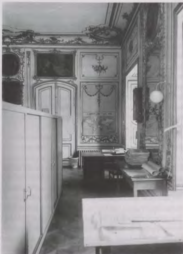
Im Jahr 1934 bezog das Technische Landesamt das Appartement Carl Eugens. Das 1944 aufgenommene Foto des zweiten Vorzimmers zeigt, wie lieblos man damals mit der wertvollen Originalsubstanz umging.

Doch schon nach wenigen Jahren begann man damit, die Räume sukzessive wieder ihrer kostbaren Ausstattung zu berauben, – dies belegen die Schlossinventare von 1767 und 1788. In den 1770er Jahren hielt sich Carl Eugen immer seltener im Ludwigsburger Schloss auf, 1775 wurde die Residenz sogar wieder offiziell nach Stuttgart verlegt. Das herzogli-