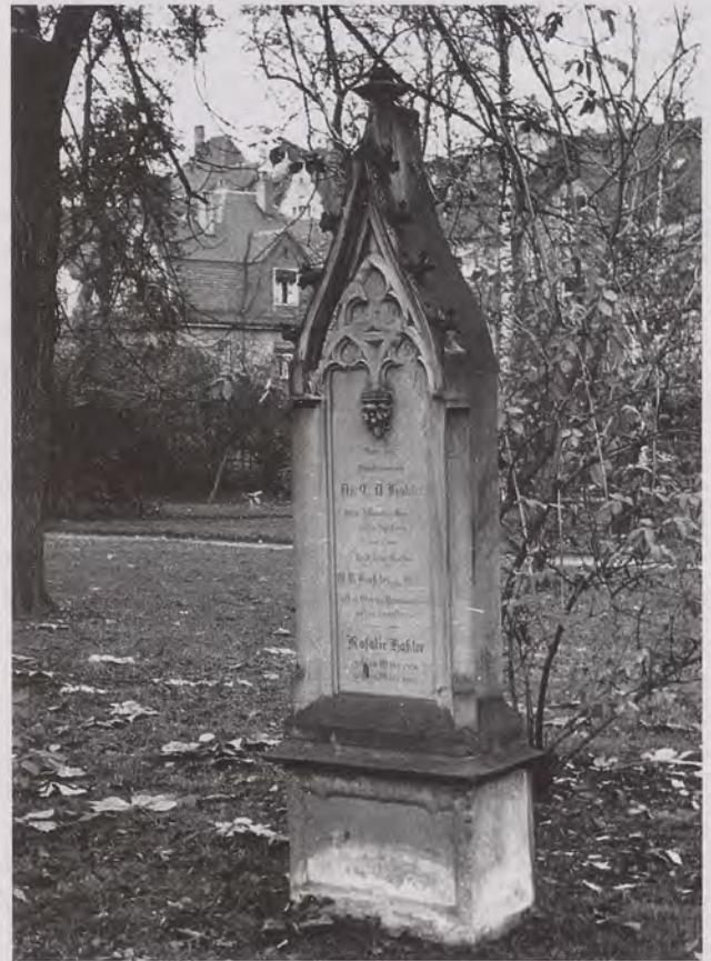
Grab Konrad Dieterich Haßlers auf dem Ulmer Alten Friedhof, im Jahr 1959. 1962 wurde der neugotische Grabstein entfernt und durch eine Grabplatte ersetzt.

Stuttgart war Haßler auch als Sitz einer Sammlung der Kunst- und Altertumsdenkmale wichtig, unabhängig von der Staatlichen Kunstsammlung, die in der Landeshauptstadt schon bestand. In vielen Gesprächen und in seinen dem Ministerium vorzu-