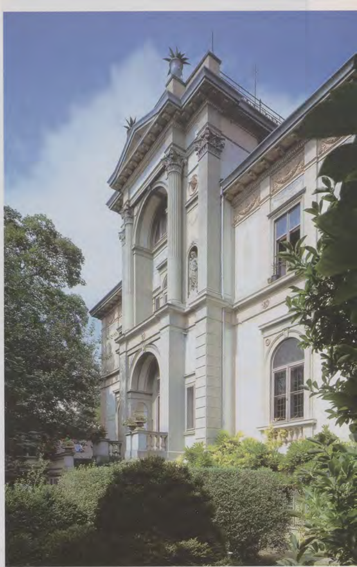
Die Straßenansicht der Stadtvilla gibt sich klassizistisch streng. Überraschender Schmuck am Giebel sind die metallenen Agaven, die die Verbundenheit der Erbauer mit Italien dokumentieren.

Seit 1988 wurde die Villa mit ihrem Garten, der einstmals viel größer das Gebäude umrahmte, in mehreren Bauabschnitten restauriert. Ohne den