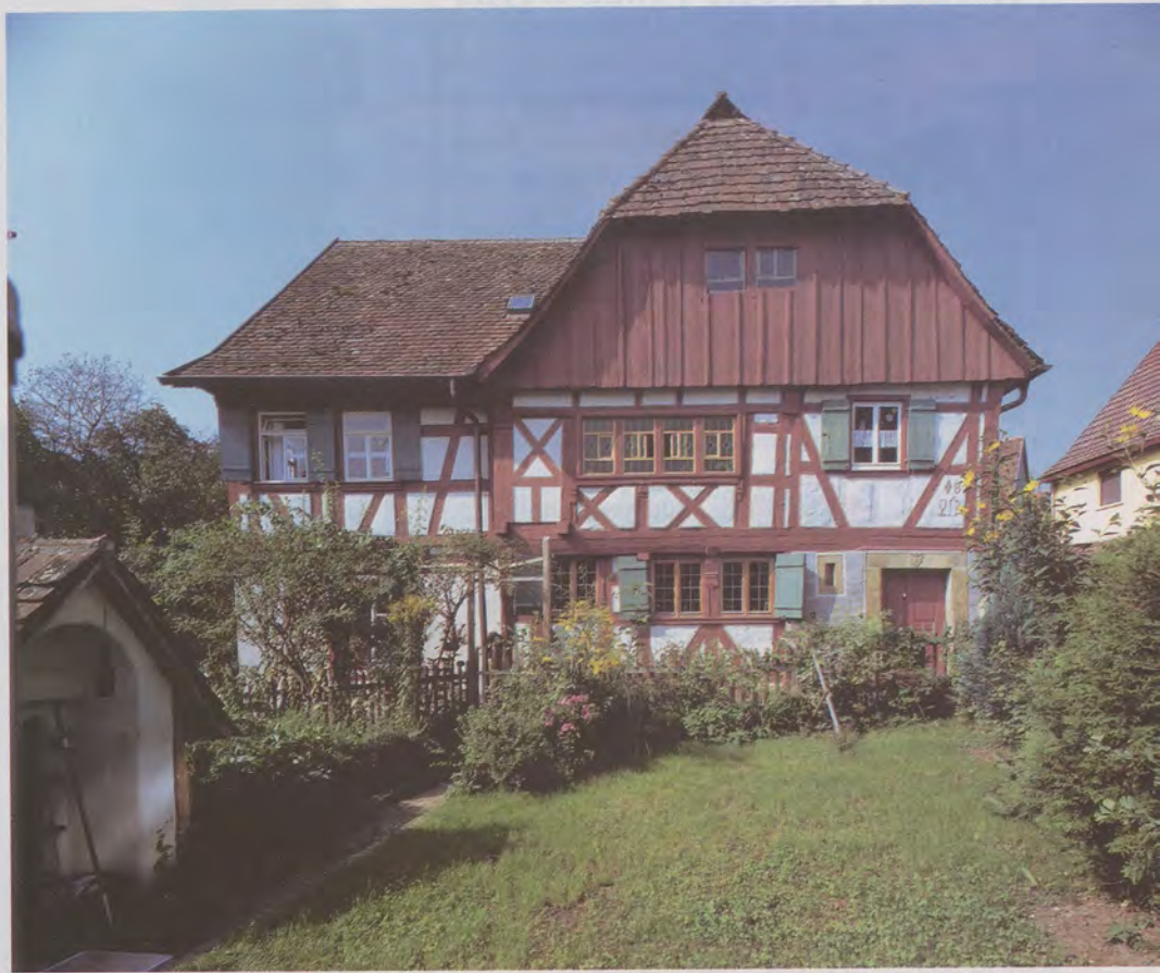
Ehemaliges Dorfwirtshaus in Rosengarten-Tullau, Kirchgasse 10

Die Ansicht des ehemaligen Dorfwirtshauses von Tullau dokumentiert die verschiedenen Bauphasen des Gebäudes mit dem ältesten Teil im Erdgeschoss. Der Eingang in das Wirtshaus und in die Schankkräume bis hin zu den Fenstern im seitlichen Anbau zeigen die Umbauphasen des 19. und 20. Jahrhunderts.