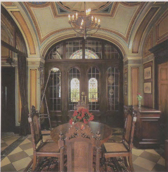
Die Halle im Eingang ist der zentrale Empfangsraum der Villa Baader in Konstanz. Dekorative Bemalung und Möbel stammen aus der Erbauungszeit um 1870.