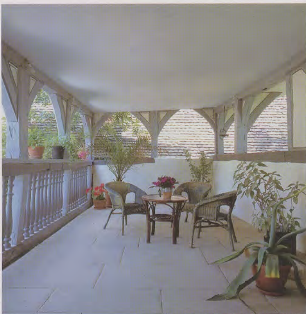
Die restaurierte offene Loggia aus der Zeit der Renaissance vermittelt südländisch anmutendes Flair, wie man es so weit nördlich der Alpen nicht vermuten würde.

geschossige, verputzte Massiv- und Fachwerkgebäude «überspringt» mit seinem Kernbau die Stadtmauer.