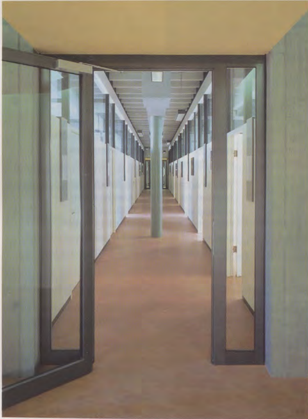
Oben: Die Gestaltung des Haupteingangs zu den Büroräumen bleibt zurückhaltend. Die neuen Elemente des Vordachs und der Eingangstüre fügen sich harmonisch in das historische Erscheinungsbild ein.