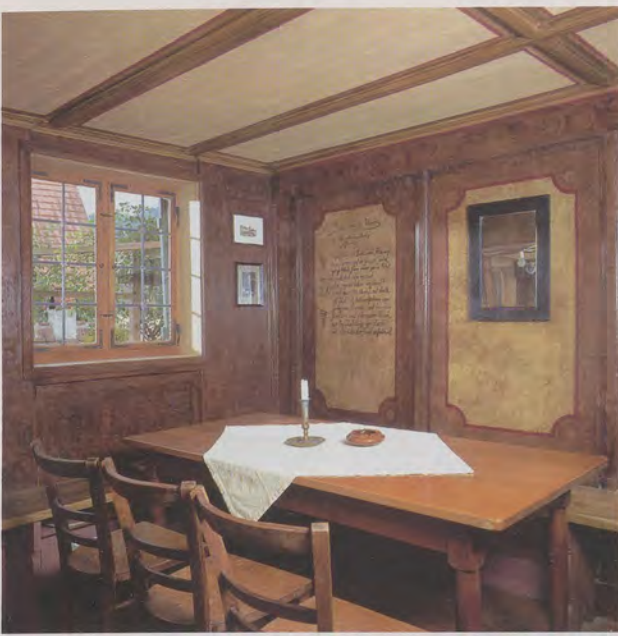
Blick in die wieder hergestellte und restaurierte ehemalige Schankstube des Dorfwirtshauses.

Sie Werte schützen - Werte erhalten haben die Immobilie.