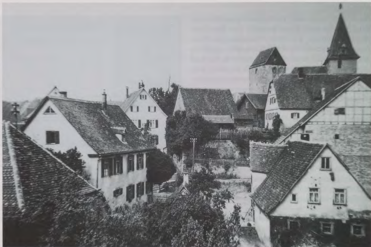
Wildentierbach oberhalb von Niederstetten, aufgenommen im Jahr 1935.