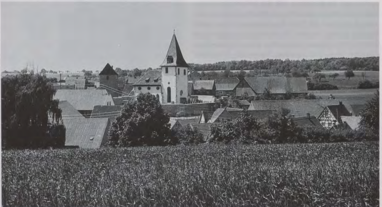
Auf der Hohenloher Ebene duckt sich das Dorf Wildentierbach in eine Mulde. Foto von 1965.

Die Religiosität vieler Hohenloher, auch in meinem Dorf, ist weit mehr von den Vorgängen und den Erscheinungen in der Natur als den Vorstellungen und Vorschriften des christlichen Klerus geprägt. Denn Hohenlohe war und ist seit je Bauernland, wo die Menschen von der Natur abhängig ihren Herrgott mehr draußen als in der Kirche suchten. Dennoch wurde der sonntägliche Kirchgang, vor allem in den ländlichen Bereichen, seit Menschengedenken von den Vätern übernommen und traditionell gepflegt. In der Regel besuchte aus jedem Haus an den Sonn- und Feiertagen zumindest eine Person den Gottesdienst. Doch die Tendenz, dass dieser Brauch auch weiterhin noch gepflegt wird und Bestand hat, ist stark rückläufig, da die nachrückenden Generationen nur noch wenig davon halten. Für die meisten der Jugendlichen endet mit der Konfirmation auch ihr Bezug zur Kirche, denn sie haben und verehren andere Götter.