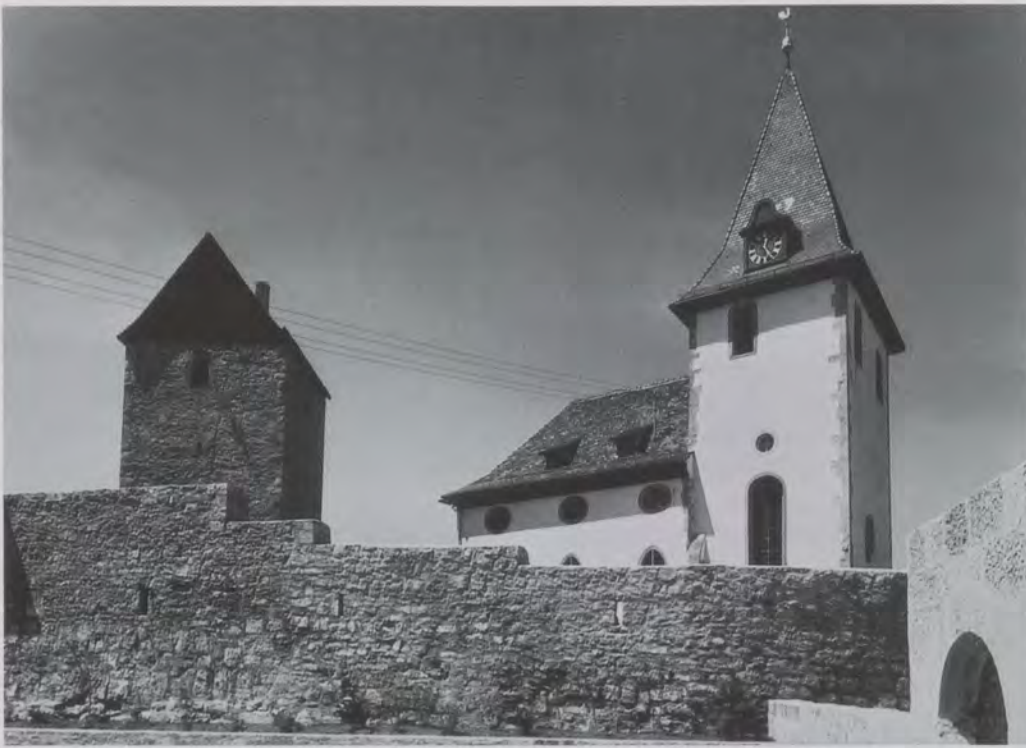
Blick auf die befestigte Marienkirche in Wildentierbach mit der Mauer und dem «Glöcklesturm», dem Torturm.