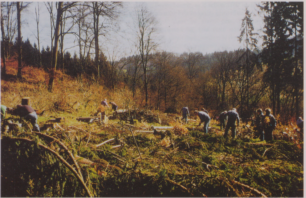
Der Sturm Lothar hat nicht nur im Wald, sondern auch auf angrenzenden Grundstücken Schäden angerichtet. Hier räumen Albvereiner Sturmholz an einem Pflanzenstandort am Waldtrauf weg.