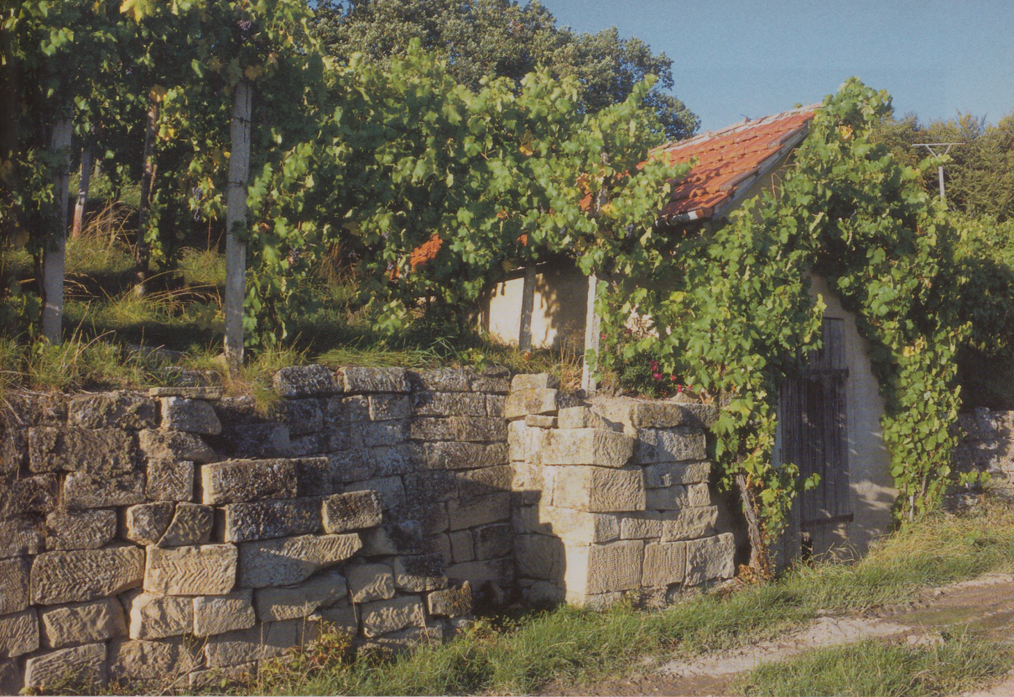
Ein schwäbischer «Mäuerles-Wengert» mit Wengerter-Häuschen im Enztal.