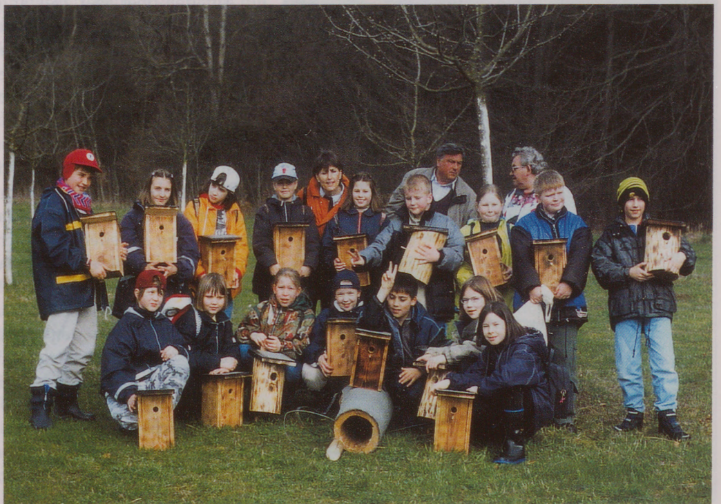
Nistkastenbau ist bei Jugendlichen sehr beliebt. Durch Pflege und Beobachtung des selbstgebastelten Kastens lernt man die heimische Vogelwelt am besten kennen.

Auch in Herrlingen, zur Gemeinde Blaustein (Alb-Donau-Kreis) gehörend, ist es die Albvereins-Ortsgruppe, die ein großes Engagement bei der Pflege von Natur und Landschaft der Umgebung an den