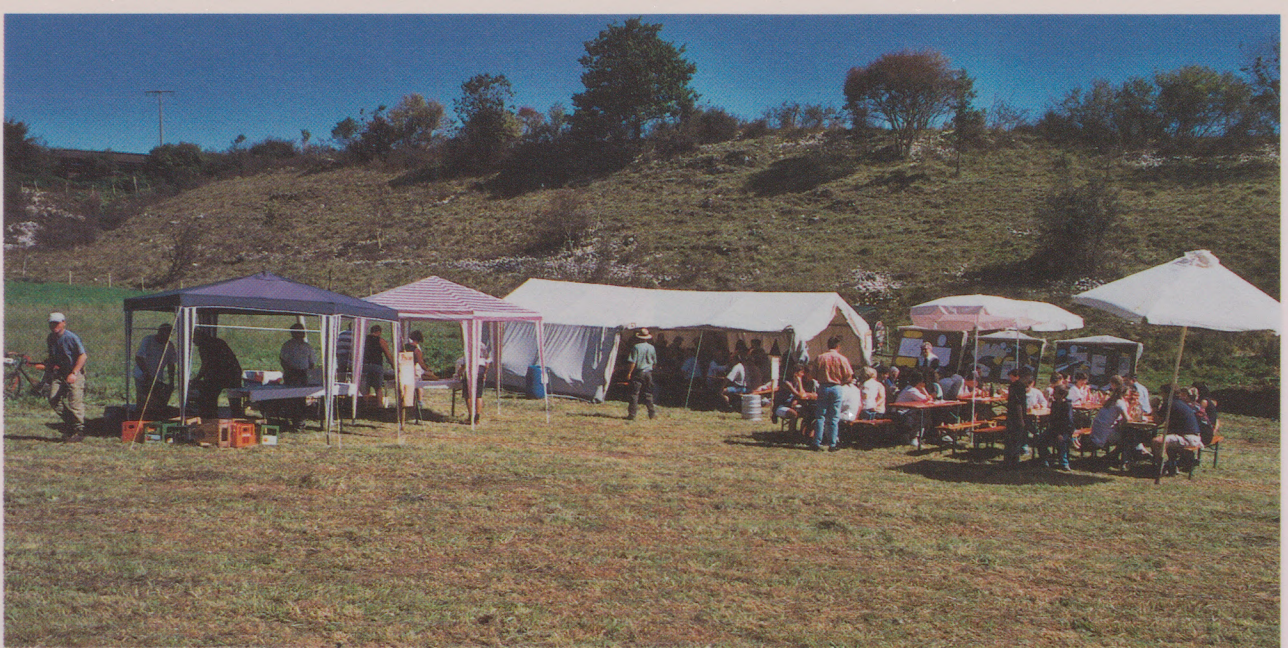
Beim Heidefest auf der Harthäuser Heide unweit von Winterlingen konnte sich die interessierte Öffentlichkeit ein anschauliches Bild von beweideten und unbeweideten Trockenrasen machen.

Arbeiten aufgrund fehlender Unterstützung bei der Bevölkerung zunächst recht schwierig; Akzeptanz und schließlich vereinzelte Unterstützung ergaben sich erst, als mit der Zeit Erfolge sichtbar wurden.