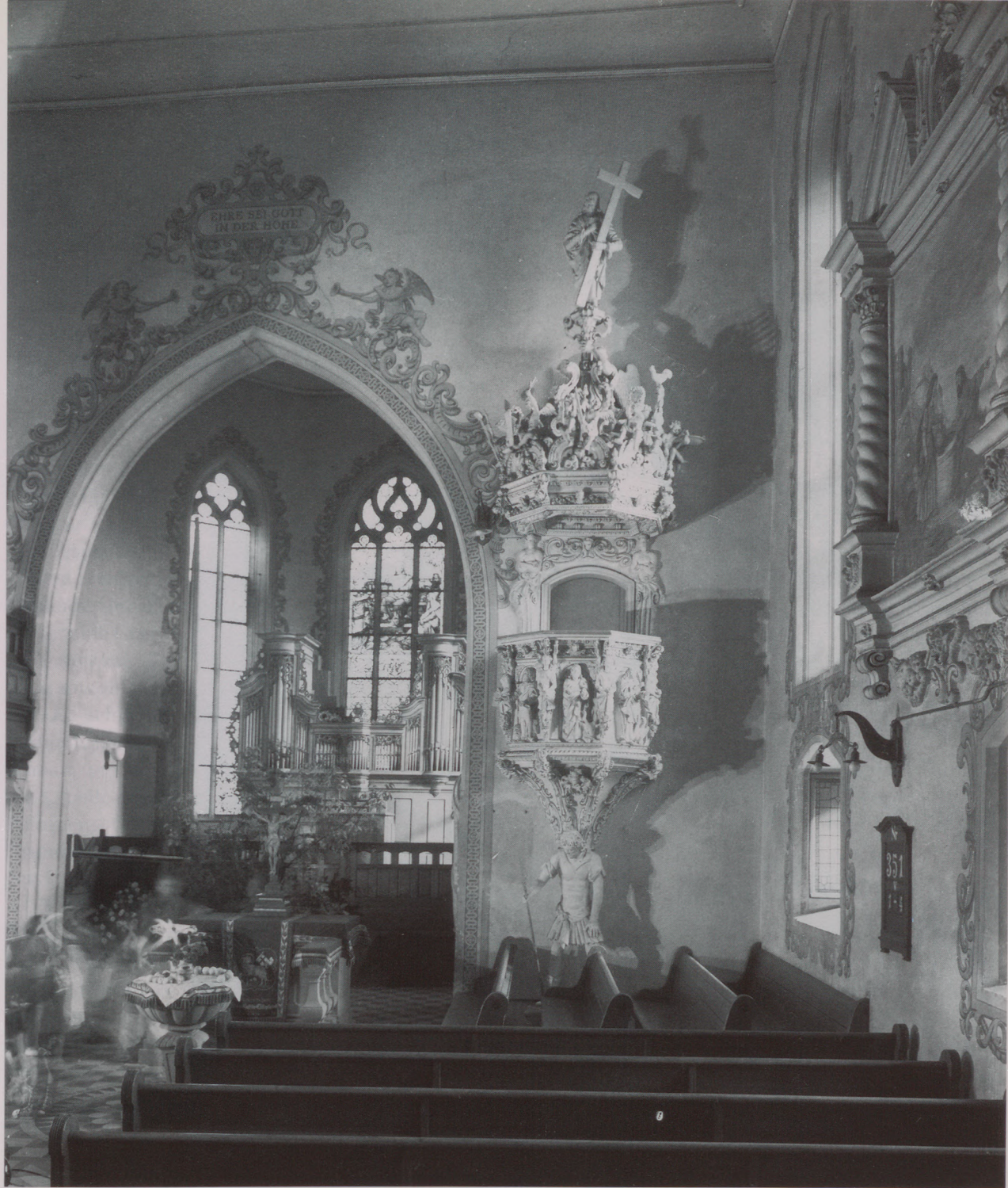
Das Innere der Waiblinger Nikolauskirche mit der als theologisches Programm gestalteten Kanzel. Ein frühbarockes Kunstwerk in einem evangelischen Kirchenraum.

Kanzeldeckel, und die nur halbbekleideten Karyatiden, die das Brüstungsgesims des Kanzelkorbs tragen – was sagen diese üppigen nackten Frauen- und Männergestalten? Adolf Schahl, der große Kenner, hat geschrieben, man gehe sicher nicht fehl, wenn man diese Figuren als Verkörperung der erlösten Natur, der neuen Schöpfung ansehe. 2 Dieser Deutung kann man sich auch heute noch voll und ganz anschließen; man sollte nur noch anfügen, dass diese Zeichen und Abbilder üppigen Lebens zugleich auch (und beide