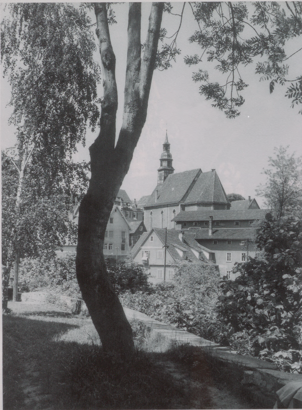
Blick auf die Waiblinger Altstadt mit der Nikolauskirche. Aufnahme aus den 1950er Jahren.

Lust der Waiblinger zeugt von Akzeptanz und Identifikation. Doch während das Geld zusammengetragen wurde (seit 1674 also), wurde anderswo der Anfang einer neuen Bewegung markiert. 1675 nämlich veröffentlichte Philipp Jakob Spener seine Pia desideria , das Gründungsprogramm des Pietismus, der später im württembergischen Protestantismus so wirksam werden sollte und bis heute nachwirkt – auch und gerade mit seinen Vorbehalten gegenüber allem Schmuckwerk. Insofern ist die Kanzel der Nikolauskirche Ausdruck einer vorpietistischen evangelischen Frömmigkeit, die genauso zu unserem kulturellen Erbe gehört wie das, was danach