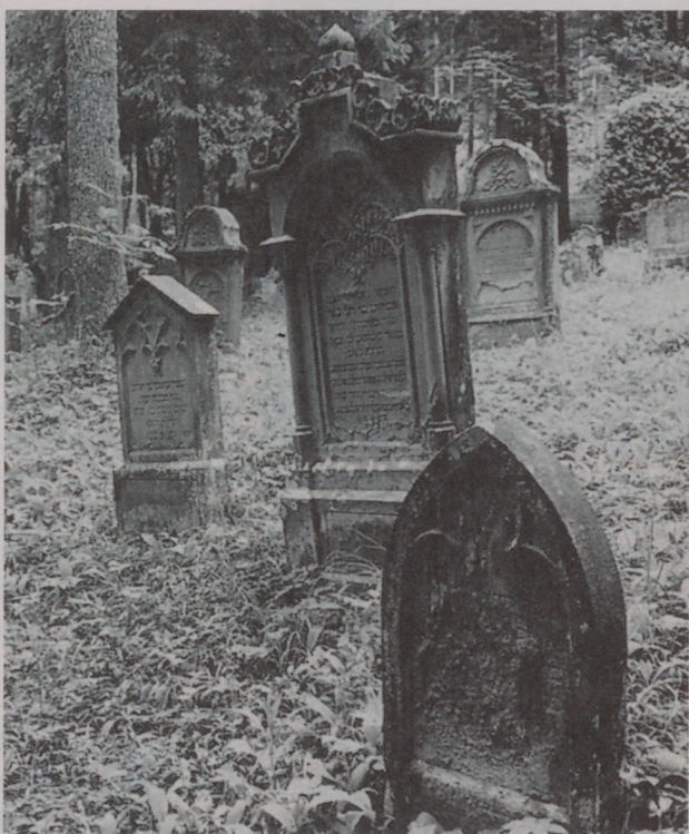
Diese alte Aufnahme zeigt Grabsteine auf dem Judenfriedhof in Horb-Mühlingen.