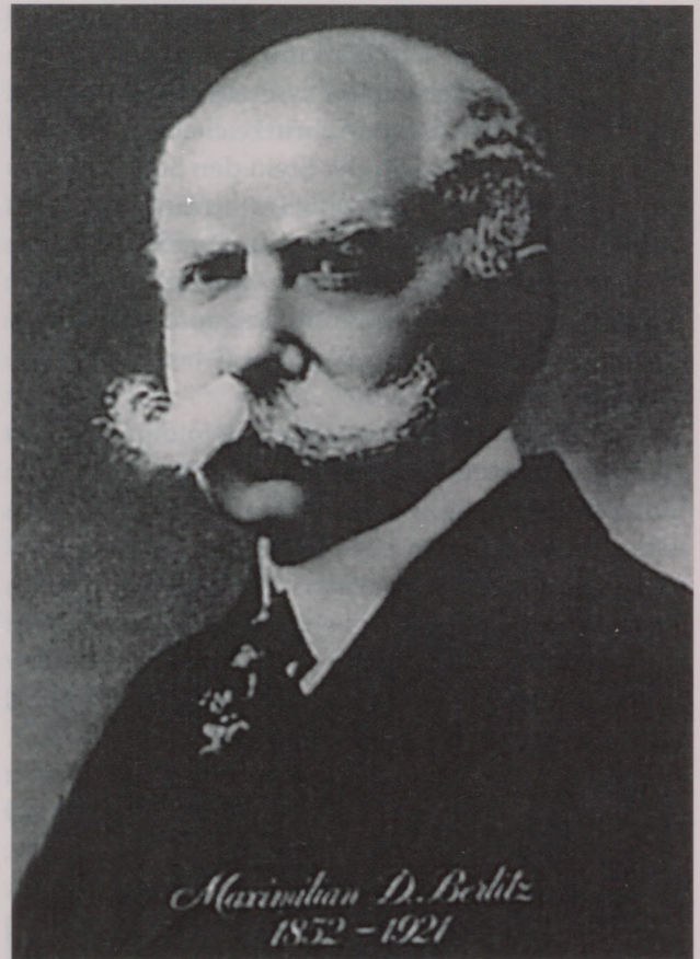
Maximilian D. Berlitz, der erfolgreiche Gründer weltweit verbreiteter Sprachschulen, die mit seinem Namen verbunden sind.

Wer im Brockhaus , bei Meyer's usw. nachschlägt, findet unter «Berlitz» die Information, diese Schule sei gegründet worden von Maximilian D. Berlitz (1852–1921), einem Deutsch-Amerikaner . In der sehr aufwendig gestalteten Chronik von Berlitz International/Princeton zum 120-jährigen Jubiläum wird der Fremdsprachenpionier Maximilian Delphinus Berlitz als Gründer genannt, als Kürzel meist «MDB».