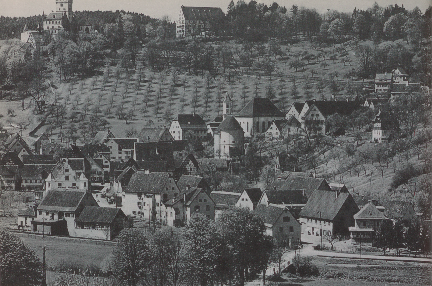
Mühlingen im Eyachtal. Das alte Foto zeigt oben das Schloss Hohenmühlingen, in der Bildmitte rechts neben der Kirche die 1807–10 erbaute Synagoge, die 1938 verwüstet und 1960 abgerissen wurde.

Dörfern und Kleinstädten im ländlichen Württemberg ihr bescheidenes Leben einrichteten. Aus der Geschichte ihrer eigenen Familie macht sie eine sprudelnde Quelle zur lokalen und regionalen Geschichte der Juden, die viel Verständnis vermittelt und übertragbar ist auf die Beziehungen bzw. Nicht-Beziehungen zwischen Christen und Israeliten, über den tatsächlich unternommenen und letztlich doch nicht geglückten Versuch einer «Symbiose», einer «Assimilierung». Sie belegt und belebt ihre Familiengeschichte, die freilich auf diesem Weg sehr viel Allgemeingültigkeit bekommt, mit einer Fülle von Details aus Gemeinderatsprotokollen, Steuerlisten, Eheverträgen, Testamenten, aus Gerichtsnotizen, Familienregistern, Verträgen für Rabbiner (= Vorsänger und Lehrer), mit Hinweisen auf württembergische Gesetze zur Rechtsgeschichte der Juden, mit Auswanderungslisten. Und Emily C. Rose kennt offensichtlich bestens die «Dorfgeschichten» von Berthold Auerbach.