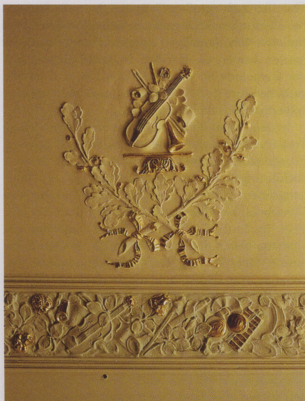
OchsenSaal in Neuhausen/Fildern: Stukkaturen aus dem «Sängerstübli».

Legt man die damalige Größe Neuhausens sowie die Wirtschafts- und Finanzkraft seiner Einwohner zugrunde, so ist der OchsenSaal in bezug auf seine Dimension und künstlerische Ausstattung Ausdruck bürgerlichen Selbstbewußtseins. Die verwendeten Stilelemente aus dem Klassizismus und Jugendstil hat man aus der bürgerlichen Wohnkultur in einen Fest- und Theatersaal umgesetzt. Das Nebeneinander verschiedener Stilrichtungen kann nicht als Zeichen mangelnden Stilempfindens interpretiert werden – im Gegenteil! Gerade um die Jahrhundertwende war es üblich, Räume eklektizistisch zu gestalten.