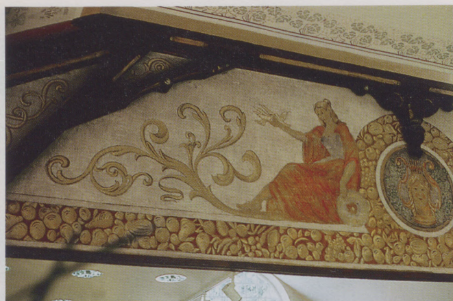
Gemälde über der ehemaligen Theaterbühne mit allegorischen Darstellungen.

ten stellt Weinlaub mit Getreideähren dar; in der Schräge haben wir florale Verzierungen – oberes Feld – und Weinlaubmalereien in den Deckenfeldern über der Galerie. Diese stilisierten Ornamente sind charakteristisch für die Jugendstilmalerei. Innerhalb der zu dekorierenden Flächen finden sich wenige, großformatige Pflanzengebilde, die sich schattenlos in der Fläche ausbreiten unter möglichst weitgehendem Verzicht auf Raumillusion und plastische Wirkung. Aufgrund von Restbefunden konnten diese Deckenmalereien rekonstruiert werden.