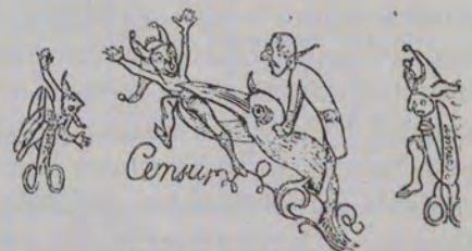
(Unvollständig wegen Censurstrichen.)

«Einst träumt ich einen bunten Traum» – Paul Pfizer, Justinus und Theobald Kerner