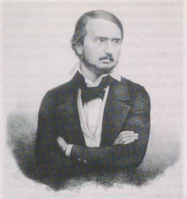
Der Dichter Georg Herwegh (1817–1875) stritt mit «Gedichte eines Lebendigen» für Freiheit und Vaterland.

Ähnlich «typisch schwäbisch», d.h. im Zickzack zwischen sowohl als auch verläuft der Lebensweg von Wilhelm Zimmermann (1807–1878), der im