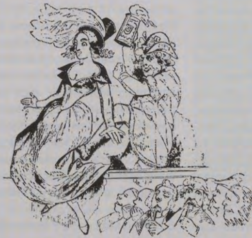
Wie die Erhöbete weiter pufft wird.