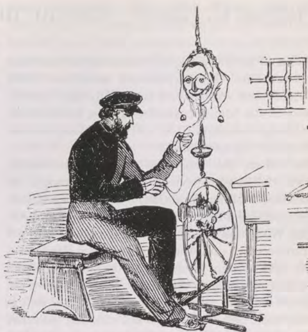
Ludwig Pfau im Zuchthaus; er sitzt am Spinnrad, an dessen Spindel ein Eulenspiegelkopf grinst. So sah ihn die satirische Zeitschrift «Laterne». In Wirklichkeit war er – zu 21 Jahren Zuchthaus verurteilt – in die Schweiz geflohen. Nach der Amnestie kehrte Ludwig Pfau 1863 nach Stuttgart zurück.