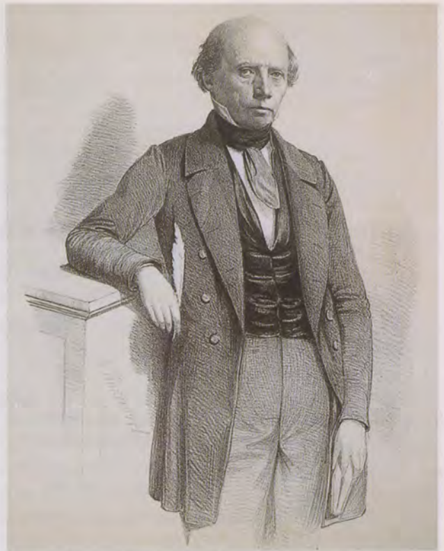
Ludwig Uhland (1787–1862), Dichter und Professor für deutsche Sprache und Literatur in Tübingen, Abgeordneter im Stuttgarter Landtag, Delegierter in der Frankfurter Nationalversammlung.

Gewiß, die Situation in Württemberg unter König Wilhelm I. (1816–1864) war im Revolutionsjahr 1848 eine andere als im benachbarten Baden unter Großherzog Leopold (1830–1852), dessen «große Liberalität» zwar auch weitgehend erzwungen war, aber eher aus Unentschlossenheit und Ängstlichkeit resultierte, und der am Ende keinen anderen Ausweg mehr sah, als sich unter den Schutz preussischer Truppen zu flüchten. Das blieb den Württembergern erspart, ein heimlicher Triumph sowohl für den König als auch für die Märzregierung, die freilich wenig später, nachdem der Mohr seine Schuldigkeit getan hatte, am 28. Oktober 1849 gehen mußte.