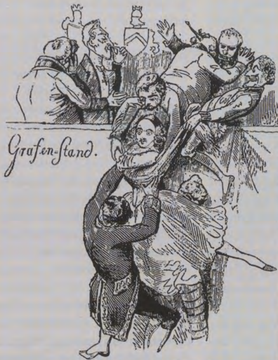
Wie man das Volk zu heben sucht.

(ein von der „Allgemeinen“ und dem „Schwäbischen Merkur“ erfundener Titel).