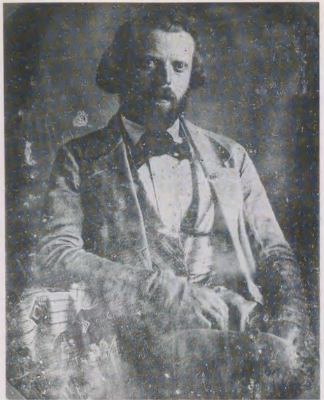
Ludwig Pfau (1821–1894), vielseitiger Lyriker und Kritiker. 1848 gründete er den «Eulenspiegel», die erste deutsche Zeitschrift politisch-karikaturistischen Inhalts. Sein «Badisches Wiegenlied» bezeugt seine Preußenfeindschaft und ist rasch sehr populär geworden.

Unverkennbar ist die revolutionäre Glut Herweghs gespeist von der religiösen Inbrunst des Theologen, der sein Studium abgebrochen hat. Der von kirchlicher und staatlicher Seite verhinderte Pfarrer predigt als Freiheits-Apostel und Vaterlands-Erwecker und sieht sich plötzlich – durch die Feiern und Ehrungen, mit denen er in ganz Deutschland überhäuft wird – tatsächlich in die Rolle eines politischen Messias gedrängt, die er zuvor als Dichter bereits in Anspruch genommen hatte. Das entsprechende Gedicht trägt den Titel Der Freiheit eine