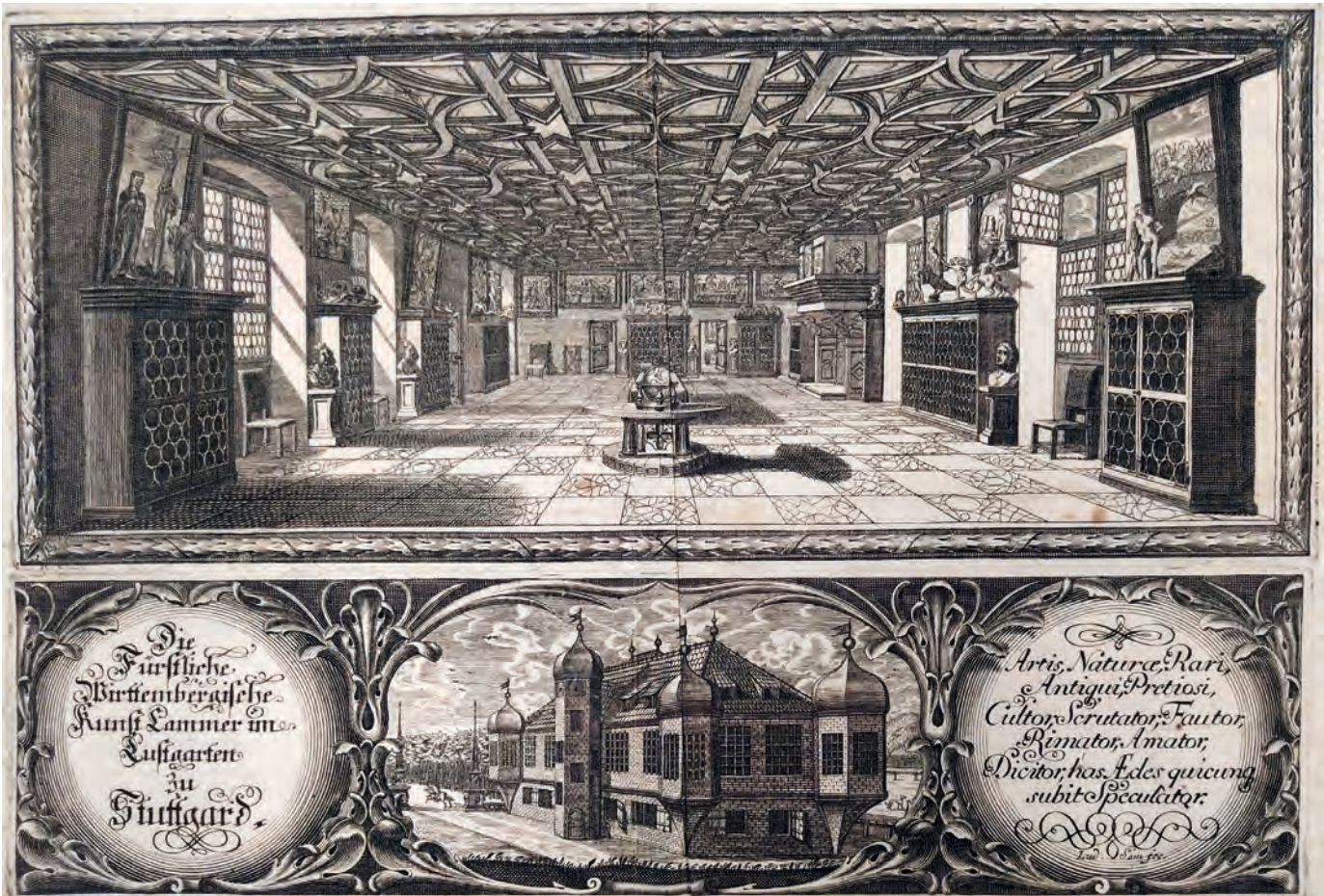
Ludwig Som: Württembergische Kunstammer im Lustgarten zu Stuttgart, 1704, Kupferstich, 31,6 x 40 cm

gen verzichtete. Neueste Forschungen beweisen nun jedoch eindeutig, dass die Staatsgalerie mehr als ein Gemälde von Rubens ihr Eigen nennen kann. Die von Rubens geschaffene Kopfstudie befindet sich bereits seit 1736 in württembergischem Besitz, weshalb hier zum einen der Frage nachgegangen wird, wie dieses Gemälde in die württembergischen Kunstsammlungen gelangte. Zum anderen untersucht der Beitrag, welches Interesse die Herzöge den Gemälden von Rubens im Laufe des 17. und 18. Jahrhunderts entgegenbrachten.