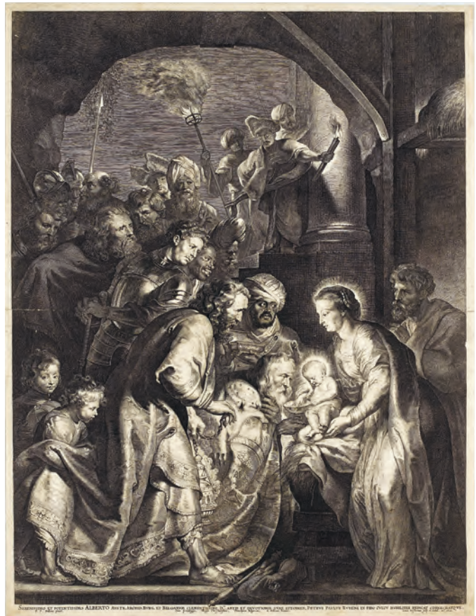
Lucas Vorsterman nach Peter Paul Rubens: Die Anbetung der Könige, 1620, Kupferstich auf rohweißem Büttenpapier, 580 x 440 mm