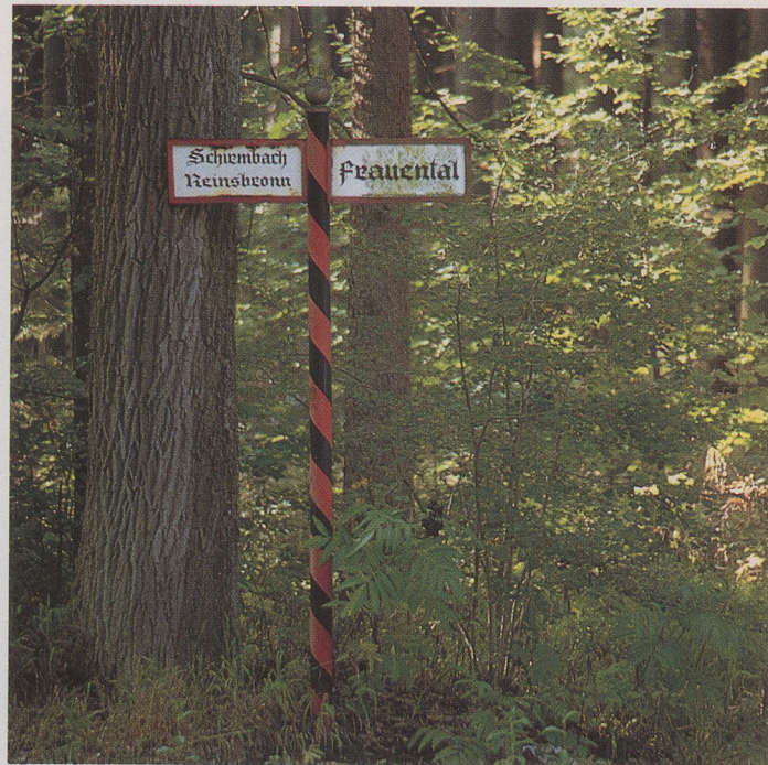
Im 19. Jahrhundert wurde der einst als Mittelwald bewirtschaftete Klosterwald durch die württembergische Forstverwaltung in einen laubholzreichen Hochwald überführt.

Im Mai 1990 wurde in der renovierten Oberkirche des ehemaligen Zisterzienserinnenklosters Frauental eine Dauerausstellung mit dem programmatischen Titel «Vom Kloster zum Dorf» eröffnet. Sie erfreut sich seither trotz der etwas abseitigen Lage Frauental's eines regen Interesses bei Laien (1995 ca. 2500 Besucher) und Fachleuten 5 . Neben Zielsetzungen theologisch-geistesgeschichtlicher, volkskundlicher und baugeschichtlicher Art verfolgt die Ausstellung das Ziel, exemplarisch für das südliche Mainfranken die Zusammenhänge von sozialen, ökonomischen, geistigen und politischen Einflüssen und Wechselwirkungen auf eine Siedlung und ihre zugehörige Gemarkung aufzuarbeiten und museumsgerecht darzustellen. Die Einlösung dieses