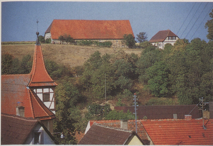
Zeugnis der intensiven klosterzeitlichen Schafhaltung ist die Schafscheuer oberhalb Frauental's; sie wird heute genossenschaftlich genutzt.

Das setzt die Erfassung vorhandener kulturlandschaftlicher Strukturen voraus, um mit diesem Wissen Kulturlandschaften pfleglich zu behandeln, das heißt, mit ihnen aufmerksam und bewußt und fürsorglich umzugehen in Verantwortung für alle in unserer Welt und Zeit. Kulturlandschaftspflege in diesem Sinne ist damit als ein offener und dynamischer Ansatz zum bewußten Umgang mit Kulturlandschaften zu verstehen. Das erfordert ein Denken in Entwicklungsprozessen, dem die Einsicht zugrundeliegt, daß die Wertmaßstäbe dessen, was pfleglich ist, ständig neu definiert werden müssen. Bezogen auf die Entwicklungsdynamik von Landschaften sind dabei Nutzungen, die sich in der Landschaft als reversibel erweisen, nachhaltiger als solche, die zumindest in historischen Dimensionen zu weitreichenden Festlegungen führen. Nutzungen, die die natürlichen und historischen Potentiale eines Raumes erhalten, zeugen somit von einem pfleglicheren Umgang als solche, die markante und großflächige Veränderungen bedingen.