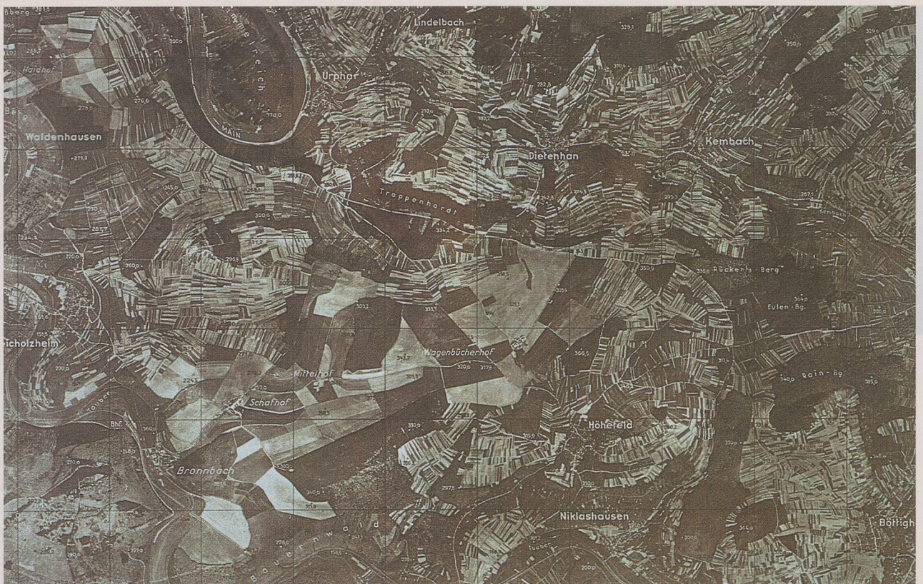
In einem Luftbild von 1937 hebt sich die großparzellierte Gutshofflur des ehemaligen Klosters Bronnbach deutlich aus den Realteilungsfluren der umliegenden Dörfer heraus.

Ansatzes erforderte eine interdisziplinäre Zusammenarbeit in der Planungs- wie Ausführungsphase. Vertreter der Volkskunde, der Theologie und der geographischen Landeskunde arbeiteten mit. Letztere erbrachte folgende Beiträge: