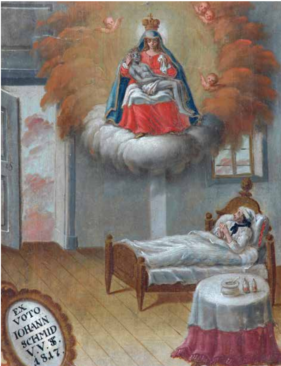
Abb. 6 - Votivbild von 1817 aus der Wallfahrtskirche Maria Deutstetten in Veringstadt mit einem bettlägerigen Kranken zwischen Gnadenbild und Arzneimitteltischchen (KreisA Sigmaringen).

Den hohen Stellenwert des geistlichen Beistands und Trostes angesichts der bescheidenen Möglichkeiten von Medizin und Heilkunde bis weit in das 19. Jahrhundert hinein offenbaren für den katholischen Bereich in besonderem Maße die erhaltenen Votivbilder von Wallfahrtsstätten und anderen Gnadenorten, wo Menschen in Krankheit, bei Unfällen, aber auch Viehseuchen, Brand- und Naturkatastrophen Hilfe und Errettung suchten und bei gutem Ausgang die gefundene Erhörung vielfach in naiven Bildformen dokumentierten 32 . Wenn auf