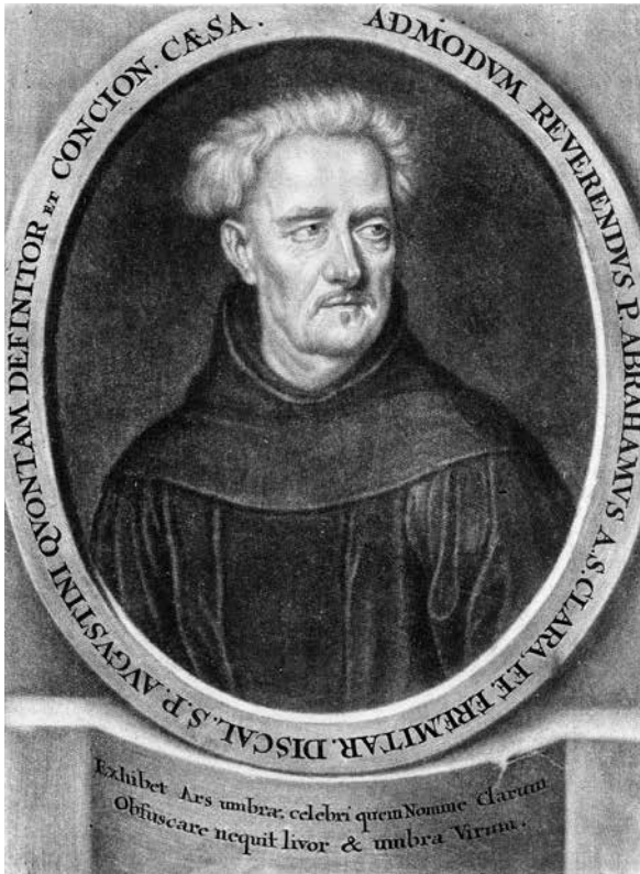
Abb. 1 - Pestautor Abraham a Sancta Clara (1644-1709), Kupferstich (Aus: Geistlicher Kramer-Laden voller apostolischer Wahren und Wahrheiten. 2. Teil. Würzburg 1714).

Pesteinbruchs mit den auf den Gassen liegenden Toten und den durch Leichen blockierten Fuhrwegen, vielmehr dient dem Prediger mit seiner überbordenden barocken Sprachkunst die grausame Seuche in erster Linie als Exempel für ein Memento Mori, für den Verweis auf die Vergänglichkeit und den eitlen Schein des irdischen Daseins und die Mahnung zu Buße und Vorbereitung auf den eigenen Tod. Ohne Sozial- oder gar Elitenkritik verweist auch Abraham a Sancta Clara auf die Flucht zahlreicher Bewohner – mit dem Kaiser und seinem Hof an der Spitze – aus der von Seuche und Tod bedrohten Stadt, als zögen die Leute aus Ägypten in das Gelobte Land, so dass das kurz zuvor noch so belebte und geschäftige Wien in kurzer Zeit nahezu volklos geworden sei 8 (Abb. 1).