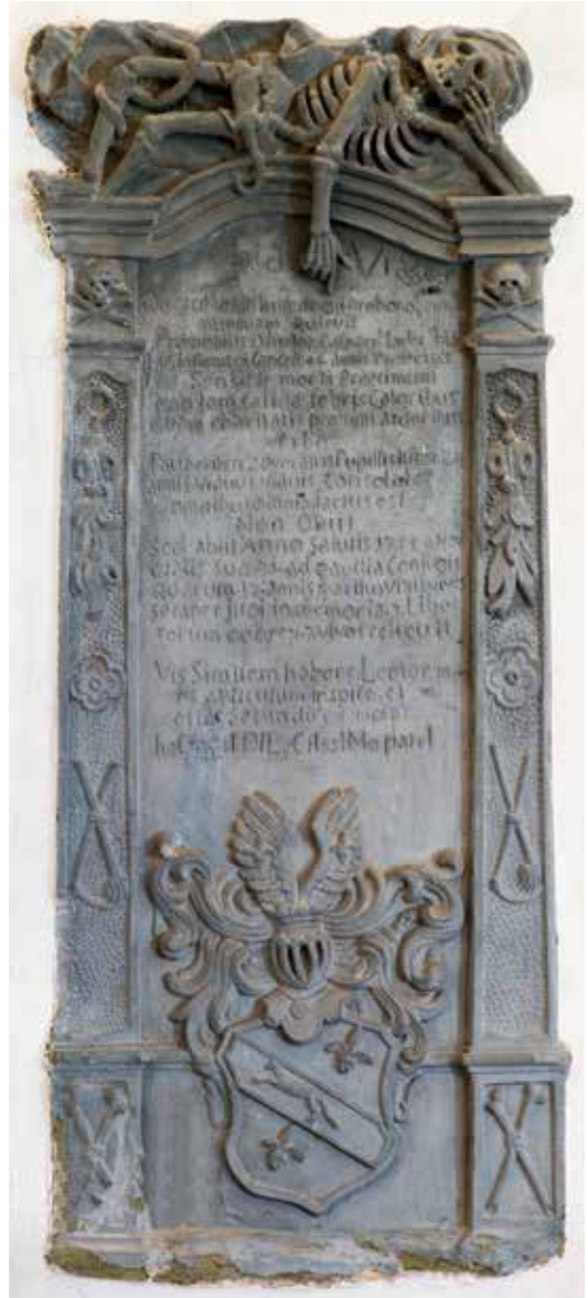
Abb. 5 - Grabmal des 1755 mit 71 Jahren verstorbenen langjährigen Kanzleiverwalters der Reichsstadt Pfullendorf Johann Caspar Mader mit Memento Mori-Symbolen, darunter ein auf die menschliche Sterblichkeit und Vergänglichkeit verweisendes liegendes Skelett nebst Kröte und Schlange (Wurm), Kapelle St. Leonhard Pfullendorf (KreisA Sigmaringen, Foto: Reiner Löbe).