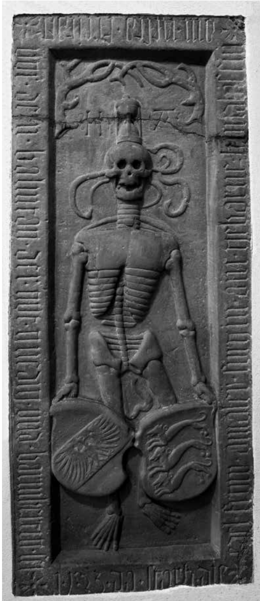
Abb. 4 - Grabmal der 1523 verstorbenen Amalie von Syrgenstein in der Pfarrkirche Krauchenwies mit Darstellung der halbverwesten und von Gewürm zernagten Verstorbenen (Foto: Reiner Löbe).