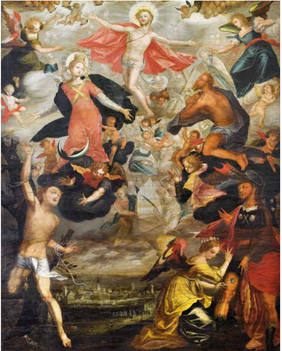
Abb. 8 - Saulgauer Pestbild um 1615 mit Pestheiligen Sebastian und Rochus, Johannes dem Täufer, der Himmelkönigin Maria und schwebendem Christus, unten Darstellung der Stadt Saulgau, Öl auf Holz, 155 x 113 cm (Stadtmuseum Bad Saulgau).

Bei den nachfolgenden Verfolgungen und Ausweisungen der Juden bis zum dauerhaften Ende der großen reichsstädtischen Judengemeinden in Südwestdeutschland in den 1490er Jahren sind nur noch vereinzelt konkrete Bezichtigungen wie etwa die konstruierte Ritualmordbeschuldigung in Ravensburg 1429/30 ursächlich 38 und der gesellschaftliche Krisenhintergrund des 15. Jahrhunderts eher unspezifisch.