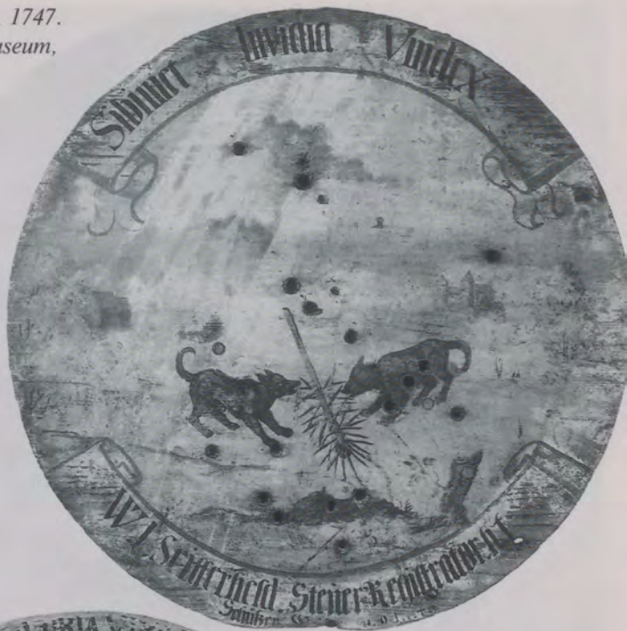
Abb. 1 Schützenscheibe, 1747. Hällisch-Fränkisches Museum, Inv. Nr. 86/143-9