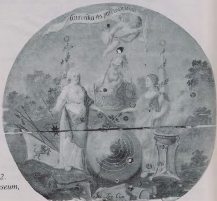
Abb. 6 Schützenscheibe, um 1782. Hällisch-Fränkisches Museum, Inv. Nr. 86/143-54