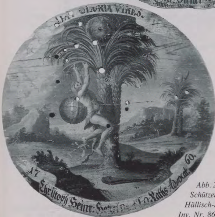
Abb. 2 Schützenscheibe, 1760. Hällisch-Fränkisches Museum, Inv. Nr. 86/143-19