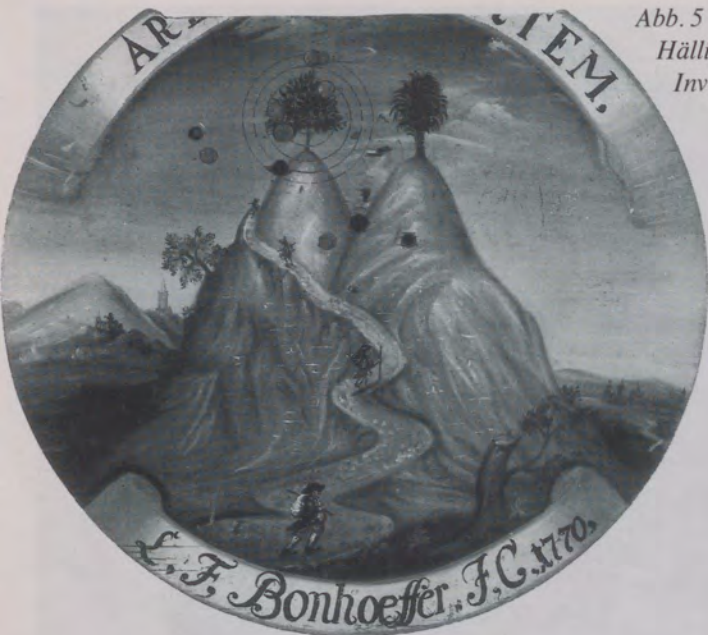
Abb. 5 Schützenscheibe, 1770. Hällisch-Fränkisches Museum, Inv. Nr. 86/143-29