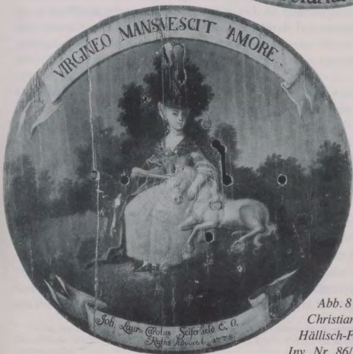
Abb. 8 Schützenscheibe von Christian Andreas Eberlein, 1778 Hällisch-Fränkisches Museum, Inv. Nr. 86/143-44