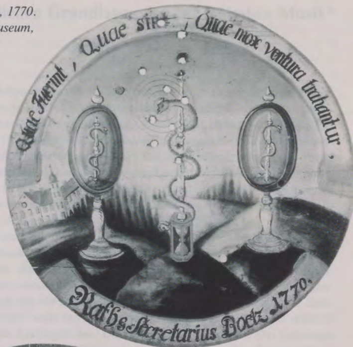
Abb. 7 Schützenscheibe, 1770. Hällisch-Fränkisches Museum, Inv. Nr. 86/143-28