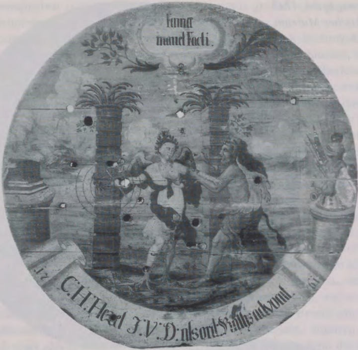
Abb. 3 Schützenscheibe, 1761. Hällisch-Fränkisches Museum, Inv. Nr. 86/143-21