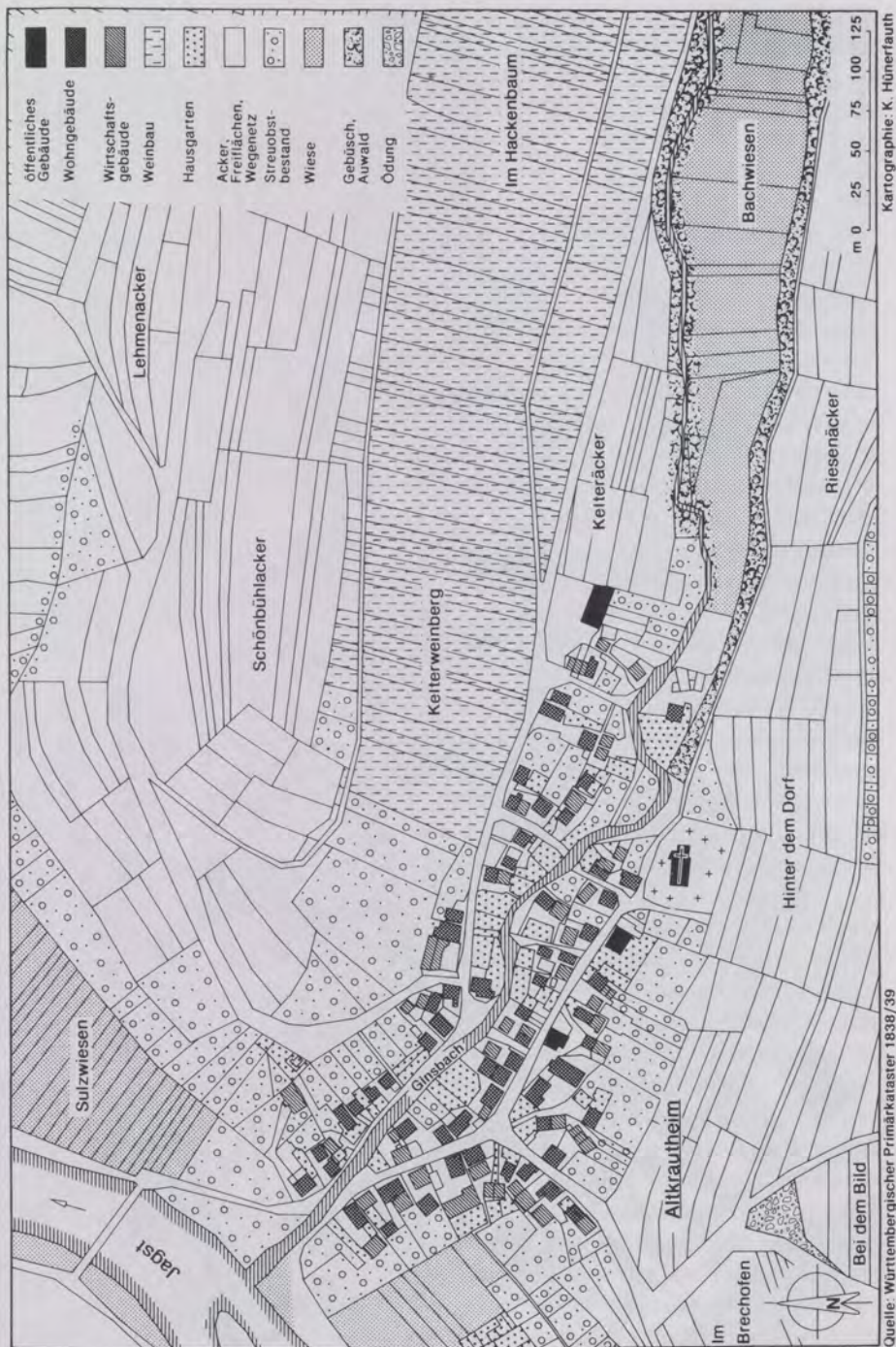
Karte 1 Altkrauthaim – Flächennutzung 1839