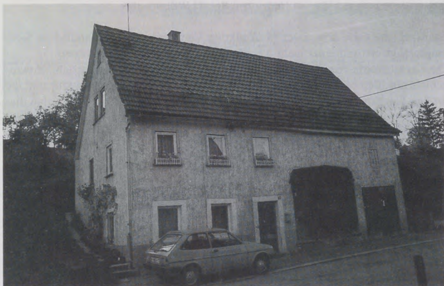
Abb. 1: Einhaus in Oberginsbach