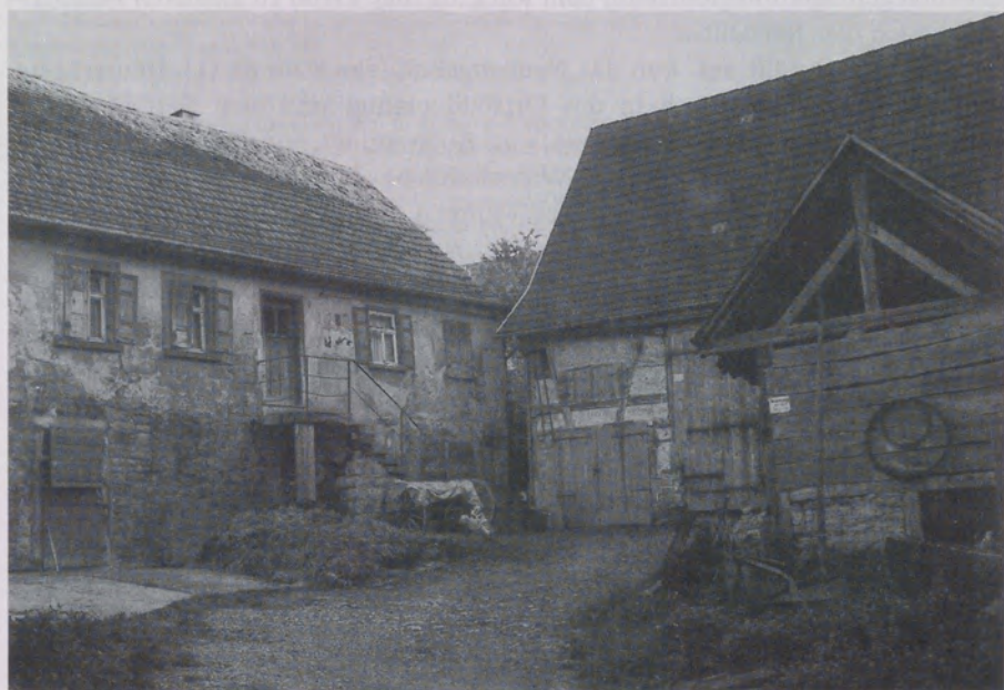
Abb. 2: Dreiseitgehöft in Altkrautheim. Das gestelzte Einhaus beherbergt im gemauerten Erdgeschoß zwei Ställe mit separaten Zugängen. Der Wohnteil im ersten Geschoß ist eine Fachwerkskonstruktion, die sich unter dem Verputz verbirgt. Die Scheune in der Mitte und das Wirtschaftsgebäude auf der rechten Seite stellen eine spätere Erweiterung des Gehöfts dar. Dieses Anwesen mit dem gestelzten Einhaus als Ausgangsform kann als typisches Bauerngehöft im Ginsbachtal bezeichnet werden.