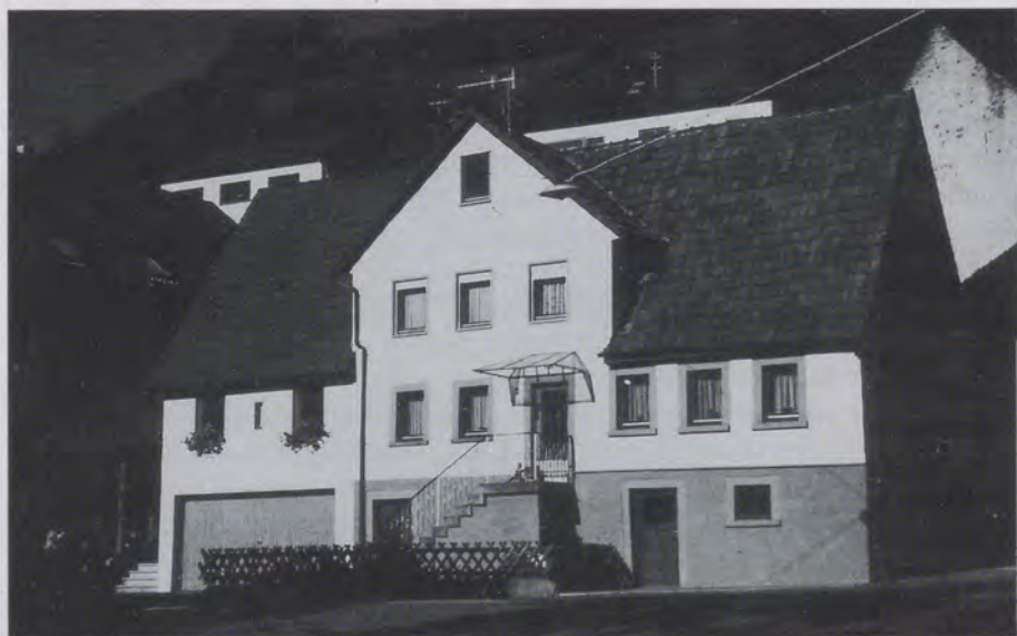
Abb. 4: Renoviertes Fachwerkhäus in Unterginsbach

Die Veränderungen in der Landwirtschaft sind am Siedlungsbild der drei Ginsbachtalgemeinden nicht spurlos vorübergegangen. Es wurde bereits erwähnt, daß das Siedlungsgefüge von Oberginsbach im Gegensatz zu Unterginsbach heute noch am stärksten von der Landwirtschaft geprägt ist. Im Vergleich zu diesen beiden Gemeinden fallen in Altkrautheim Gewerbeansiedlungen auf, die in Ober- und Unterginsbach fast fehlen.