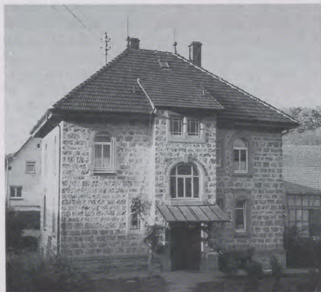
Abb. 3: Pfarrhaus in Oberginsbach

Tabelle 5 weist für Altkrautheim einen recht hohen Bestand alter Gebäude aus, die sich 1989 in einem schlechten Bauzustand befanden (30 %). Genau das Gegenteil trifft für Oberginsbach zu, wo sich 32 % des alten Gebäudebestands in einem guten