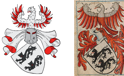
Abb. 8 Stammwappen der Familie von Hohenlohe

Das Geschlecht der Hohenlohe spielt in der deutschen Geschichte seit dem Mittelalter eine nicht unwesentliche Rolle. Dies muss an dieser Stelle nicht in allen Einzelheiten erläutert werden 23 . Seit 1207 erscheint die Familie mit dem Namen Hohenlohe bzw. de Hohenloch . Ursprünglich eng angelehnt an die Staufer, baute sie nach deren Ende in Franken eine umfangreiche Territorialherrschaft aus. Seit den 1230er Jahren führte sie die zwei schwarzen Leoparden in silbernem Feld als Wappen. Es wurde später als Stammwappen noch um Helm, Adler und Helmdecken erweitert. Außer als Territorialherren erscheinen verschiedene Hohenlohe im 13. bis 15. Jahrhundert in führenden kirchlichen Ämtern, wiederholt als Bischöfe von Würzburg und Bamberg und als Deutschordensherren, teilweise sogar als Hochmeister des Ordens. Dabei waren Vertreter des Hauses im 13. Jahrhundert in Palästina, im 13. bis 15. Jahrhundert auch in den preußischen Ordensländern tätig. 1450 erhob Kaiser Friedrich III. die Herren von Hohenlohe in den Grafenstand.