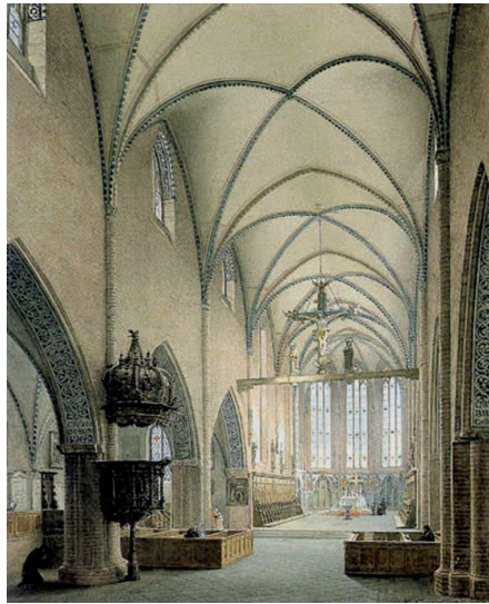
Abb. 5 Eduard Gärtner: Inneres der Klosterkirche Berlin, 1844 (Aquarell im Besitz der Staatlichen Schlösser und Gärten Berlin-Brandenburg)