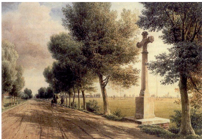
Abb. 1 Eduard Gärtner: Das Kreuz am Kremmer Damm, 1848 (Aquarell im Besitz der Staatlichen Schlösser und Gärten Berlin-Brandenburg)