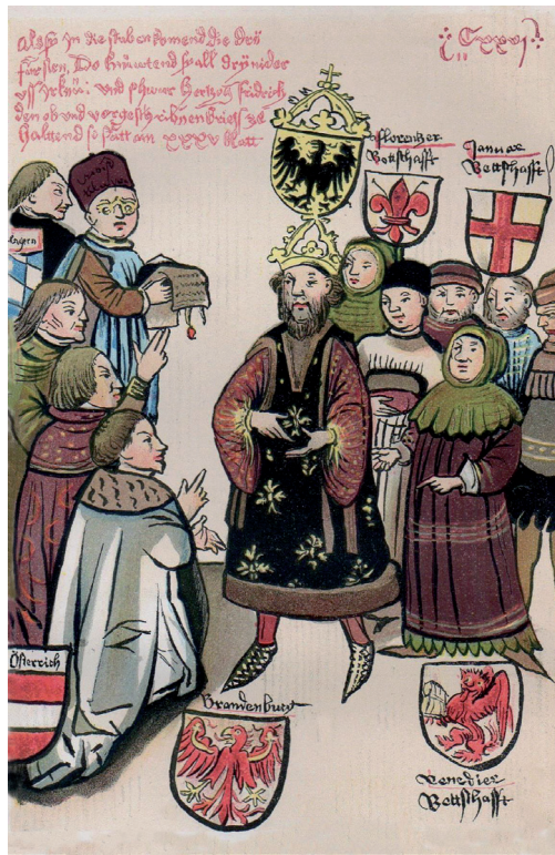
Abb. 3 Belehnung Friedrichs durch König Sigmund mit der Mark Brandenburg (Konstanzer Handschrift / Universität Prag)

Friesack und Plau, die erst nach Jahren unterworfen werden konnten 5 . Wahrscheinlich waren die Quitzows selbst bei der Schlacht am Kremmer Damm überhaupt nicht anwesend, weil sie zu dieser Zeit eine Fehde mit dem Magdeburger Bischof auszufechten hatten 6 .