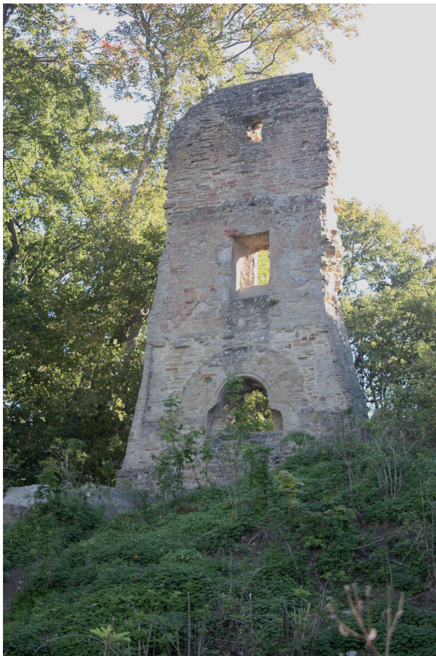
Abb. 12 Reste des Frankenturms der Ruine Speckfeld (Foto Oktober 2013)