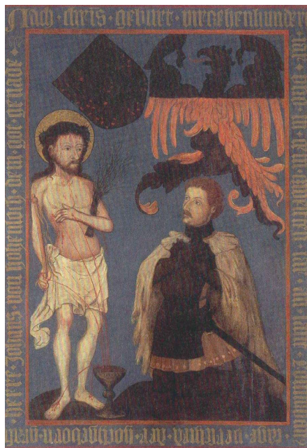
Abb. 6 Votivbild für Johann von Hohenlohe (unbekannter Nürnberger Meister, um 1417)