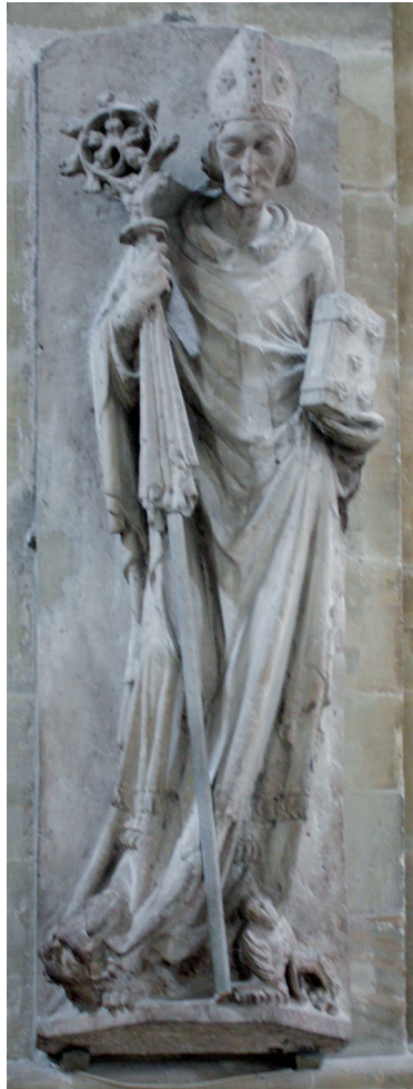
Abb. 9 Epitaph des Bamberger Bischofs Friedrich von Hohenlohe (Foto 2010)

dessen Söhne Ludwig I. (der Brandenburger, 1315–1361), Ludwig II. (der Römer, 1328–1365) und Otto V. (der Faule, 1346–1379) nacheinander von 1322–1373 Markgrafen bzw. Kurfürsten von Brandenburg waren. Gerlach war der Onkel des 1412 gefallenen Johann von Hohenlohe. Mit seinem Tod in Kremmen erlosch die Linie Speckfeld. Nur die Weikersheimer Linie bestand weiter. Sie spaltete sich in viele Verästelungen auf. Als Politiker des 19./20. Jahrhunderts sind insbesondere der bayerische Ministerpräsident und spätere deutsche Reichskanzler Chlodwig zu Hohenlohe-Schillingsfürst (1819–1901) und der österreichische Ministerpräsident Konrad zu Hohenlohe-Schillingsfürst (1863–1918) zu erwähnen.