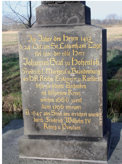
Abb. 2 Text des Kreuzes am Kremmer Damm (Text von 1845, Foto 2012)

lohe, dessen Tod am 24. Oktober 1412 und dessen Taten durch das Kreuz am Kremmer Damm 1 für alle Ewigkeit gewürdigt werden sollten? War es doch außergewöhnlich, dass einem Ritter ein über die Jahrhunderte mehrmals erneuertes Sühne- oder Gedenkkreuz errichtet und seine Leiche in der Klosterkirche zu Berlin zur letzten Ruhe gebettet wurde, in der bereits der erste Kurfürst von Brandenburg, Ludwig der Römer (1328–1365) aus dem Hause Wittelsbach, begraben war.