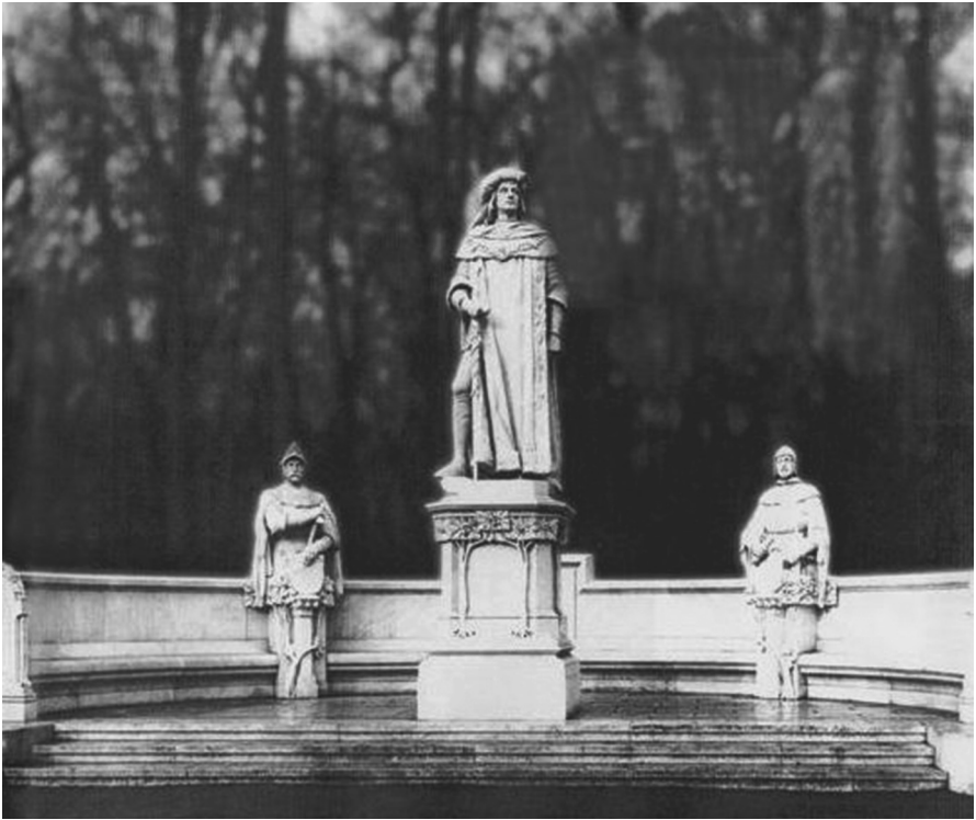
Abb. 11 Kurfürst Friedrich I. von Brandenburg mit seinen Getreuen Johann von Hohenlohe (li.) und Wend von Ilenburg (re.) auf der Berliner Siegesallee (Foto um 1910)

pommersche Heer aus einem nahen Walde vor, und griff die Brandenburger an. Johann sprach überall Muth ein, und that, was er nur immer konnte, seine schwache Schar zum Siege zu führen.“