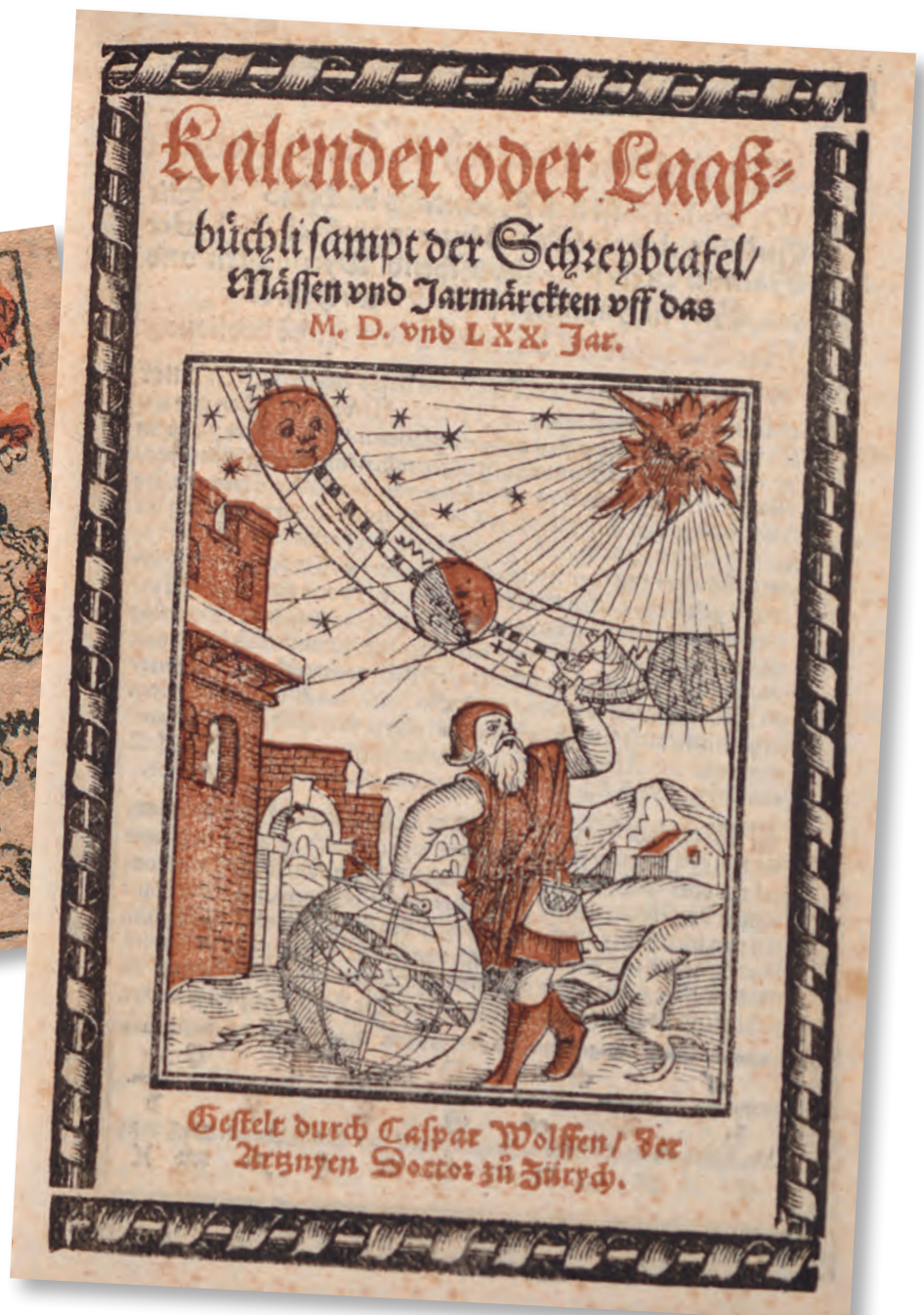
Gesteckt durch Caspar Wolffen / Der Arzneyen Doctor zu Zürich.

kreisen darstellte. Da sich das Jahr (solar) nicht ohne Rest durch die Zahl der Wochen (lunar) teilen lässt, kommen während der Aktivität des Druckers nur die sechs Jahre in Frage, zu denen die Sonntage auf die roten Sonntags-symbole fielen. Dabei ist zu berücksichtigen, dass die gregorianische Kalenderreform (1582) erst 1701 in Zürich übernommen wurde und man bis dahin nach dem alten, julianischen Stil datierte. Dass dies so ist, zeigt sich auch an der Eintragung einer „Finsternus“ zum 8. November nach altem Stil. Eine Mondfinsternis fiel 1603 auf den parallelen 18. November neuen Stils.