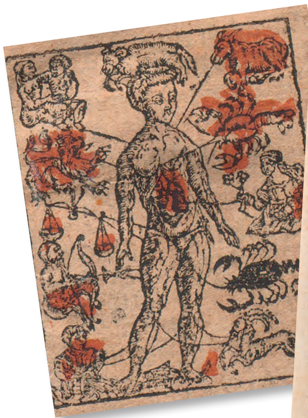
Aderlassmännlein aus dem Kalender sampt der Practick, Zürich 1602