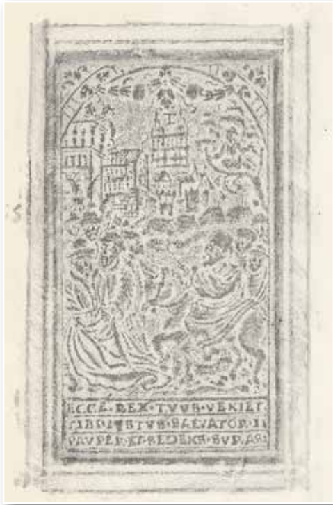
Abb. 20: Darstellung Meißeis (Ba tschech. 1579 01-1)

Die Lutherbibel sollte zum Leser so reden, „wie man auff dem marckt redt“. 7 Es ging um Verständlichkeit. Die Menschen sollten begreifen, dass ihre existenziellen Grundanliegen dort verhandelt werden. Auf die Kunst übertragen konnte dies bedeuten, die dargestellten Motive in ihrer