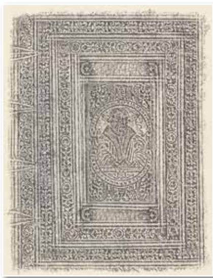
Abb. 1-2: Luther und Melanchthon als Durchreibungen (Ba lat. 1602 01)

Die Illustrationspraxis bezog sich auch auf die individuelle Gestaltung der Bucheinbände. Bereits die Tatsache der Verzierung des Einbandes sollte eine Wertschätzung des Inhalts oder auch Zwecks des jeweiligen Buches zum Ausdruck bringen. Allerdings verrät die Motivik des Einbanddekors einiges über die Wertempfindungen und geistigen Orientierungen einer Epoche.