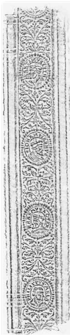
Abb. 3: Vierergruppe auf Rolle (Theol.fol.233-4)

zuerst genannten Personen waren im deutschen Sprachraum die bekanntesten Namen des 16. Jahrhunderts und wiesen die höchste Zahl an Publikationen auf. Bemerkenswert ist das, weil es ab 1525 zu heftigen Auseinandersetzungen zwischen Luther und Erasmus und nach 1560 zwischen den strikteren Schülern Luthers und den Anhängern Melanchthons kam. Deziert katholische Personen wie Päpste oder zeitgenössische Bischöfe wurden hingegen auf den Rollen nicht abgebildet und zwar auch nicht in den katholisch gebliebenen Gebieten und deren Buchbinderwerkstätten. Man kann bei der Kombination Luther, Melanchthon, Erasmus davon ausgehen, dass sie zunächst stellvertre-