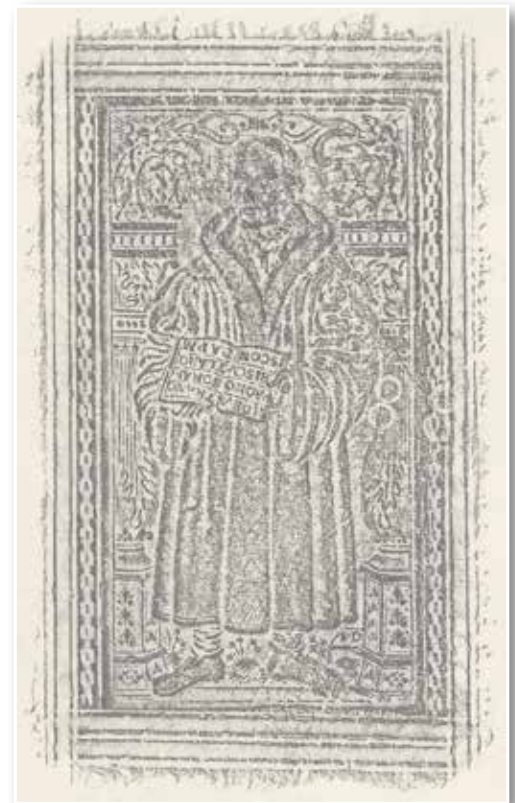
Abb. 24: Melanchthons Wappen (Theol.fol.1127)

Häufiger als in sich komplexe Werkzeugmotive war die Kombination von Werkzeugen mit in sich homogener strukturierten Motiven. Im Zentrum reformatorischer Theologie standen die Kreuzigung und Auferstehung Christi, durch die der Zusammenhang von Sünde und Tod durchbrochen wurde. Für den Einzelnen wirksam wurde dies