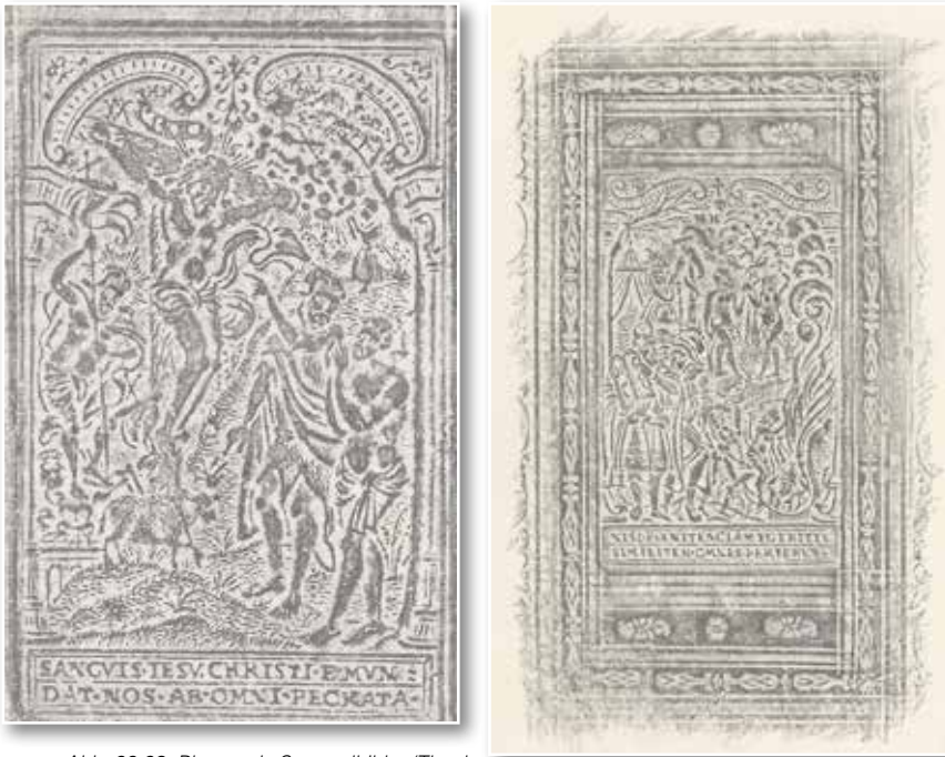
Abb. 22-23: Platten als Sammelbilder (Theol. fol.441)

Auch Platten konnten in sich als Sammelbild produziert werden. Zwei komplexe Sammelbilder wurden gelegentlich auf dem Einband kombiniert und erweiterten dadurch den Aussagegehalt. So verband der Buchbinder einer Ausgabe des Augsburgischen Bekenntnisses, Frankfurt 1572 (Theol. fol.441), in einer Platte auf dem Vorderdeckel die Kreuzigung und Auferstehung Christi mit Johannes dem Täufer, der auf Christus deutet, und vermutlich Adam, der die Menschheit vertritt. 8 Die Platte des Rückdeckels veranschaulicht die Ausgangslage, für die das auf dem Vorderdeckel dargestellte Geschehen eine Lösung herbeiführen soll: Sündenfall des Menschen, Gerichtsverfallenheit angesichts der Gebote Gottes (Mose mit Gesetzestafeln) und der drohenden Verdammnis in der Hölle, die Aufrichtung der Ehernen Schlange als temporärer, noch nicht universaler Gnadenerweis Gottes. Der Textzusatz spielt auf den Bußruf Jesu an (Lukas 13,5: „Wenn ihr nicht Buße tut, werdet ihr alle auch so umkommen“) und verknüpft über das Thema Umkehr diese Platte mit dem Vorderdeckel, auf dem Johannes der Täufer als über sich hinaus weisender Bußprediger dargestellt ist.