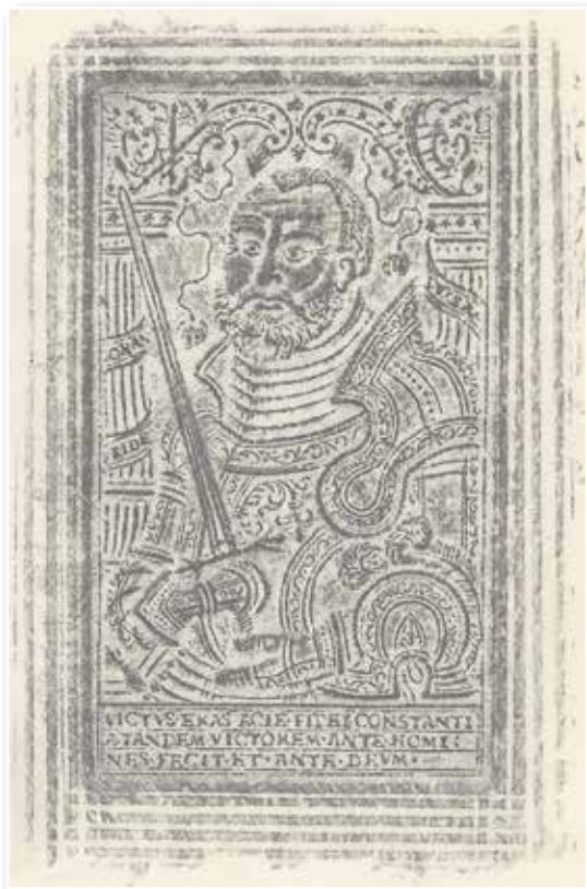
Abb. 13: Herzog Johann Friedrich I. von Sachsen (Kirch.G.fol.266)

ihres Selbstverständnisses im Sinne der Reformation. Auf den Vorderdeckel eines griechischen Neuen Testaments (Bb griech.1565 01) wurde eine Kreuzigungsszene in Verbindung mit Evangelistensymbolen aufgeprägt. Der Rückdeckel präsentiert Herzog Christoph von Württemberg. Zusammen genommen wurde angedeutet: Dieser Herrscher sieht sich im Sinne der Reformation der Heiligen Schrift (Evangelistensymbole) und zwar in ihrer Zuspitzung auf Jesus Christus als Erlöser verpflichtet. Wie kein anderer Herrscher nach ihm gestaltete Herzog Christoph sein Land zu einem dezidiert lutherischen Staatswesen um.