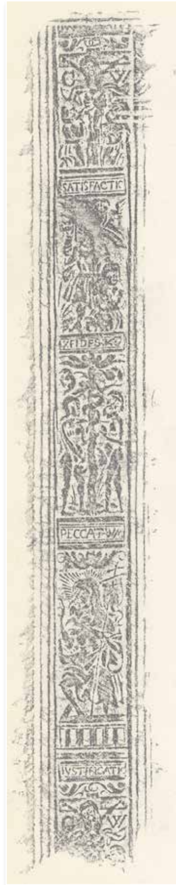
Abb. 21: Rolle zur Heilsgeschichte (Bb deutsch 1574 01)

Wie bei den Personen, so kann auch bei szenischen Motiven von Rollen durch die Auswahl, Gestaltung und textliche Erläuterung eine bestimmte Botschaft vermittelt werden. Charakteristisch für reformatorische Theologie ist deren Zentrierung auf das Geschehen der Rechtfertigung des Sünders aus Glauben um Christi willen. Das Heilswerk Gottes in Christus, die Sünde des Menschen und die unmittelbare Beziehung des Menschen zu Gott im Glauben bildet nach reformatorischem Verständnis den Kern der Heilsgeschichte.