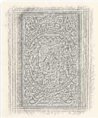
Abb. 9-10: Indirekte Aussage über Luther (Kirch.G.qt. 1421)

Viele Lutherbildnisse sollten durch Kleidung, Gestik und Körperhaltung bzw. Attribute wie die Bibel den Eindruck von Gelehrsamkeit, Entschlossenheit und Frömmigkeit vermitteln. Dies konnte aber auch indirekt durch die Kombination anderer Motive mit entsprechenden Textzusätzen geschehen. So wurde eine Ausgabe der bekannten Luther-Biographie des Johann Mathesius, Nürnberg 1588 (Kirch.G.qt. 1421), mit zwei Platten zu biblischen Erzählungen dekoriert. Auf dem Vorderdeckel wurde Simson dargestellt mit der Szene, in der er einen Löwen mit bloßen Händen zerreißt (Richter 14,6). 5 Dieses Verhalten steht für Mut und Entschlossenheit, aber auch Gottvertrauen. Auf dem Rückdeckel wurde das Salomonische Urteil dargestellt (1. Könige 3,16-28). 6 Salomo wurde dadurch zum Inbegriff der Weisheit.