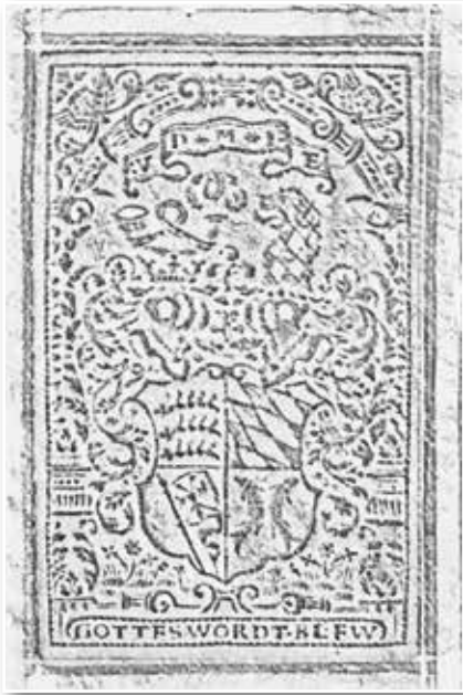
Abb. 16-17: Wappen und Jael-Platte (Theol.fol.233-4)