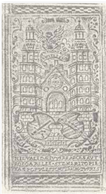
Abb. 29-30: Wort Gottes (Theol.oct.3116)

Leuchte und ein Licht auf meinem Wege“). Zusammen genommen sollte dies andeuten, dass Glaube vornehmlich auf dem Wort Gottes gründet, dem Wort hierbei eine Orientierungsfunktion auf dem Weg des Lebens zukommt. Präzisiert wurde dies noch durch das Textfeld in einem Schriftbalken unter dem Mitteloval: „Qvae Dea? Religio. Qvae nam dvo lumina= Verbvm. Qvi mvri? Angelici svnt gregis excvbi“ (= Welche Göttin? Religio. Welches sind denn die Lichter: das