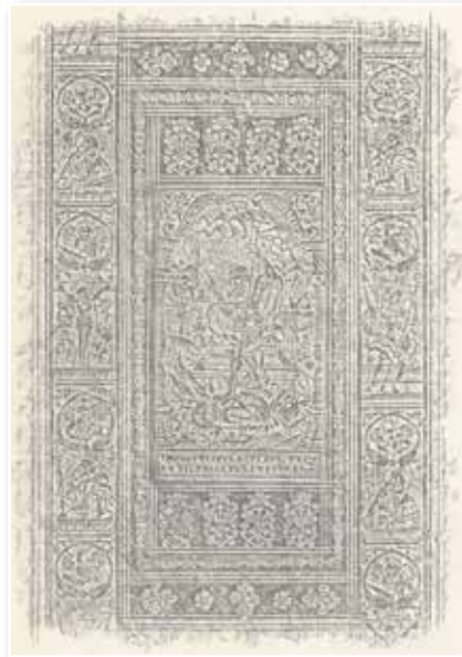
Abb. 25-26: Kreuzigungs- und Auferstehungsplatte (Theol. fol. 1420)

Der Einband einer Werkausgabe des dezidiert lutherischen Theologen Urbanus Rhegius (1489-1541), Frankfurt 1577 (Theol.fol.1420), weist diese Kombination einer Kreuzigungs- und Auferstehungsplatte auf. Der Tod wird auf der Auferstehungsplatte als Ungeheuer dargestellt, was auf den Teufel als dritte der von Luther so genannten Verderbensmächte hindeutet. Der Dresdener Buchbinder Brosius Faust umrahmte die Platten mit einer Rolle, auf der neben der Kreuzigung und Auferstehung auch Petrus und Paulus sowie die Evangelistensymbole zu sehen sind. Diese Zusammenstellung sollte im Sinne Luthers aussagen: Das Heilsgeschehen ist zugänglich über das Wort der Evangelien und neutestamentlichen Briefe. Das Heil kommt allein durch Christus, geschieht allein aus Gnade, ist inhaltlich und formal zugänglich allein über das Wort Gottes und wird wirksam allein im Glauben. Auf buch künstlerische Weise wurde der innere Zusammenhang des vierfachen „Allein“ der Reformation veranschaulicht.