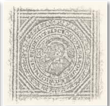
Abb. 14-15: Ferdinand I. und Johann Friedrich I. (Ba deutsch 1523 02)

Die Verzierung eines Einbands aus einer noch relativ frühen Phase der Reformation (1532) spiegelte die diplomatischen Hoffnungen der protestantischen Stände wider (Ba deutsch 1523 02). Auf dem Rückdeckel wurde Johann Friedrich I. von Sachsen abgebildet, auf dem Vorderdeckel jedoch nicht der amtierende römisch-deutsche Kaiser Karl V., sondern dessen späterer Nachfolger Ferdinand I. (1503-1564). Ferdinand hatte sich nämlich schon früh für eine konfessionelle Realpolitik und eine Duldung der Reformation ausgesprochen. Mit seiner Position auf dem Vorderdeckel einer Teilausgabe der Lutherbibel ging der Appell zu einer pragmatischen Kirchenpolitik auf Reichsebene einher.