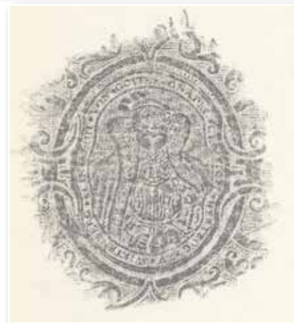
Abb. 11-12: Herzog Christoph und Theologie (Bb griech. 1565 01)