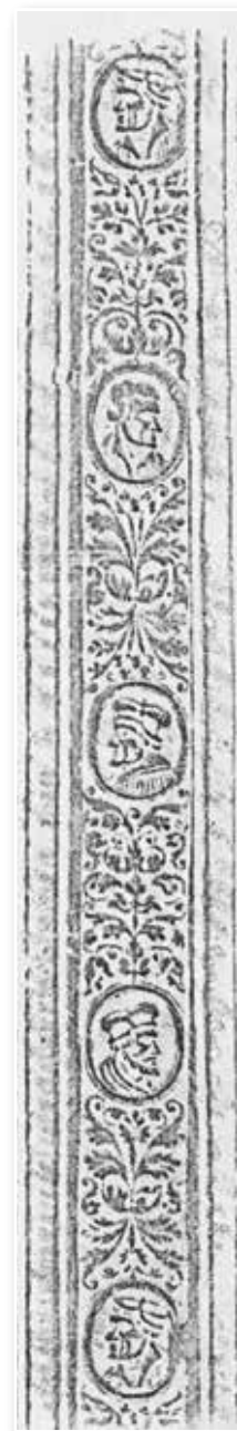
Abb. 4: Reformatorenköpfe ohne Namen (Werkstatt H. V. M.)