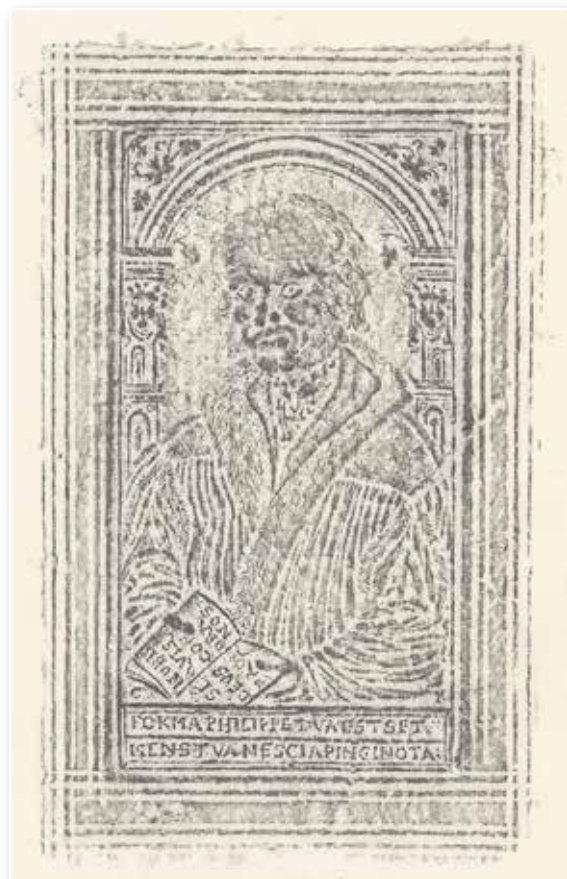
Abb. 8: Melanchthon mit doppeltem Motto (B lat. 1567 09)

fortitudo vestra“ (z.B. Bb lat.1643 01). Luther übersetzte in der Ausgabe letzter Hand (1545): „Durch stille sein vnd hoffen wuerdet jr starck sein“. Es geht also erstens darum, von sich weg auf einen außerhalb seiner selbst liegenden Bezugspunkt zu sehen, sich zurückzunehmen, zu empfangen. Zweitens handelt es sich bei dem externen Bezugspunkt nicht um ein neutrales Etwas, sondern um Gott als personales Gegenüber. Daraus entstehen die Gewissheit in der Hoffnung sowie die Stärke, die verliehen, nicht erarbeitet ist. Dieses „extra nos“ (außerhalb von uns) markiert den Kern der reformatorischen Entdeckung Luthers und passt daher gut als Motto. Das Zitat ist zugleich auf die Zukunft ausgerichtet und sollte durch die künstlerische Vergegenwärtigung den Anhängern der Reformation Mut machen.