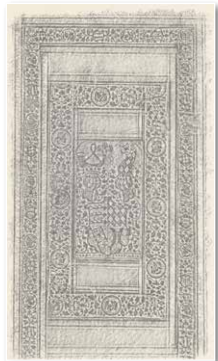
Abb. 18-19: Wappen von Württemberg und Hessen mit Motto (Theol.fol.1153)