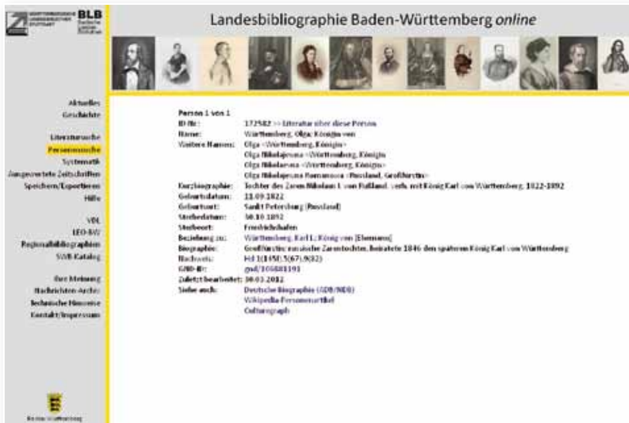
Abb. 2: Personensuche auf der neuen Website: Einzeltrefferanzeige zur Königin Olga von Württemberg ( http://www.statistik.baden-wuerttemberg.de/LABI/PersDB.asp , 12.03.2014)

Nach Freischaltung der neuen Website gehen die Arbeiten weiter. Geplant sind neben der Websitepflege auch neue Funktionen. So soll dem Wunsch nach einer Weiternutzung der bibliographischen Daten entsprochen werden.